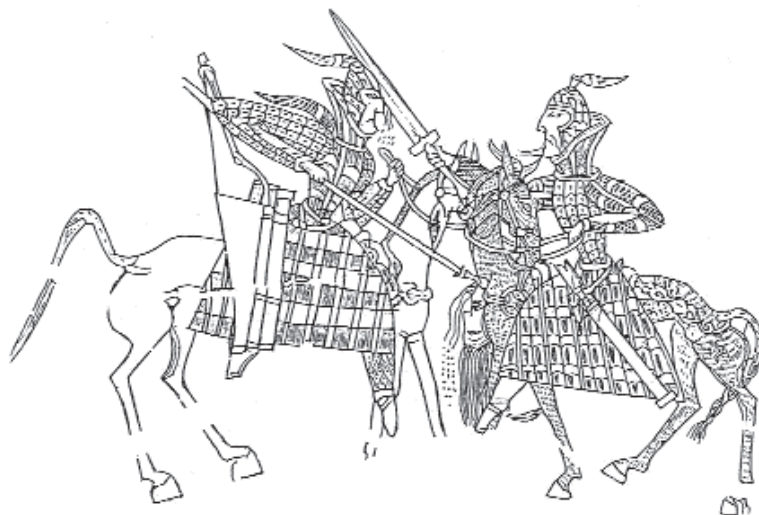
Íráni nehézfegyverzetű harcosok az orlali lemeztől

A Kárpát-medence szarmata lakosságának régészeti anyaga a sztyeppeihez képest gyökeresen megváltozott. Ezeket a változásokat nem hagyhatjuk figyelmen kívül, egyúttal számolnunk kell azzal is, hogy a szarmaták meglehetősen hosszú ideig – az 1. századtól 5 az 5. századig – a Kárpát-medence keleti felének lakói voltak. Minthogy ilyen hosszú idő alatt – és erre a leletanyag változása is utal – a viselet némi változáson esik át, el kellett döntenünk, hogy a piacot melyik korszakban, hol és milyen évszakban képzeljük el. A 2. század