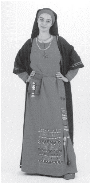
Szarmata nő a Magyar Nemzeti Múzeum állandó régészeti kiállításán

selyemszövet, míg a köpeny kevésbé sűrű szövésű. Mindkét anyag szerkezete hamis ripsz, ami azt jelenti, hogy a vászonkötésű textilnél a vetülékfonal sokkal vastagabb, mint a lánca.