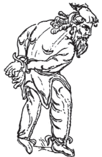
Szarmata fogoly a szkítákéhoz hasonló kaftánban a Verhivnyában talált római érmen

részben tágult. A Nagy Géza által használt források köre az újabb régészeti feltárások anyagával jócskán kibővült. Figyelembe vehetjük továbbá a sztyeppei összehasonlítható anyagot (mind a régészeti leleteket, mind az ott előforduló ábrázolásokat). Elsősorban a régészeti leleteknek köszönhetően alakult ki elképzelésünk a női viseletről, amely korábban teljesen hiányzott, mivel a római (és a sztyeppei) ábrázolásokon a barbár női ruhák sematikusak, a források pedig hallgatnak az asszonynepről. A további kutatások számára a szkíta művészet elemzése nyújthat némi támpontot, hiszen a