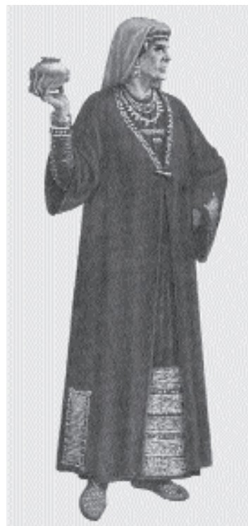
Női viseletrekonstrukció a Szokolova Mogila-i sír alapján

Az Ukrajnában, a Dél-Bugnál feltárt gazdag papnő sírjában sötétkék, illetve bíborszínű textilmaradványokat tártak föl. Az aranszállal hímzett, illetve aranyfíttelrel kivarrt viseleti részek egyúttal a ruha szabásáról is árulkodtak. (Zárójelben jegyezzük meg, hogy az ukrán és orosz kutatás is a Szokolova Mogila-i viseletrekonstrukciót tartja a leginkább mérvadónak.)