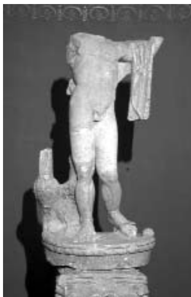
Jupiter Teutanus szobra az úgynevezett Helytartói Villából, Kr. u. 3. század

sírokba, amelyekhez a korábbi temetők sírmelekei is felhasználták.