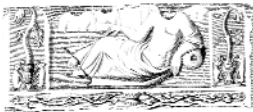
Köemlékek Schönvisner könyvéből: a. Szökőkút létesítését megörökítő felirat (az emléket a Magyar Nemzeti Múzeum őrzi) b. Fekvő nymphát ábrázoló, mára elveszett domborműves tábla

Ezeket a szak-szerű leírásokat már a publikációk, az ókortudomány, az epigráfia-filológia kezdetének tekinthetjük. Az akkor leírt köemlékek többsége azóta elveszett, de felirataikat éppen ezeknek a továbbhagyományozott feljegyzéseknek az alapján tanulmányozhatta és tette közzé az évszázadok a későbbi tudományos kutatás. Felice Feliciano személye sokáig rejtve maradt; az addig