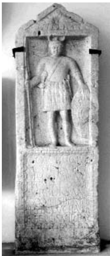
C. Castricus Victor legiokatona sírsztéléje, amelyet a Corvin téren a Budai Vigadó alapozásánál találtak, Kr. u. 1. század vége