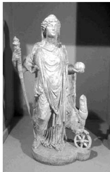
Fortuna Nemesis szobra a Hajógyári szigeti helytartói palotából, Kr. u. 3. század

táborhelye, csakúgy, mint a polgárváros, páratlanul gazdag epigráfiai hagyatékban jelenik meg. A folyamatos ásatások következtében egyre bővülő köemlék-anyag a római kori történeti, vallástörténeti és művészettörténeti kutatás egyik leggazdagabb forrása.