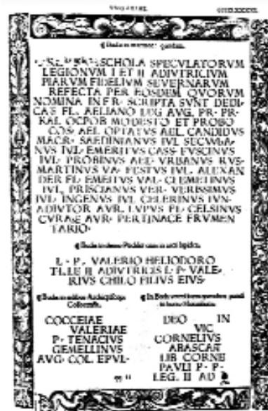
Aquincumi feliratok Petrus Apianus corpusából (R. Szalay Ágnes nyomán)

Ezeket a szak-szerű leírásokat már a publikációk, az ókortudomány, az epigráfia-filológia kezdetének tekinthetjük. Az akkor leírt köemlékek többsége azóta elveszett, de felirataikat éppen ezeknek a továbbhagyományozott feljegyzéseknek az alapján tanulmányozhatta és tette közzé az évszázadok a későbbi tudományos kutatás. Felice Feliciano személye sokáig rejtve maradt; az addig