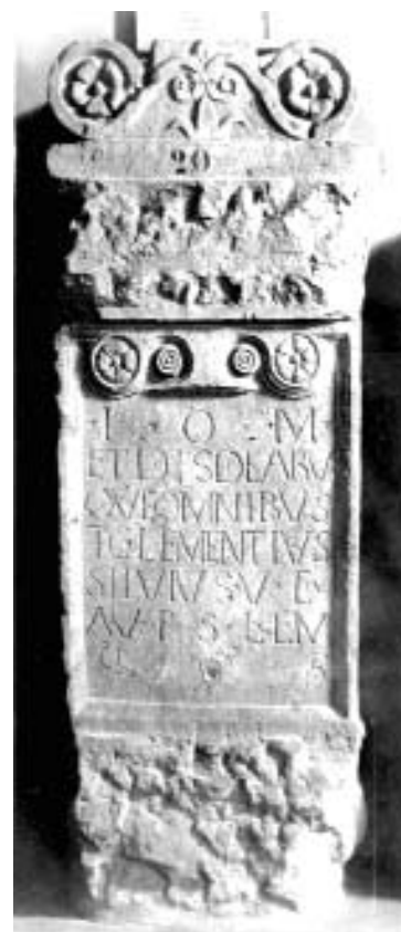
Oltárkö, amelyet Iuppiter és valamennyi isten tiszteletére T. Clementinus Silvius helytartó állíttatott, Kr. u. 267–269

A felirattal és domborművel díszített kősírládák (szarkofágok) használata csak a 3. században terjedt el. A 4. században gyakran temetkeztek kőlapokból összeállított