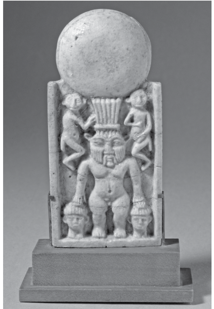
3-4. kép. A Los Angeles County Museum of Art AC1992.152.59-es számú kozmetikai kanala. Egyiptom, Későkor (Kr. e. 712-332). AC1992.152.59, The Los Angeles County Museum of Art, Los Angeles.

inkább ott vannak a kezei alatt, Bész ujjai pedig nem behajlítva, hanem kinyújtva láthatók. Ezzel tehát a két kanál – ahogy a majmok könyökének behajlításánál is megfigyelhettük – Bész ugyanazon ikonográfiai típusának kis mértékben eltérő variánsait jelenítik meg.