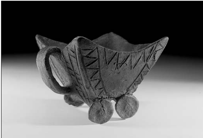
Rézkori agyag kocsimodell, Szigetszentmárton, Kr. e. 3500-3000 (Magyar Nemzeti Múzeum)

amelyek a múzeumi műtárgy és a látogató újfajta viszonyát teszik lehetővé. A második teremben például a rekonstruált tiszaluci telep palánkjának oszlopai közötti részen keresztül lesheti meg a látogató az adott telepen használt-talált edényeket. Hogy ez a részben rejtett elrendezés még mennyire idegen a hazai múzeumi szokásoktól, és mennyire ismeretlen a múzeumlátogató számára, jól mutatja, hogy ott jártunkkor egy hatéves kisfiú szülői engedélyre várt, hogy közel mehessen az erődrekonstrukcióhoz, illetve beléphessen az oszlopok közé, ahonnan a kiállított agyagtárgyak is láthatóvá válnak, édesanyja azonban éppolyan bizonytalan volt a látogató szabadságát illetően, mint gyermeke.