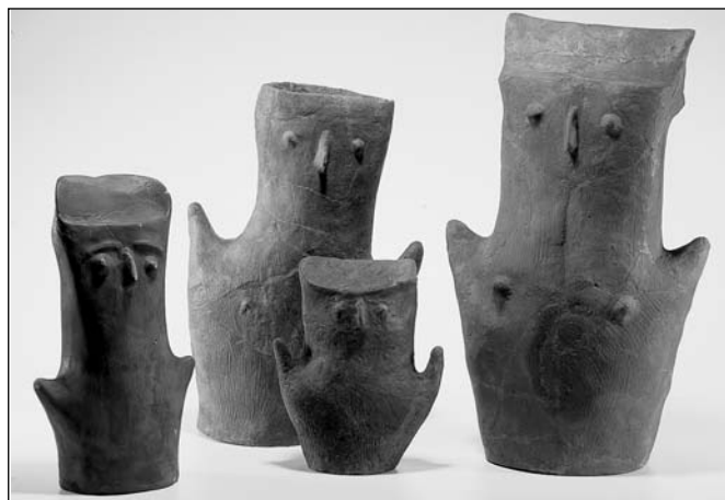
Ember alakú agyagurnák, Ózd-Center, rézkor, Kr. e. 3500-3000 (Magyar Nemzeti Múzeum)

A 2. terem a neolitikum és a rézkor emlékeiből ad ízelítőt. Fénykijelzős térkép nyújt áttekintést a neolitikum néhány reprezentatív tárgyának (agyag házmodellek, idolkok, arcos edények, trónuson ülő istenségek stb.) elterjedtségéről a Közel-Kelettől a Kárpát-medencén keresztül a Germán-alföldre. Megcsodálhatjuk az agyagból készült állatszobrocskákat, vagy a csiszolt kőfegyverek és csonteszközök legszebb példányait. A korszak egyik vívmánya volt az oszlopos vázú agyagfalú ház, melynek berendezett rekonstrukcióját is elkészítették a rendezők. A tárlókban látható tárgyakat eredeti vagy feltételezett, a használatra utaló elhelyezésükben is láthatjuk. Ízelítőt kapunk a neolitikum ékszereiből és kő, illetve hidegen kovácsolt réz dísztárgyaiból. Szintén fontos technikai újítás a rézkor végén megjelenő négykerekű, szarvasmarha vontatású kocsi, amelynek sírokból előkerült „makettjeit” is megnézhetjük, sőt meg is tapogathatjuk.