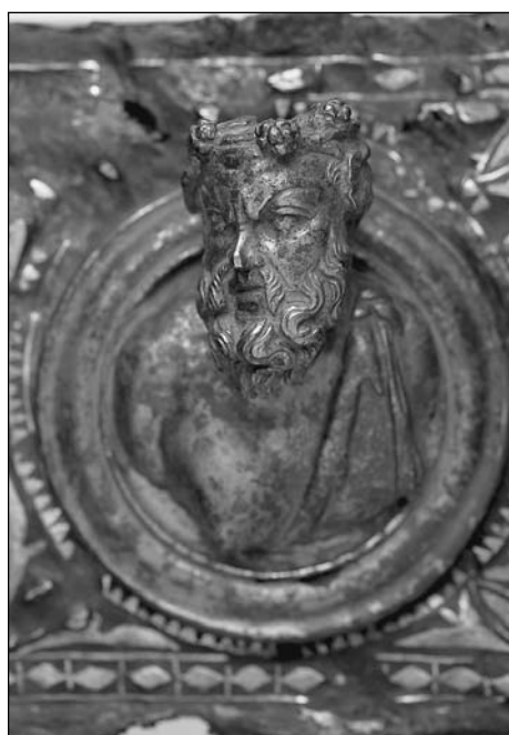
Bronz kocsíveret részlete, Budakeszi, Kr. u. 2. század (Magyar Nemzeti Múzeum)

A 6. teremben a római kori Pannonia és a vele egykorú barbaricum emlékei kerülnek bemutatásra. A terembe egy