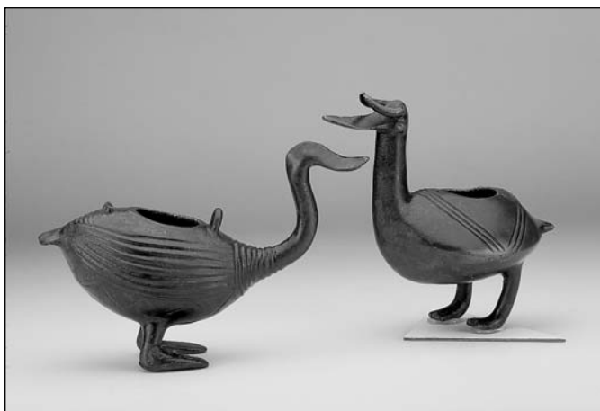
Madár alakú bronzedények, Csicsér, ismeretlen lelőhely, Kr. e. 10. század (Magyar Nemzeti Múzeum)

A Kárpát-medencei bronzkor gazdag és sokrétű fémművességéről a 4. teremben kiállított bronz és aranyleletek tanúskodnak. Ezek kisebb része telepekről, temetőkből származik, nagyobb hányaduk elásott-elrejtett kincs napvilágra került maradványa, melyet egykori tulajdonosának már nem volt alkalmja újra kiásni.