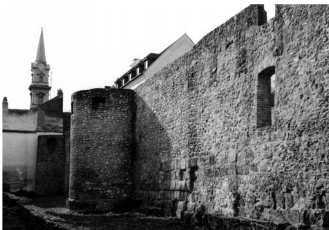
A későrómai városfalra ráépített középkori városfal (a szerző felvétele)

1999. június 21-én nyílt új kiállításunkon egymás mellett szerepelnek az utóbbi két évtizedben feltárt kiemelkedő leletek, gyűjteményünk európai hírű, régi szerzeményeivel. A hét kiállítási terem szinte mindegyikében található olyan régészeti műtárgy, amely meghatározó jelentőségű valamelyik korszak kutatásában, és mint kölcsöntárgy gyakori „vendége” egy-egy európai kitekintésű, nagy külföldi gyűjteményes kiállításnak. Stockholm, Frankfurt, Athén, Milánó, Brescia tárlatain szerepeltek a közelmúltban Sopron környéki leletek. Az új kiállítás vendégkönyvének bejegyzése szerint pedig szinte a „világ minden részéről” érkeznek látogatók Sopronba, akik nem hagyják ki a város legszebb gótikus polgárházában, a középkori városfal mellé épített Fabricius-házban berendezett régészeti múzeum megtekintését sem.