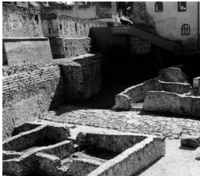
A városból kivezető Borostyánkő út a későrómai fal által eltorlaszolva

Korszakonként bemutatjuk azokat a távolsági hatásokat, amelyek meghatározók voltak Sopron és vidéke, a Borostyánkő út melletti települések életében. A kereskedelmi áruk cseréjével terjedő kulturális hatások mellett a fegyveres hódításokkal, népek vándorlásával együtt járó határozott változások is jól nyomon követhetők a kiállított leletanyagban.