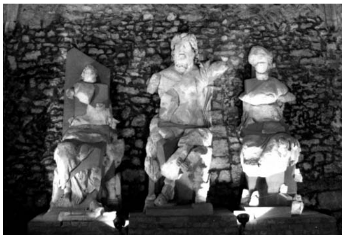
A capitoliumi triász

A régészeti kiállítás helyszíne: Sopron, Fő tér 6. Fabricius-ház. Nyitva: Októbertől áprilisis naponta 10–14 óráig, májustól szeptemberig naponta 10–18 óráig. Hétfőn zárva. Belépődíj: 400 Ft. Diákoknak és nyugdíjasoknak: 200 Ft.