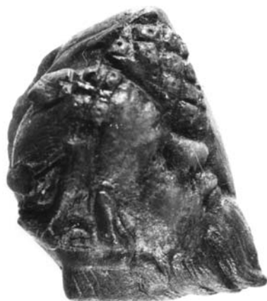
Szilénosz fej borostyánkőből

A III. teremben Sopron római kori elődjét mutatjuk be. Ebben a korban hatalmas változások játszódtak le térségünkben is. Új, eddig ismeretlen áruk tömegesen érkeztek erre a vidékre, háttérbe szorítva a léteért még évtizedekig