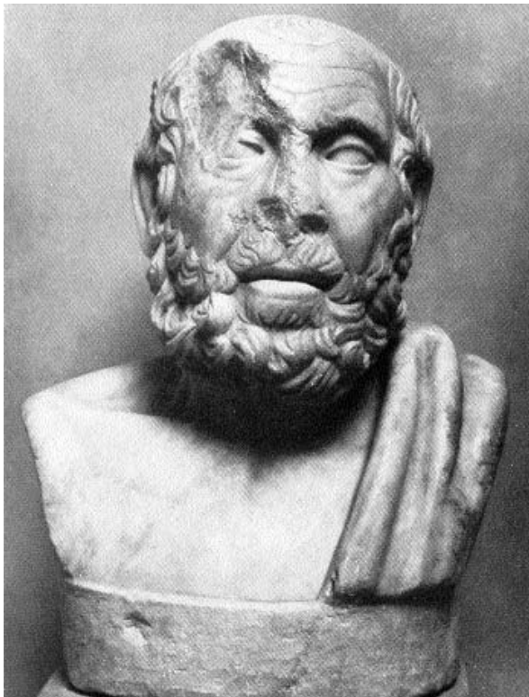
Hippokratész hellénisztikus kori büsztjének római kori márványmásolata (Ostia Múzeum)

fiatal asszonyokat érinti: „Ugyanis nekik, akiknek koruk, életük és lelkük is különösen mozgékony, méhük is hasonlóképpen kóborló. Az idősebb asszonyok kora, élete és lelke azonban megállapodott, s így méhük is.” ( Az akut betegségek jeleiről és okairól 2. 10.). Szóranosz Galénoszhoz hasonlóan elveti a méh vándorlására vonatkozó elképzelést. Ennek ellenére leírja, hogy vannak olyan helyzetek, amelyek hozzájárulnak a hisztérikus fulladás kialakulásához, és ebben a legtöbb orvos egyet is ért. Szóranosz szerint „az okok között leggyakrabban szerepel a túl sok vetélés, a túl korai terhesség, a hosszú ideig tartó özvegység, a menstruáció megrekedése, a terhesség megszakítása, a méh duzzadása”. (Szóranosz 3. 26.).