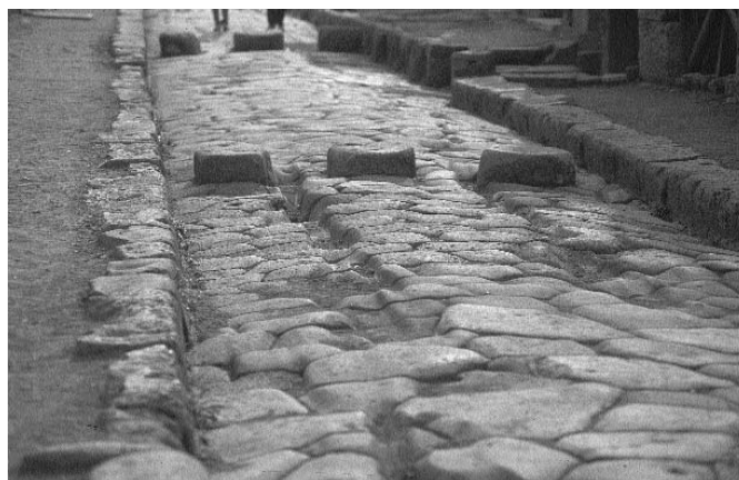
2. kép. „Zebracsíkok” Pompeiben

mosórendszer áldásos hatásáról írt. Aki Pompeibe látogat, sokkal jobban érti majd, hogy a gyalogosátjárók ottani, illetve másutt is megtalálható „zebracsíkjai” miért emelkednek ki az útfelületből (2. kép). Nemcsak száraz lábbal, hanem lehetőség szerint tisztán is kellett átkelni az utcán.