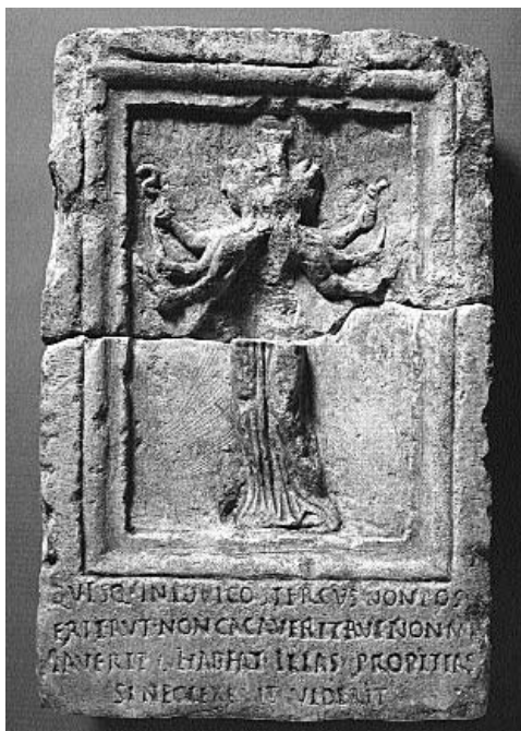
4. kép. Feliratos relief Salonából

szág) városának egy vicus -át, azaz utcáját vagy negyedét helyezik a háromalakú útvédő és alvilági istennő, Hekaté védelme alá. A kőtáblán az istennőt ábrázoló relief mellett a következő felirat olvasható: „Ők (a három Hekaté – a szerző megjegyzése) legyenek kegyesek mindenképp, aki ebben az utcában/negyedben nem rak le szemetet vagy bármiféle módon szükségét nem végzi el! Aki ellenben nem törődik ezzel, az megnézheti magát!” (CIL III 1966).