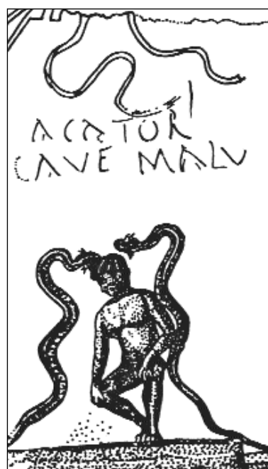
3. kép. Cacator / cave malu. Pompeii feliratos falfestmény

Nem a járókövek elhelyezése és az utcák mosása voltak azonban az egyedüli rendelkezések, amelyekkel a hivatalok az utcák tisztántartásáért küzdöttek. Jogi források szerint a közutak mentén fekvő telkek tulajdonosai kötelesek voltak tisztán tartani az utakat. A háztulajdonosok már csak emiatt a törvényi előírás miatt is – amint azt a nagy mennyiségben megmaradt tiltó táblák is bizonyítják – kintartó, de kilátástalan harcot folytattak egy az egyszerű nép körében elterjedt rossz szokással szemben. A járókelők – bár léteztek nyilvános illemhelyek – zavartalanul végezték kisebb és nagyobb dolgaikat a város kellős közepén a házfalak mellett. Egy pompeii falfestmény in flagranti , meztelenül és guggolva ábrázol egy ilyen elkövetőt (3. kép).