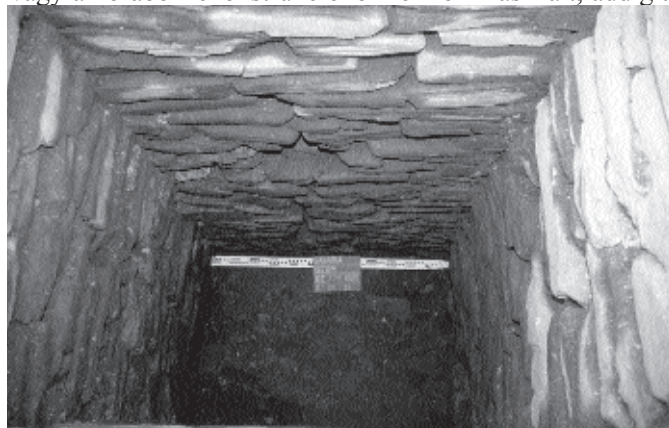
Az Isis templom kútja

Nem utolsó sorban ez a tény is indokolta, hogy a darabokat 2001 őszén a beton védőtető és a gerendázat megbontásával restaurátori segítséggel leemeljük, a darabok állagvédelme mellett lehetővé téve azok művészettörténeti, vallástörténeti, építészeti és természettudományos vizsgálatát is. A tübingeni egyetemen elvégzett elemzések szerint a Dráva-völgyi Gummernből származó, márványból készült homlokzati elemek minden bizonnyal a szentély átalakításakor és bővítésekor, a Severus-császárok alatt kerültek a pódiumtemplom homlokzatára. A Szombathelyi Képtárban tavaly februárban Szabó Miklós professzor által megnyitott kiállításon voltak először láthatók az Iseum-fríz hatalmas, másfél-kétfőtönös márványtömbjei és az újonnan előkerült, vagy a korábbi rekonstrukcióhoz fel nem használt, addig a