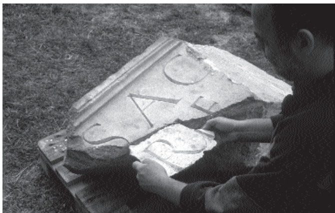
A szentélyfelirathoz illeszkedő betűk a 2001-es ásatásból