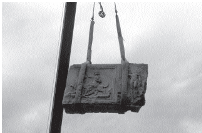
A homlokzatot díszítő egyik márványfaragvány leemelése 2001 szeptemberében

pécsi egyetem ókortörténet hallgatói előtt tartott előadásában ismertetett. Az új olvasati javaslata: