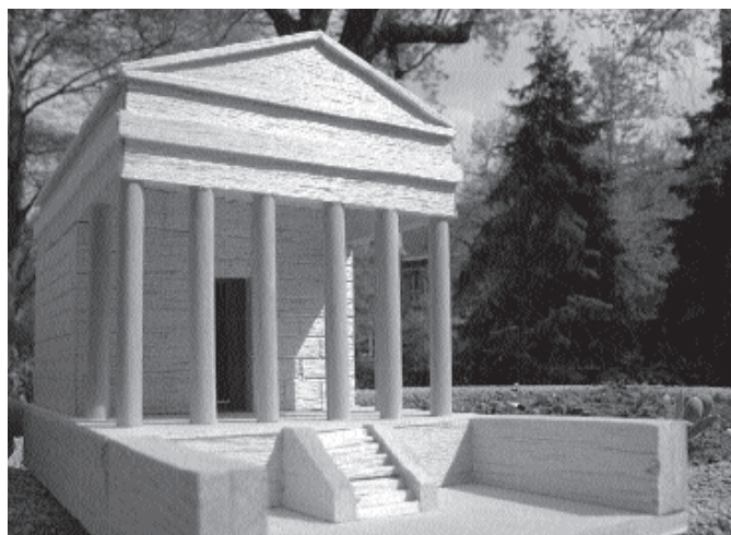
A pódiumtemplom rekonstrukciója (Mezős T.–Mráv Zs.–Sosztarits O.)

Az embercsontok a már elhagyott és részben lerombolt szentély területén létesült temetőhöz tartozhattak, és a 4. század végén, a szomszédos horreum (gabonátároló) építéskor végzett tereprendezés során kerültek a kútba. Minden bizonnyal a kúttól indult az a föld alatti csatorna-rendszer is, amely a szentélyudvart átszelve a nyugati cellasor alatt haladt a Perint- (antik nevén Sibaris- vagy Savarias-) patak irányában. A kúttal és a csatornahálózattal természetesen nemcsak a keleti kultuszokban általános rituális tisztálkodás purgatoriumként vagy lavacrumként ismert létesítményei kerültek elő, hanem feltehető, hogy a folyóvíz, mint „mesterséges Nílus” a kultuszcselekményben is meghatározó jelentőséggel bírt. Merkelbach közelmúltban megjelent monográfiája bőségesen ismerteti azokat az antik leírásokat és ábrázolásokat, amelyek alapján feltételezhetjük, hogy az Isis-szentélyeket vagy ezek legalább egy részét a kultusz legfőbb ünnepén a navigium Isidi idején vízzel árasztották el, hogy az istennő hajójának rituális vízrebocsátását megjeleníthessék. Természetesen mindezt csak ott volt szükség, ahol természetes vízfolyás – például a Philae szigetén épült főtemplom esetében maga a Nílus – nem állt rendelkezésre.