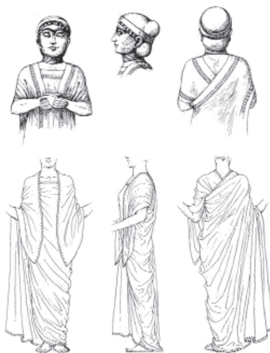
5. kép. A talán Gudea feleségét ábrázoló girszui zsírköszöbor rajza. Kr. e. 22. század (Párizs, Louvre). Az alsó részen a kétesűcsos sálruha viseleti rekonstrukciója

A mezopotámiai régészet és filológia általános problémája, hogy a régészeti (itt a képi) és az írásos forrásokat nehéz összeegyeztetni, az egyes kifejezéseket gyakran nem tudjuk ruhafajtával azonosítani. Mint láttuk, a legtöbb ruhatípus egy téglalap alakú textilből áll, amelyet valamilyen módon a test köré csavartak. Ezért nem meglepő, hogy a szövegek kifejezései alapvetően az anyagtípusokra vonatkoznak. Ezek az elnevezések olyan hosszú élettartamúak, hogy feltehetően jelentős jelentésváltozáson mehetek át. További gondot jelent az értelmezésben, hogy egy-egy sumer kifejezésnek több akkád megfelelője is volt, ugyanakkor a szövegek legtöbbször csak a sumer szavakat használják. Megkönnyíti viszont a textil- és ruhafajtákra vonatkozó szavak felismerését, hogy az ékírás az egyes főneveket eléjük vagy mögéjük helyezett értelmező jellel, úgynevezett determinatívummal azonosította, amit az átírásban hagyományosan azzal jelzünk, hogy a felső indexbe tesszük.