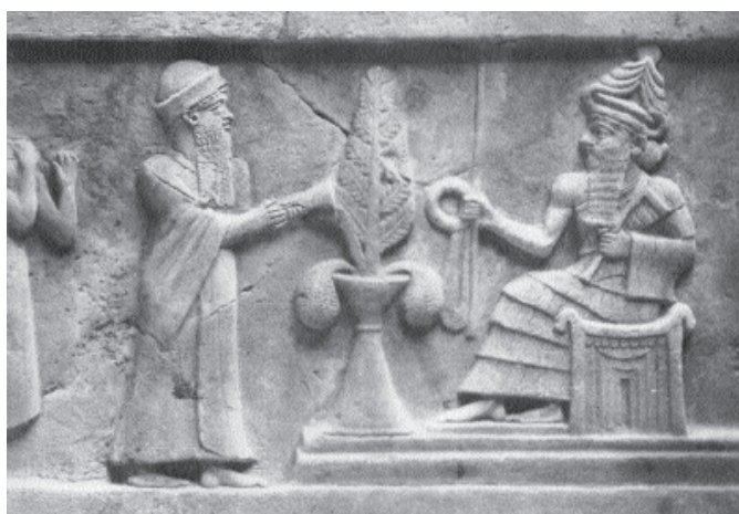
7. kép. Ur-Namma beavatása az Ur-i sztéléjéről. A képen a togaruhát viselő uralkodó, a fodros ruhát viselő Nannának, a holdistennek mutat be áldozatot, és átveszi az aralom jevényeit a pálcát és a karikát. Kr. e. 2112–2095 (Philadelphia, University Museum)

KLASSZIKUS (ÚJSUMER-ÓBABILÓNI) VISELET. Az Akkád Birodalom kora a viseletben átmenetet mutat a kora di-