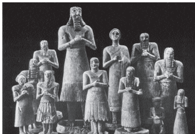
2. kép. Kora dinasztikus imádkozó szobrok gyűjteménye az eszunnai Ab-Ú-templomból. A nőknél vállruha, a férfiakra pedig lepel szoknya. Kr. e. 27. század (Bagdad, Iraq Museum és Chicago, Oriental Institute)

1. Lepelszoknya (Wickelrock) . A mezopotámiai forró klímában az öltözködés társadalmi normái kevésbé a test védelmét szolgálják, sokkal fontosabb a kulturális jelentésük. Nem véletlen, hogy a legkorábbi férfi ruhadarabok az egyszerű lepel szoknyák, melyek csak az alsótestet takarják el. Ennél a ruhadarabnál egy négyzetes vagy téglalap alakú kendőt csavartak fel a testre az óramutató járásával ellentétes irányban úgy, hogy az anyag széle a test bal oldalán végződött. A derékon különböző módokon rögzítették: vagy a kendő felső szélét csavarták ki többszörösen, míg egy szoros hengeres gyűrű nem képződött, vagy egymásba hurkolt övvel, máskor a derékon többszörösen körülcavart zsineggel. E szoknyatípust egyszerűsége ellenére számos különböző változatban viselték a kendő nagysága, anyaga és a derékrögzítés módja szerint. Létezett rövid, illetve hosszú változatban, de hordhattak többet is egymáson úgy, hogy a hosszú felsőszoknyát nem csavarták teljesen körbe, hanem a nagyobb mozgásszabadság miatt elől hagytak egy nyílást. A sima anyagok mellett a korai sumer időszak (korai dinasztikus kor) legjellegzetesebb ruhadarabjai a rojtos szoknyák ( Zottenrock ) különböző változatai (1–2. kép).