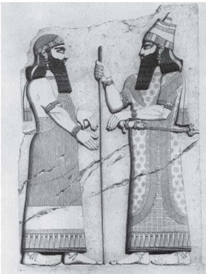
8. kép. II. Sarrukín és a turtánu ábrázoló dúr-sarrukíni (horszabádi) dombormű rajza. Mindketten tunikát és sálat viselnek. Kr. e. 721–705 (Eredetije Párizs, Louvre)

Az asszír ábrázolásokon nők szinte mindig csak a foglyul ejtett ellenség soraiban bukkannak fel, az asszír udvar hölgytagjainak öltözetéről nagyon kevés képi forrásunk van. A ritka kivételek közé tartozik az Assur-bán-apli nini-vei palotájában előkerült szőlőlugas-jelenet, melyen a klinén fekvő uralkodó mellett felesége ül egy magas trónon. A királyné ugyanolyan karperecet és fülbevalót visel, mint férje. A hosszú, díszes tunika és a testre tekert, hasonló mintájú rojtozott sál már más, inkább a Kr. e. 9. század udvari viseletére emlékeztet. A királyné fején várfalat idéző