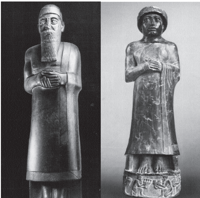
3. kép. Istup-ilum szobra Máriaiból. Az uralkodó nyitott lepelruhát visel. Kr. e. 19. század (Aleppo, Régészeti Múzeum)

A lepelruha férfiviselet volt, amelyet magas státuszú