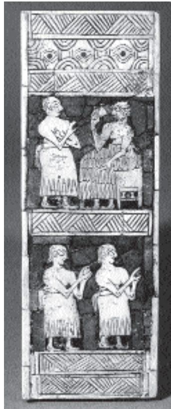
1. kép. Egy kaunakészt viselő sumer enszi. Lazúrkő- és kagylóberakásos panel egy lyra elejéről. Ur-i királysírok, Kr. e. 26. század (Philadelphia, University Museum)

A marhabőrt a katonai felszerelésen kívül övek és lábbelik (szandálok, csizmák) készítésére használták, míg a fémeket (bronz, ezüst, arany) és féldágaköveket (lazúrkő, karneol, achát stb.) ékszerek és kiegészítők (ruhakapcsoló tűk) előállítására során alkalmazták.