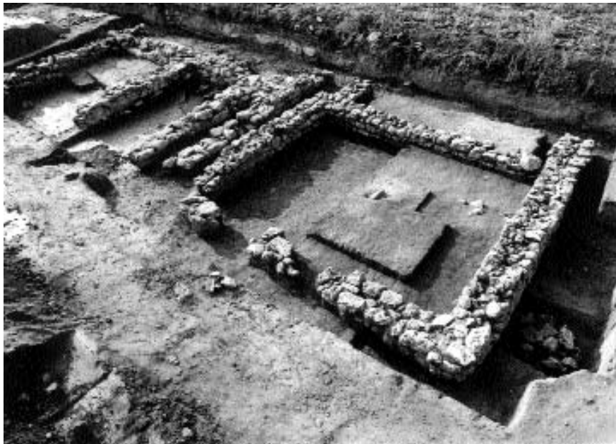
Római kőépület részlete

részen húzódtak. A kőépületek között s azoktól északra földbemélyített házak, gödörlakások, tároló vermek, szemétgödörök, kemencék helyezkedtek el. Ez volt az ipari negyed.