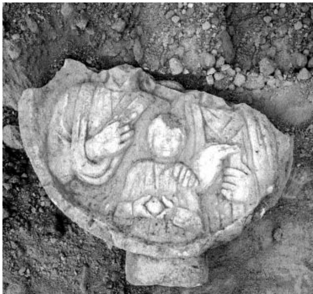
Családi dombormű töredéke

Az Árpád korban a római temető területére temetkeztek az itt lakók. Többnyire melléklet nélküli sírjaik egy csoportban fekszenek a római temető északnyugati részén. Kevésbé mélyre ásták sírjaikat, mint a római sírokat, így igen sokat megbolygatott a szántás. Egyikben felfűzött, 10. századi pénzezből álló nyakláncot és „S” végű fülbevalót viselt az eltemetett férfi. Egy másiknak a ruháját kis füles bronzgombok díszítették, hajában hajkarika. Településüket eddig nem