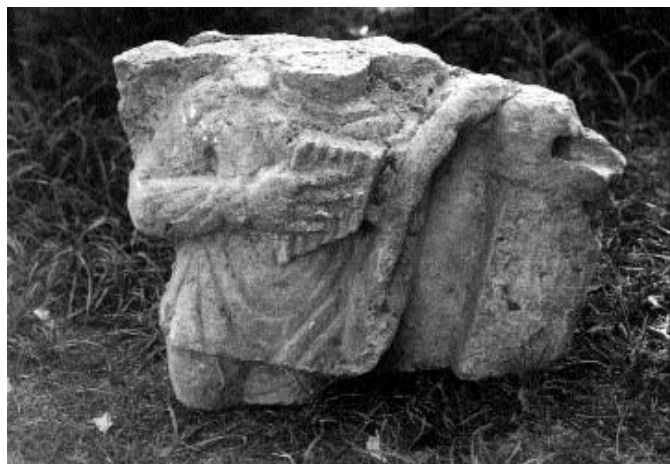
Pánsíp- tartó alak töredéke

A 3. század közepén, második felében a rómaiak újra áttértek a csontváz- as temetkezésre. Egy 3. századi éremmel keltezett sírban a halott fülében két ezüst fülbevaló, nyakán apró szemesgyöngyökből nyaklánc, karjain egy- egy bronz lemez karperec, ujján gyűrű volt. Fejéhez piros festett tálat tettek, ebben volt a 3. század első feléből származó érem (Julia Maesa denár, Roma 218–222). A sírokba tett érmek mindenkor csak terminus post quem értékűek, tehát a fenti temetkezés valamikor 222 utánra keltezhető. A festett kerámia- mellékletek alapján több érem nélküli