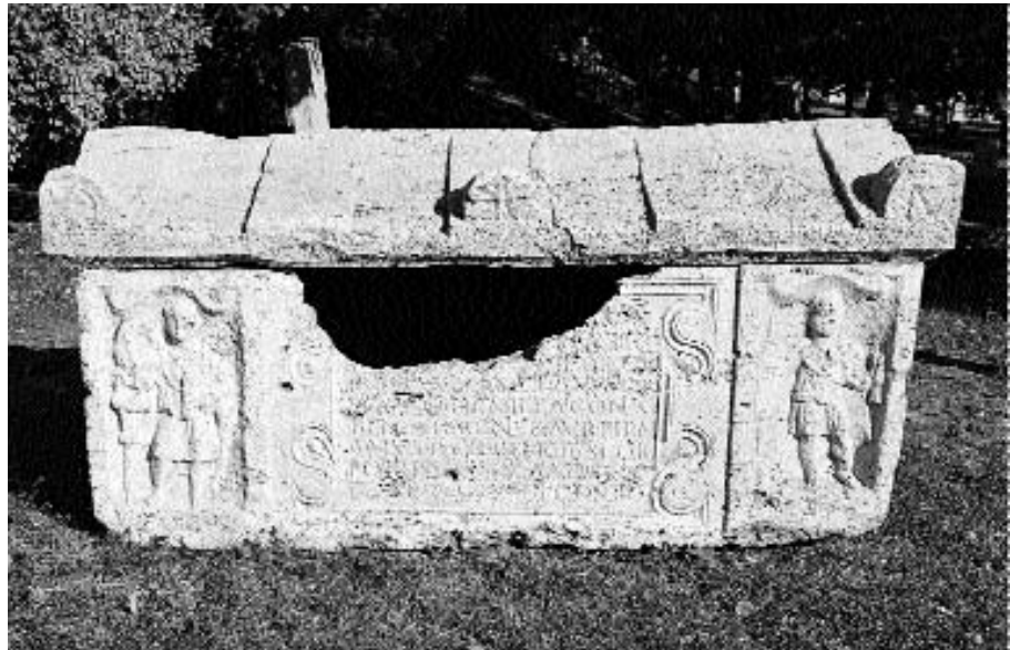
Szarkofág, Kr. u. 3. század

képező bika megölése közben. A szentély építését bizonyító két oltárkövet M. Aurelius Frontinianus és M. Aurelius Fronto, a legio II. Adiutrix katonái állították a legyőzhetetlen Mithrasnak. A 3. század elején tehát jelentős Mithras-közösség élt Budaörsön, melynek egyik képviselője a mi villánk tulajdonosa lehetett.