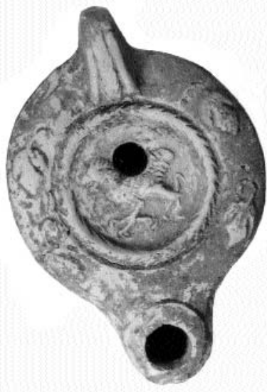
Kora római mécses állatábrázolással