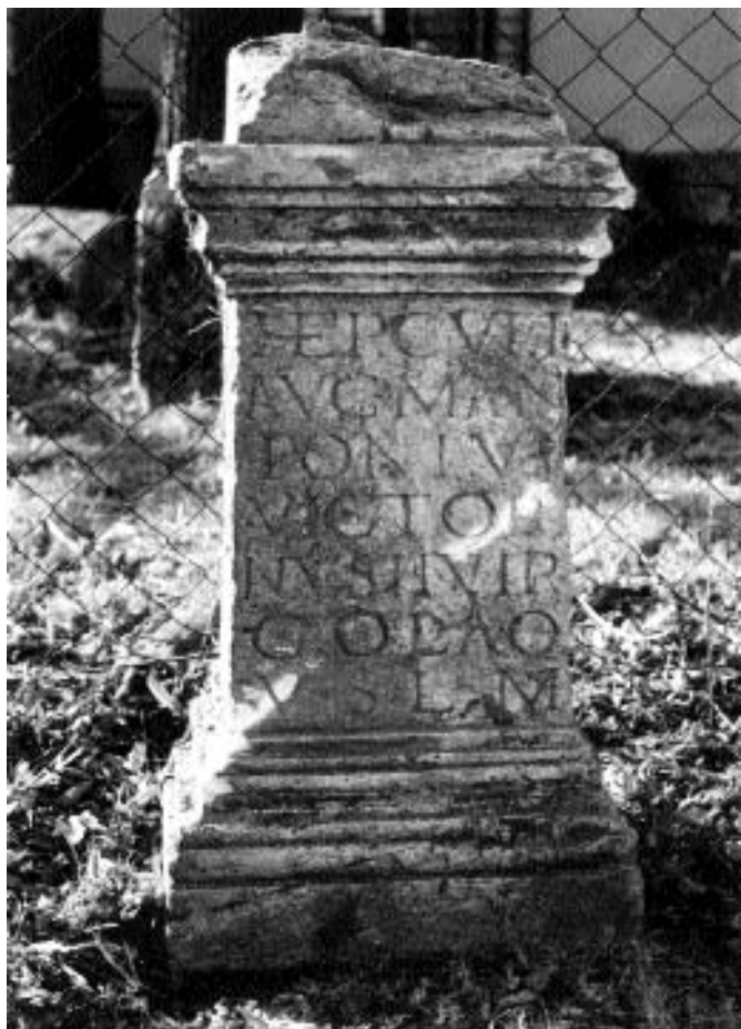
Herculesnek szentelt oltárkő, Kr. u. 3. század