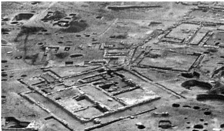
Az ásítás részlete légifelvételen

A késő rézkorban állattenyésztő népesség telepedett meg itt, az ún. Badeni kultúra népe (kb. Kr. e. 3400–2900). Budaörs területén eddig rézkori lelőhelyet nem ismertünk, a most feltárt telep az első bizonyíték rá, hogy ebben az időszakban is lakott volt a Budaörsi medence. A rézkori telep az egész domboldalra kiterjed, bár délen a patak partjái már nem ér le. Félig földbemélyített, szabálytalan lakóházai, egyik sarokban kerek kemencével, gyakran sorokba rendezve, a mai Szőlőskerti út felőli részen találhatóak. A házakat kerek tárolóvermek, szemétkövek, agyaggyerő gödörök övezik. Bennük számos mindennapi használati tárgyat, például kaparókat, kő- és csonteszközöket, edénytöredékeket találtunk. Jellegzetes kerámia a kétosztatú tál, kúpos végű kis poharak, benyomkodott peremű fazekak stb. Egy kultikus gödörben 16 ép edényt tártunk fel, gyerek-