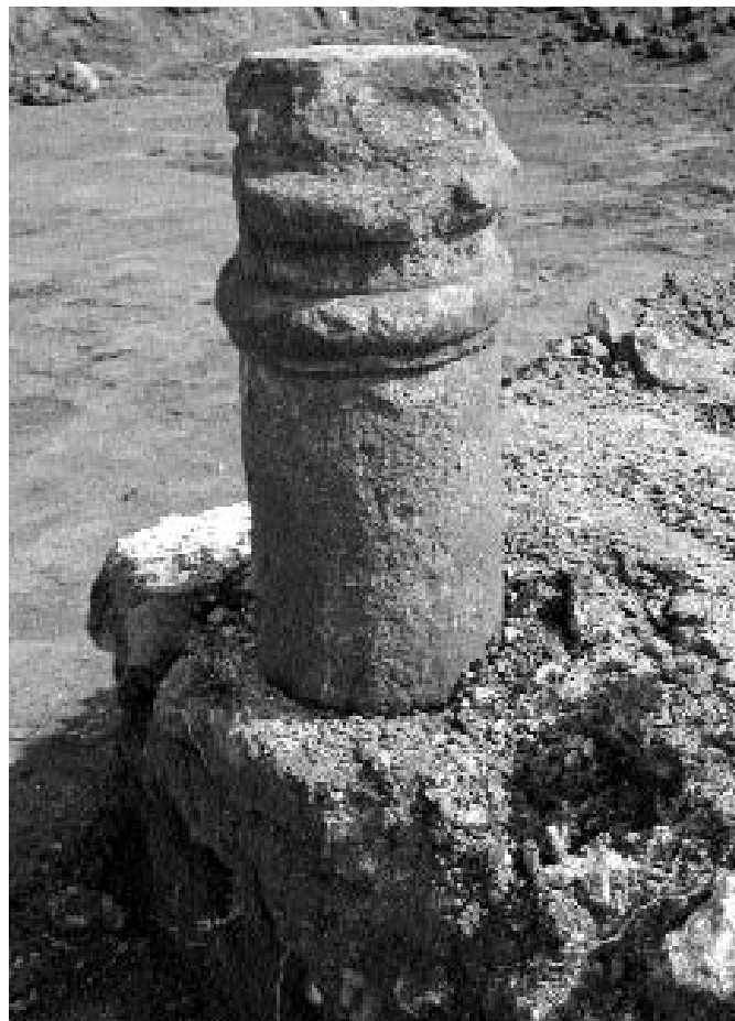
Kőépület részlete a megmaradt oszlop tördékével