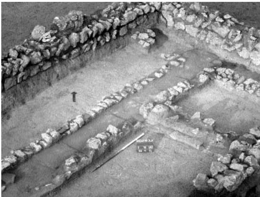
Fűtőcsatornával ellátott kőépület részlete

csontvázal és sok állatsonttal együtt. Igen sok kerek gödörben találtunk egész állatsontvázat (ló, szarvasmarha). A telep melletti rézkori temető eddig még nem került elő, csak a házak között elszórva volt egy-egy zsugorított csontváz a kerek gödrökben.