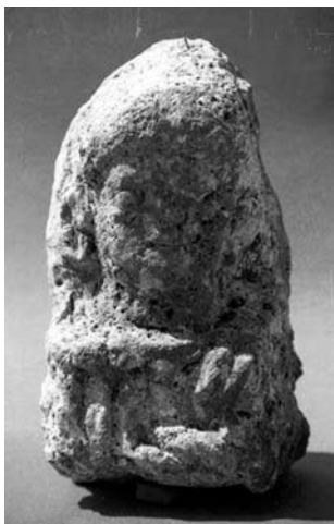
A Gratianus képmásához használt dombormű töredéke

törésfelületében esetleg illeszkedhetett. Mivel éppen egy kiállításra készültünk, lehetőség nyílt a lepencei portré korábban gipszből elkészített pozitív nyaklenyomatát az aquincumi torzóhoz próbálni. Szinte bizonyossá vált, hogy a két darab összetartozik. Ezek után elkerülhetlenné vált a valódi fej és test összehozása. Az Aquincumi Múzeumban lezajlott próba teljes sikerrel járt, életre szólóan megrendítő pillanat után az 1905-ben Óbudán, a Szemlő-hegyről meszesgödör ásása közben előkerült női torzó visszakapta idestova 1628 éve elhurcolt, igaz, kissé átalakított fejét! A Szemlő-hegyi lelőhelyen a torzón kívül még kőszarkofágot is találtak, a jelek szerint a területen egy sírkert lehetett. A szobrot készítője rövidülésben ábrázolta, ami valószínűvé teszi, hogy az eredetileg valamilyen magasabb talapzaton állhatott.