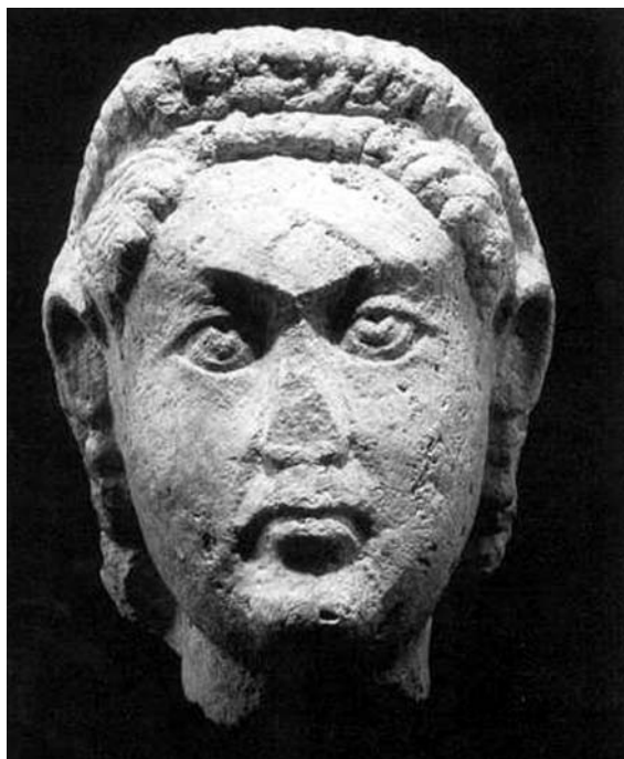
A Valentinianus képmásához használt női szobortorfej

Most térjünk vissza az építési táblához. Ez valójában nem is építési tábla, hanem olyan építészeti elem, mely valószínűleg a „füleivel” volt a falba erősítve és vízszintesen elhelyezve, amit az is bizonyít, hogy az alsó és felső széle is festett volt: vörös rácsfestés mintája figyelhető meg rajta. Talán egy díszlépcső eleme lehetett. Ennek a kőnek nagy felülete alkalmas volt a hosszabb felirat szövegének bevésésére. Ezek a megfigyelések körvonalaztak egy lehetséges magyarázatot az összes jelenség értelmezésére, de hol vannak a bizonyítékok? E sorok írójának feltűnt az Aquincumi Múzeumban őrzött női szobortorzó, mely arányában illett a lepenicei fejhez. Az aprólékos kutatómunka során és megfigyelések alapján (vitrinen keresztül is) nem látszott lehetetlennek, hogy az anyagukban is nagyon hasonló két rész