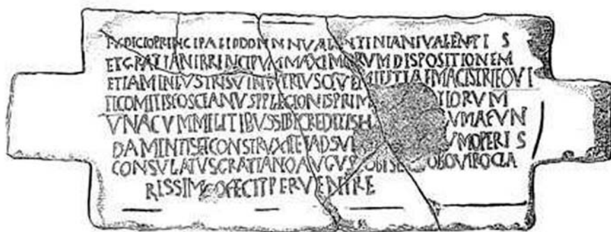
Az építési tábla rajza

E regényes történethez hozzátartoznak a császár emberi jellemvonásai is. I. Valentinianus császárról leírják, hogy hirtelen haragú volt, és ha