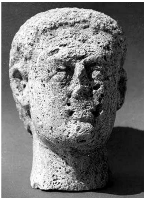
A Valens képmásához használt szobortorfej