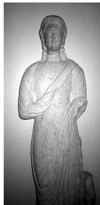
A fej a hozzá illő testtel

parancsnok szívéből mázsás kő eshetett le. Azonnal belefogott a másik őrtorony építésébe és egy év múlva már új felirat fedte el merész vállalkozásának nyomait. Hogy valóban így történt-e mindez, talán sohasem fogjuk megtudni, de a régészeti bizonyítékok ezt a lehetőséget alátámasztani látszanak.