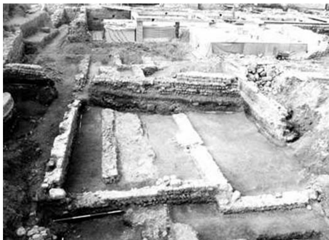
A római fürdő keletről. Előtérben a nagy csarnokszerű helyiség és a korábbi építési fázishoz tartozó építmények. Középen keresztben a prépostság keleti zárófala. Háttal a befedett fürdő főépülete és a részben lebontott védőépület

A 4. századi erősítésnek újabb bizonyítékai kerültek napvilágra. Az 1978-ban feltárt kerek oldaltoronytól nyugatra, 100 római láb (kb. 30 m) távolságban újabb torony darabja vált ismertté. Ettől nyugatra, a Mühlberg délnyugati peremén, a múzeumtól délre eső területen az északnyugat–délkelet irányú későrómai városfal 18 m hosszú szakasza