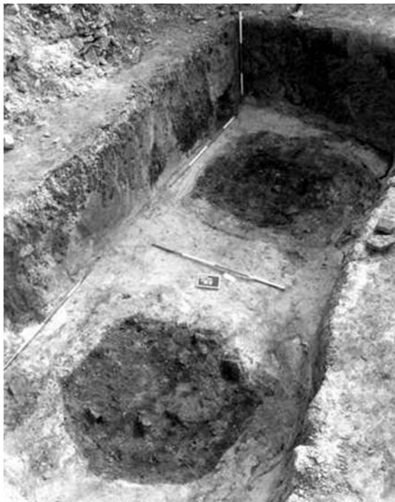
A fürdő frigidariumától délnyugatra megtalált két kút

vált ismertté, amely az épület ezen részének és a nyugatról mellette haladó csatornának az alapozására szolgált. A helyiség alapfala a nyugati oldalon a belső járószíntől 2 m mély. Mindezekből arra lehet következtetni, hogy a felszín nem volt elég stabil a magas technikai követelményeket támasztó fürdő építéséhez, s ezért az alapozást többszörösen meg kellett erősíteni.