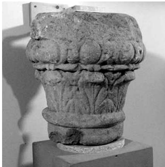
A középkori fal alapozásában megtalált római kori oszlópfő. Ideiglenesen a Propsteimuseum kiállításában

A későrómai korban megerősített település átvészelte a népvándorlás viharait, nem néptelenedett el, lakossága kontinuus maradt. A 4. században még virágzó római településsel kell számolnunk a gazdag sír- és kerámialeletek alapján. Az érem- és kerámialeletek még az 5. század első felében is romanizált lakosságra utalnak. A megmaradt római lakosság együtt élt a területet uralmuk alá hajtó frankokkal. Az erődített település „túlélését” minden bizonnyal a még ekkor is fennálló közlekedési csomópont jellegének köszönhetette. A helyet a 6. századi frank források településként említik: 507-ben oppidum nak, 531-ben civitas nak nevezik. A Mühlenbergen a fürdő még álló kőfalait faszervezetű építményekkel egészítették ki, helyiségeit egy ideig műhelyként használhatták, ahol edények díszítésére szolgáló pecsétnyomokat állítottak elő állatok szarvából, agancsából. Ezt mind a korábbi feltárások, mind a 2001–2002. évi ásatás leletei megerősítik. A zülpichi műhelyből is ismert csillag formájú pecséttel díszített frank edények a korai Meroving időszak sírleletei között gyakran előfordulnak.