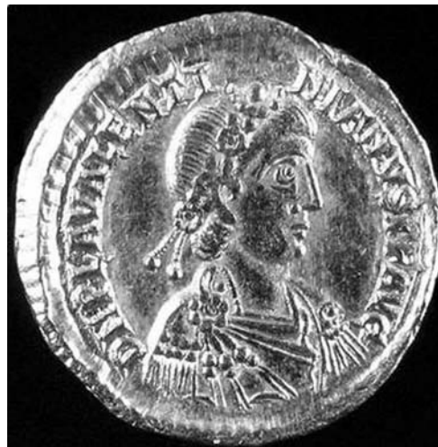
I. Valentinianus aureusának előlapja

A mai Észak-Rajna Vesztfália tartomány területe a Nyugat-római Birodalom összeomlását követően rövid ideig az alemannok fennhatósága alá került, majd seregével a Tolbiacum közelében elterülő síkságon legyőzve őket (496) Chlodvig (481–511) lett a vidék új ura. Az uralkodó megtérését (498) követően a kereszténység immár akadálytalanul növekedhetett az uralma alatt álló területeken, így a Zülpichben élő közösség feltehetőleg már az 5. század első felében egy kisebb templommal (Szent Mihály patrocínium?) rendelkezett. Nem zárható ki, hogy a hely szent jellege a római korból öröklődött át a keresztény érába, azaz a keresztény templom egy korábbi pogány szentély vagy szent terület helyén épült fel. Esetünkben Jupiter-tisztelet valószínűsíthető. A 2001-es ásatás megkezdéséig a