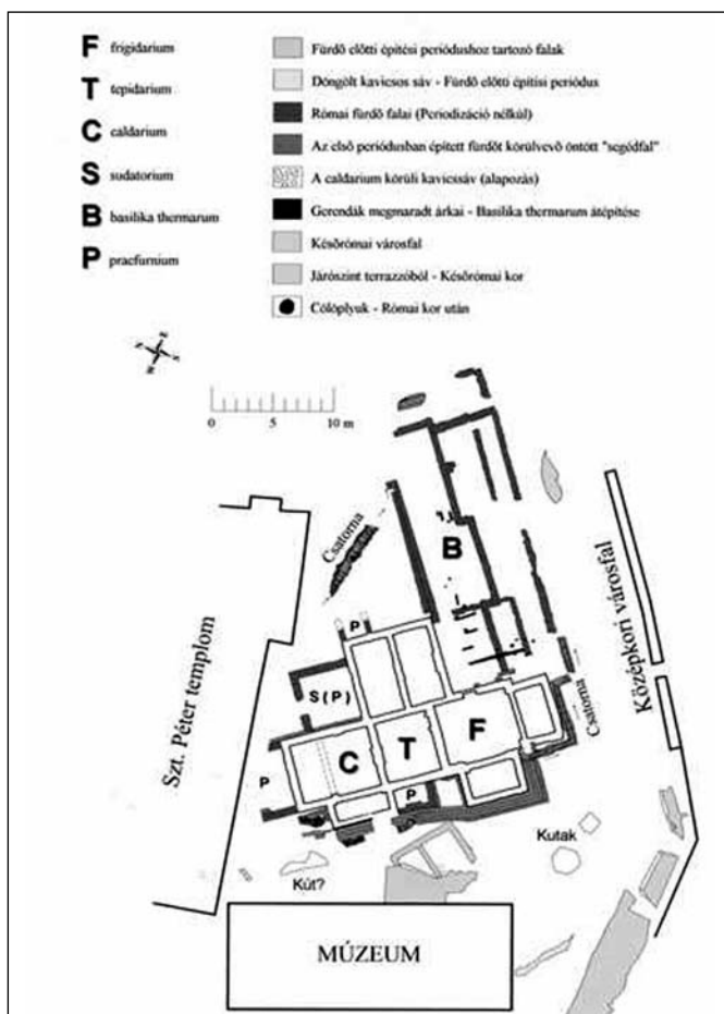
A Mühlenberg a római korban

A Mühlenbergen és környékén a római korban a hely kedvező közlekedés-földrajzi adottságának köszönhetően alakult ki település. A római kori Tolbiacum a Colonia Claudia Ara Agrippinensium (Köln), Novaesium (Neuß) és Bonna (Bonn) Rajna menti településeket és a közelükben lévő táborokat a galliai hátországba fekvő Durocortorum (Reims) és Augusta Treverorum (Trier) városokkal összekötő távolsági utak találkozási pontjánál létesült. Tolbiacum jogállását tekintve vicus volt, s a közelben (kb. 35 km-re) fekvő tartományi székhely, Köln közigazgatási területéhez tartozott. A település térbeli kiterjedése csak hozzávetőlegesen ismert. Határai a későbbi beépítések miatt nehezen meghatározhatóak: megközelítőleg az óváros déli részén (ennek dél-délnyugati peremén emelkedik a Mühlenberg) és az attól délre eső területen terült el. Az egyet-