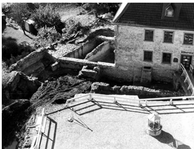
A Quirinus-tér és a prépostság épülete keletről 2001 októberében

A város területéről és környékéről az újkőkorból, a késő bronzkorból és a késő vaskorból ismertek emberi megtelepedés nyomai. Közvetlenül a múzeum déli oldalánál nyitott szelvényben, a Mühlenberg délnyugati szélénél a római rétegek alatt épülethez köthető cölöplyukak, jellegtelen, kézzel formált kerámia és kőpengék kerültek elő. Mindezek neolitikus megtelepedésre engednek következtetni. A kőpengék alapján az előkerült teleprész a középső neolitikumnál nem korábbi. A Mühlenbergen és közvetlen környékén újkőkori telep nyomai korábban nem voltak ismertek. A város északi peremén (mai ipari park területe) a neolitikum idején a szalagdíszes kerámia kultúrája által hosszabb ideig használt telep nyomai váltak ismertté. Az 1980-as években a légifotózásnak köszönhetően a város körül két helyen is, valószínűleg a későneolitikus Michelsberger kultúrához köthető, kör alaprajzú földsánc nyomait