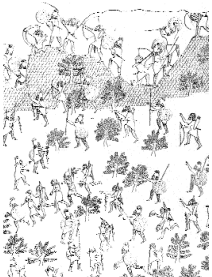
Hegyi hadjárat, dombormű a ninivei Délnyugat Palota trónterméből (eredeti rajz, London, British Museum)

Kr. e. 681-ben Szín-ahhé-eríbát az egyik fia által irányított összeesküvésben saját palotájában ölték meg. Nem tudjuk, hogy ez egyszerűen csak egy trónutódlás körüli ellenségeskedés eredménye volt-e, vagy az udvaron belüli valódi politikai ellentétek húzódtak meg a gyilkosság mögött. A merénylők vezetője, Arda-Mulisszi, Szín-ahhé-eríba másodszülött fia volt, aki bátyjának Elámba hurcolása után (lásd fenn) közel 15 évig a koronahercegi cím birtokosa volt, míg apja Kr. e. 683-ban váratlan döntéssel öccsére, Assur-ah-iddinára át nem ruházta a méltóságot. Ebben a kisebb fiú kvalitásai éppúgy szerepet játszhattak, mint a király utolsó éveiben nagy befolyásnak örvendő feleség, Naqia hatása. A gyilkosság híre nyugaton érte Assur-ah-iddinát, aki egy kisebb sereg élén azonnal a fővárosba vonult, és menekülésre kényszerítette az összeesküvőket, akik az Ószövetség szerint Urartuban találtak menedéket. Rövid időn belül Assur-ah-iddinát királlyá koronázták, és a hatalomváltás az egész korabeli világban feltűnést keltő gyilkosság ellenére viszonylag zökkenőmentesen megtörtént.