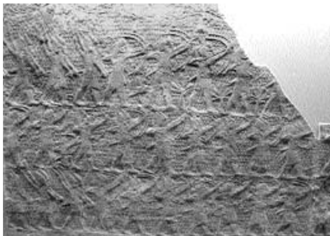
Lákis ostroma, dombormű a ninivei Délnyugat Palota XXXVI. terméből (London, British Museum)

Szín-ahhé-eríba ezért harmadik hadjáratát 701-ben ebbe a régióba irányította. A hadjárat három, jól elkülöníthető fázisból állt: az asszírok először a föníciai, majd a filiszteus városok ellen vonultak, míg végül Júdát támadták meg. A föníciai városok közül csak Szidón királya, Lulí (Elulaiosz) állt ellen, de hamarosan kénytelen volt ő is a tengeren keresztül elmenekülni, a többieknek pedig csak súlyos adók fizetése árán sikerült városukat megóvni Szín-ahhé-eríba haragjától. Miután Szín-ahhé-eríba Szidónba új, asszírbarát uralkodót helyezett, a tengerpart mentén a filisz-