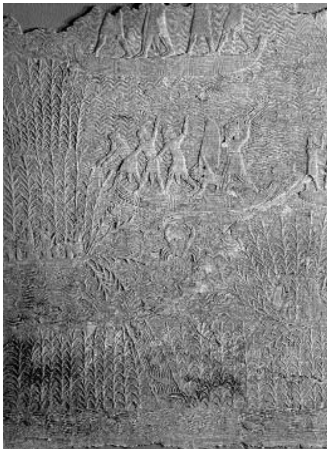
Lázadók üldözése a dél-babilóni mocsarakban, dombormű a ninivei Délnyugat Palota XXVIII. terméből (London, British Museum)

elődje, sőt egy ideig elméletileg maga is elfoglalt, hanem inkább egy előkelő babilóni családból származó, de az asszír udvarban nevelkedett férfit, Bél-ibnit (Kr. e. 702–700) ültet rá. A káld területek élére közvetlenül tőle függő asszír eunuch helytartókat helyezett, így próbálva meg elválasztani az ellenállás fészket Babilónia északi nagyvárosaitól. Visszafelé vezető útján a lázadásban résztvevő arámi törzseket büntette meg, és több mint 200 ezer embert deportált a birodalom más részeire. Talán még ennek a hadjáratnak a részeként Szín-ahhé-eríba a kurdisztáni hegyvidékbe is betört, hogy megleckéztessen két, az asszír területek határán fekvő államot.