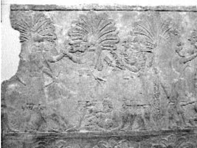
Egy tiszt kitüntetése az egyik babilóniai hadjárat során, dombormű a ninivei Délnyugat Palota XXXVI. terméből (London, British Museum)

Elámba és nagy területen lerombolt minden útjába került települést. Az új elámi uralkodónak, Kudur-Nahhunte-nek vissza kellett vonulnia fővárosából, Madaktuból, de a zord téli időjárás megakadályozta az asszírokat a város elfoglalásában és kénytelenek voltak hazavonulni. A menekülés azonban Kudur-Nahhunte életébe került, és így újabb uralkodó foglalta el az elámi trónt, III. Humban-nimena.