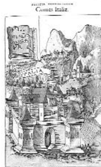
7. kép: Reneszánsz vár- és városábrázolás a S. Gelenius-féle kiadásban

Összefoglalóan elmondhatjuk, hogy a Notitia Dignitatum hivatali listáit kísérő illusztrációk között a provincia-perszonifikációk és -térképek az adott tartományra leginkább jellemző, földrajzi elhelyezkedésre, a gazdaságban betöltött szerepére vonatkozó jellegzetességeket foglalják össze tömören. Mindezek a keleti birodalomrész vonatkozásában pontosabb ismeretekre engednek következtetni, ugyanakkor nyugaton – Britannia kivételével – a legalapvetőbb és legkézenfekvőbb kísérőinformációk fel-tüntetését is mellőzi a forrás.