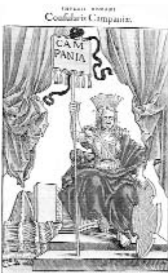
1. kép: Campania perszonifikációja

A Notitia Dignitatum keleti és nyugati birodalomrészeire vonatkozó kezdő fejezeteiben, amelyek a magas rangú tisztviselő hivatalát ( praefectus praetorio , praefectus urbis Romae , praefectus augustalis , proconsul , consularis , corrector , és csak Nyugaton a vicarius ) mutatják be, máris összefüggés látható az ún. theca (császárszoborportréval díszített, lábakon álló állványzat, a német szakirodalomban „Bildstandard”) megléte és a jelvényvel ellátott fejezetek ábrázolásai között. Megfigyelhető ugyanis, hogy azokban a fejezetekben, amelyekben a theca megjelenik, minden esetben a dioecesisek illetve a provinciák női – Palaestina esetében férfi – egészalakos vagy büszkös perszonifikációi (1. kép), illetve Apulia et Calabria valamint Dalmatia esetében erőd-szerű épületek utalnak az adott területre. A Notitia Dignitatum a provincia-megszemélyesítések tekintetében is némi következetességet mutat bizonyos rangok és attribútumaik között: a két feltüntetett consularis hivatali jelvényei között a theca megjelenítésén túl azonos típusú tartomány-meg-