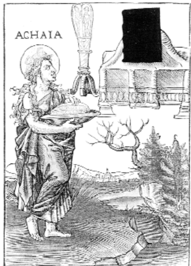
5. kép: Achaia perszonifikációja reneszánsz városképpel, a táj jellegzetességeit hangsúlyozó hegyekkel, kopár fákkal, és a kép sarkában a tengerre való utalással