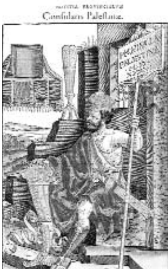
2. kép: Consularis provinciae Palaestinae

A Notitia Dignitatum következő fejezeteiben az egyes tartományok