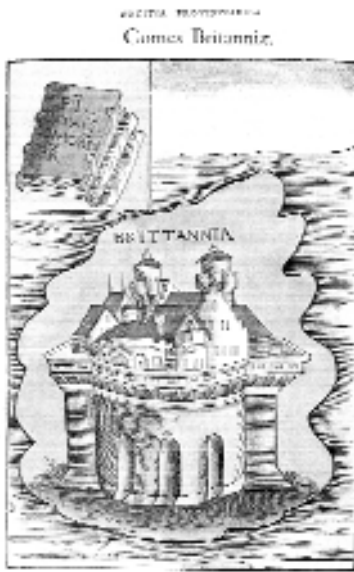
4. kép: Britannia ábrázolása szigetként

által határolt tartományként látjuk: a képmező jobb alsó sarkában a tenger kékje csillan meg, magát a tartományt pedig jellegzetes tájábrázolás jelképezi, amelyen fenyők és kopár ágú fák éppúgy megjelennek, mint a távolban húzódó hegyek, a lábuknál felsejlő, fallal körülvelt messzi város képével, amelyből még egy dóm kupolája is kimagasodik (ND Or. XXI., ld. 5. kép).