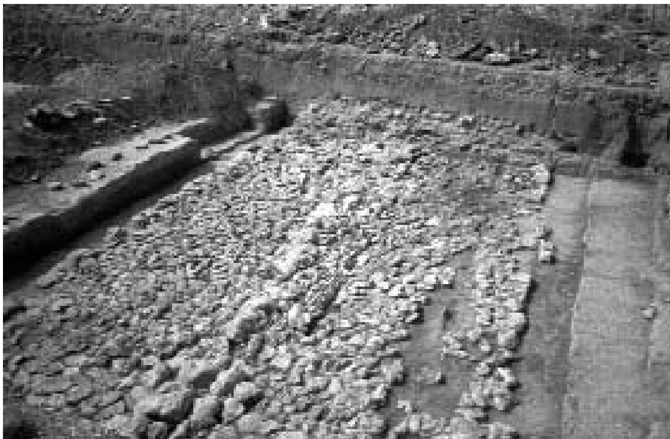
A diagonális útvonal első kövezett útrétege

leten. Az antropológiai vizsgálat szerint az igen rossz megtartású hét csontvázas sír közül hat felnőtt temetkezése volt, egy pedig egy gyermekhez tartozott. A csontokon anatómiai variációkat, patológiás elváltozásokat nem lehetett megfigyelni, egyetlen fogszuvasodásos eset kivételével.