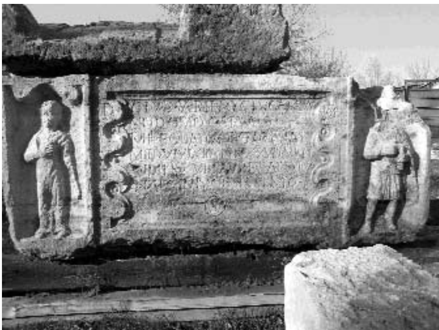
Szarkofág a diagonális utat kísérő temetőből

A fentieket alapján tehát az Aquincum–Brigetio diagonális út mentén nagy kiterjedésű, fontos csomópont mellett kialakult – talán több funkcióváltáson is keresztülment – település körvonalai kezdenek kibontani,