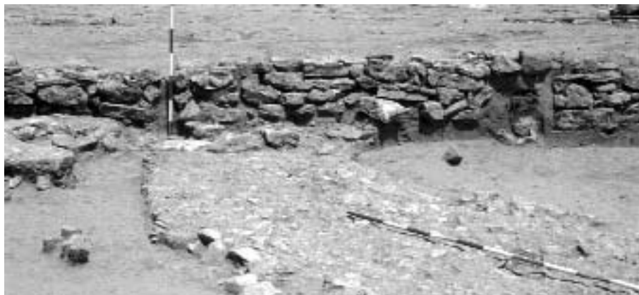
Elfalazott kapu és a kivezető út

A többi csontvázas sír bolygatatlan volt, keltező értékű leletanyagaik alapján a Kr. u. 3. század közepe – 4. század első harmadára keltezhető (III. Gordianus [?], Phlippus Arabs, Hostilianus, Galerius [?] és Crispus caesar érmei). Két sír között elszórtan előkerült egész edény (Spruchbecher) üvegyöngy és egyéb kerámiaedények töredékei azonban arra utalnak, hogy történhettek sírrablások a terü-