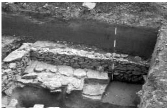
A gazdasági épület kőlapos udvarrésze

tunk, benne többek között mázas serpenyőfogó töredékével, amely még egy antik tereprendezés része volt, talán egy útközi kátyút töltötték be ilyen módon. A gazdaságból kivezető út, illetve a fő diagonális út csatlakozási pontját nem sikerült megtalálnunk, valószínűleg későbbi tereprendezés áldozatául esett, hiszen a középkorban itt szintén főút haladt, amely csak néhány, vékony apróköves, néhol földútszerű rétegből állt. A rossz megtartás másik oka, hogy a rétegsorok alapján a terület kelet felé eredetileg emelkedett, az újkorban azonban nagy mértékű planírozást végeztek itt, így eltüntették a régészeti objektumokat.