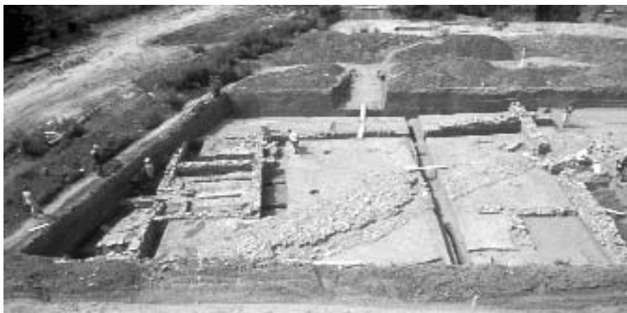
A bejárati épületegyüttes

A fő kerítésfaltól keletre, azaz a gazdaságon kívül, a bejárat zónájában földútra utaló nyomokat, illetve egy faszemes, kerámiatöredékekkel betöltött gödröt regisztrál-