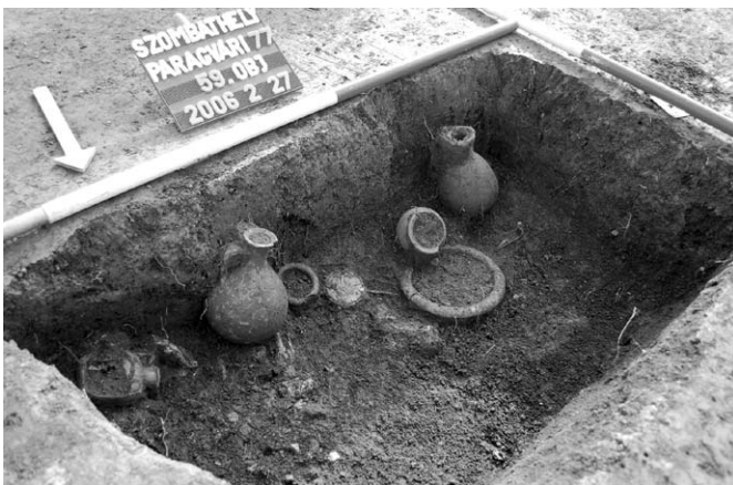
Helyben égetett sír (ún. bustum ). A sír falai átégtek, az alján a máglya maradványai és hamvak kerültek elő. Melléletei: kerámiakorsók és bögre, terra sigillata tányérok, bronz tűkőr, bronz fibula, hasáb alakú üvegcorsó

Savaria temetői is a város alapításakor körülszántott határan, az ún. pomeriumon kívül kezdődtek, és Urso, valamint Róma 4 példái alapján feltételezhető, hogy a máglyák várostól való távolságát is szabályozták. A korai időszak (1–2. század) sírjai a város kivezető útjai mentén vastag sávban húzódtak a négy égtáj felé, esetünkben az északi kivezető út, a Borostyánkőút Carnuntum (Petronell, Ausztria) felé vezető szakaszán. Később (3–4. század), amikor ezek a temetők megteltek, illetve a szabad helyek már túl nagy távolságba kerültek a várostól, a városfalakhoz közeli területeken is temetkeztek, így a négy temető lassan körülölelte a várost. Savaria római korának négy évszázada akár százezer sírt is hátrahagyhatott, amelynek kevesebb mint egy százalékát ismerjük. 5