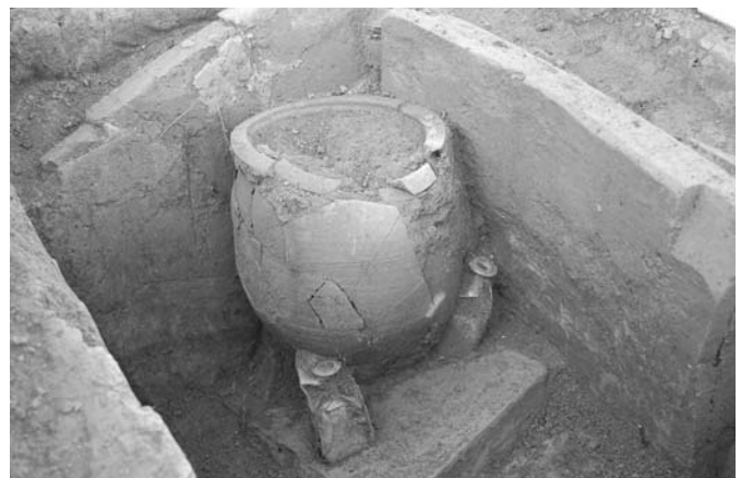
Téglából összeállított sír feltárás közben. Az urna mellett két hasáb alakú üvegcorsó került elő