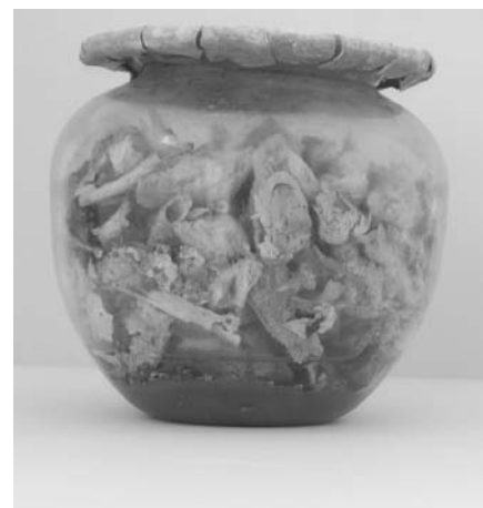
Ólomlemezrel lefedett üvegurna, amely az elhunyt hamvait (kalcinálódott csontokat), valamint illatszeres üvegeket tartalmaz. Az urna alján víz és iszap látható.

Savaria északi temetője nem volt ismeretlen a kutatók számára. 1950-ben a mai Művészeti Szakközépiskola és Gimnázium főépületének alapozásakor 69 római sírt tártak fel, 6 1975-ben ugyanitt közműárok fektetése közben további 9-et. 7 Az iskola közelében került elő a város legszebb feliratos emléke, a Sempronius család sírköve is, 8 a környék telkein pedig csak a hetvenes években több mint 50 sírt mentettek meg a Savaria Múzeum régészei a földmunkák során. 9 Mindezek alapján nem volt tehát meglepő, amikor az iskola új épületszárnyának megelőző feltárásán az északi temető számos további sírja került napvilágra.