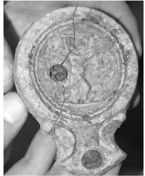
Jobbra: Táncoló figurát ábrázoló terrakotta lámpa (volutás mécses)

zárható ki, hogy némely esetben a kigyújtott hamvakat szabadon, tehát urna nélkül, de elkülönítve helyezték a sírgödörbe.