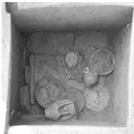
Tetőfedő téglákból ( tegulae ) összeállított sír feltárás közben. Mellékletei: ólomtűkör, terrakotta mécses, kerámiatányérok és -bögrék