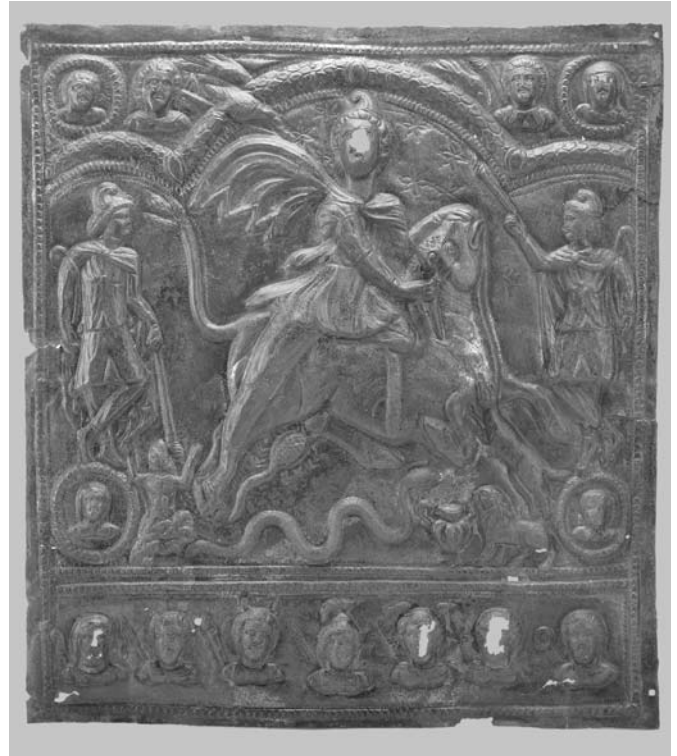
Bronz relief Brigetióból (Budapest, Magyar Nemzeti Múzeum)