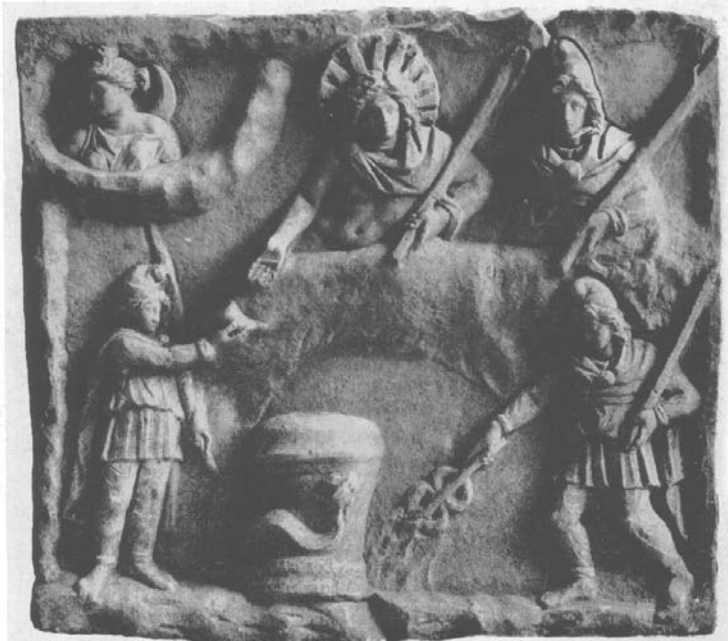
Kétoldalas relief Fiano Romanóból (Párizs, Louvre, a CIMRM 641. nyomán)

közepén, vagy kevéssel az után történhetett; akkor tehát, amikor a közeli Aquincum polgárváros Mithraeumainak is sorozatos pusztulásával számolhatunk, illetve amikor a savariai Iseum és Metroon, vagy a Carnuntum-pfaffenbergi és a Gellérthegyi szent kerületek elpusztítása is keltezhető. A halott mellé pedig talán azért került az évtizedekkel korábban (305 előtt) vert Diocletianus-érem, mert Diocletianus volt az az utolsó császár, aki Mithrast még deklarálta „hatalma támaszának” ( fautor imperii sui – CIMRM 1968., Carnuntum) tekintette, s így az jól illeszkedett a sír halottjának gondolkodásához.