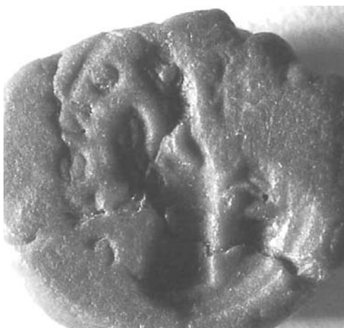
8. ábra. IV. Béla 1266-ban használt pecsétje