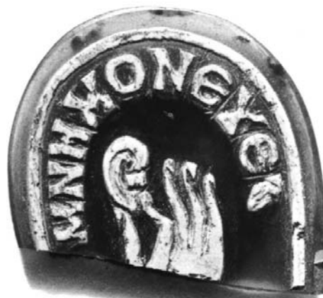
9. ábra. Fülcimpát fogó kéz Brigetióból származó gemmán (AGUN Nr. 284)

ábra). 16. század eleji használója nagy valószínűséggel püspök volt, és minden további nélkül tekinthette az alakokat Máriának és a kis Jézusnak. Tudvalevő, hogy a Madonna-ábrázolások ikonográfiaja erre az antik képtípusra vezethető vissza.