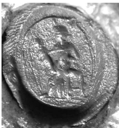
5. ábra. Azonosítatlan országnagy (püspök?) 1523-ban használt pecsétje

A legkorábbi, 13. század közepi, egyházi használatból ismert antik gemmapecsét az egi káptalan ellenőrző pecsétje. Az oldalról látható, hosszú ruhás szárnyas alak részletei és attribútumai már nem ismerhetők fel, de testtartásából Nemesisre lehet következtetni, akinek kezében olajág, lábánál pedig kerék szokott lenni. Aligha kétséges, hogy középkori használói angyalnak tekintették. Ritkaságnak számít gemmán a kis Horust ölében tartó Isis ábrázolása (1523, Kat. 109; 5.