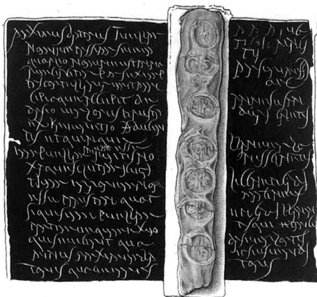
1. ábra. Verespataki viaszostábla hét pecséttel (Érdy J. rajza, I/4. tábla)

A látványos, nagyméretű épületek és szobrászati alkotások mellett az apró méretű, nehezen felismerhető ábrázolásokkal díszített ékkövek (gemmák) mindezülig kevés figyelemben részesültek. Pedig szép számmal kerültek elő Magyarországon területéről, múzeumaink több száz darabot őriznek belőlük. Publikálásukra csupán az utóbbi két évtizedben került sor. Még kevésbé tartotta számon bárki is, hogy ezeknek az apró remekműveknek a használata egyáltalán nem tűnt el Magyarországon területéről a rómaiakkal együtt. Előfordulnak avar, majd honfoglalás kori sírok mellékleteiként nyakláncokra fűzve vagy gyűrűbe foglalva. Később pedig – visszanyerve eredeti funkciójukat – oklevelek hitelesítő pecsétjeként újra elterjedtek, hivatalos használatba kerültek az ország egész területén.