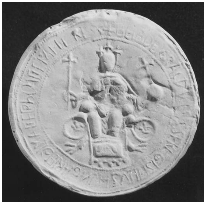
3. ábra. Gyűrűspecsét III. Béla nagypecsétjén 1195-ből (gipszmásolat; Tihanyi B. felvétele)

A 15. század utolsó, illetve a 16. század első negyedében az eddigiékhöz képest ugrásszerű növekedés következett be. Mindkét időszakban 40 fölé emelkedik a gemmapecséték száma, a tulajdonosok között dominánsakká válnak a nemesek és a főurak, a többin pedig az egyházi személyek osztoznak (ezen belül főként a középréteg tagjai, a kanonokok), de megjelennek a plébánosok és akad néhány püspök is. Feltűnő, hogy alig képviseltetik magukat a városi polgárok.