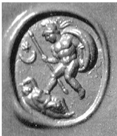
7. ábra. Mars és Rhea Silvia Münchenben őrzött gemmán (AGD I/2, Nr. 1467)