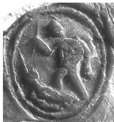
6. ábra. Demeter erdélyi püspök 1374-ben használt pecsétje