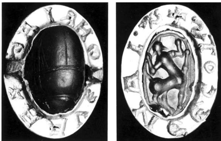
2. ábra. Etruszk skarabeus 13. századi foglalásban (AGUN Nr. 5)

A 3. század közepétől a gemmakészítés fokozatosan visszaszorult, aminek egyik oka a korábbi pecsételési szokás megváltozásában keresendő: az agyaglenyomat helyett a tartósabb ólomlenyomatra (plombálás) tértek át, amit már fogóval készítettek (bullotérion). A gemmák visszaszorulása az ékszerveletben valószínűleg az általános elszegényedés következménye is volt.