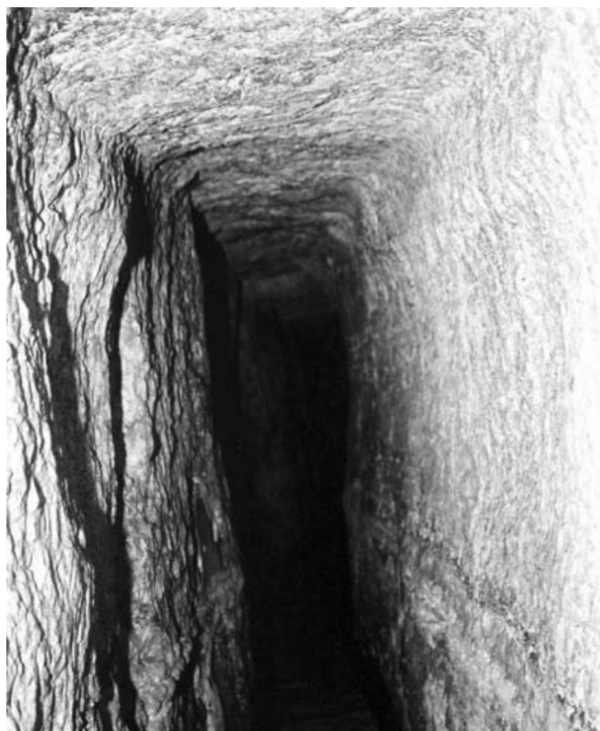
A 60 cm széles és 1,5 méter belmagasságú alagút

Jeruzsálem tehát a Kr. e. 8. század végén fejlődő város volt. Igaz, fejlődésének motorját nem saját gazdasági teljesítményének, hanem az északi országot elárasztó asszír invázióknak köszönhette. A politikai helyzet azonban nemcsak kedvező,