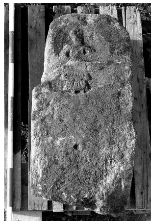
8. kép. Bennszülött viseletű szolgálólányt ábrázoló sztélé