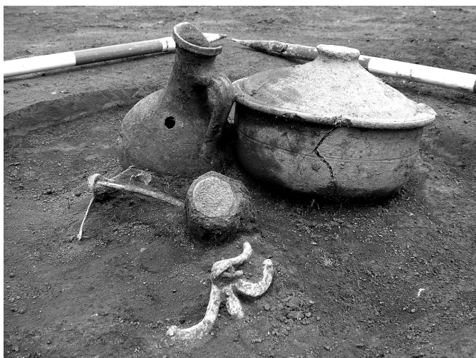
6. kép. Hamvasztásos urnasír