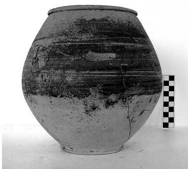
4. kép. Kelta hagyományú kerámia

Gazdag mellékletei és kultúrtörténeti vonatkozásai miatt érdemes külön is kiemelni egy temetkezést. A temetőben feltárt legnagyobb alapterületű, árokkal körülhatárolt négyzetes sírkerten belül egy urnasír és egy teljes lócsontvázat tartalmazó sírgödört találtunk. Az álló pozícióban leölt, másfél-kétéves csikó mellől zabla, szíjbújtatók és egyéb lószerszámok kerültek elő, míg az emberi hamvakat tartalmazó sírban egy bronzfülű favödörbe helyezett bronz merítőkanalat, egyfülű festett korsót, fedővel ellátott mélyebb tálat és egy Nero-érmet találtunk (6. kép). Ugyanezen sírkertárok déli, bejárati oldalán öt darab, mészkőből faragott sírkő került elő (7. kép). A sírkövek közül négy azonos méretű és felépítésű, egyszerű kivitelű sztélé volt, képmezőjükben plasztikusan megformált bennszülött (kelta) viseletű szolgálólány-, lovas- és pajzsábrázolással (8. kép). Ez a négy sztélé eredetileg a sírkert-