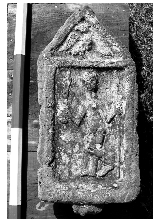
9. kép. Fegyveres férfialakot ábrázoló sírkő

ten kívül, annak frontoldalán állhatott. Az ötödik sírkő az előbbiekől eltérő anyagú és jobb minőségű faragvány volt. Háromszögű orommezőjében kiterjesztett szárnyú sassal, képmezőjében keresztbevett lábakkal álló férfialakot ábrázoltak, jobbjaiban karddal, bal kezében lándzsával (9. kép).