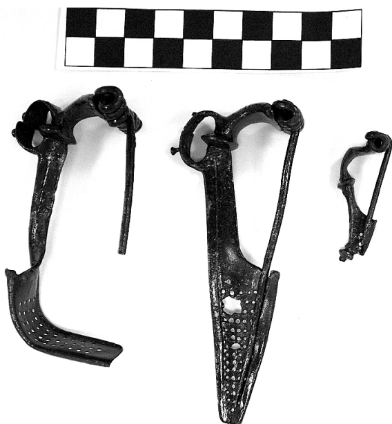
3. kép. Fibula sírmellékletek

lati tárgyakat (pl. ruhakapcsoló tűket – 3. kép) tettek, de előkerült olyan sír is, amelybe rituálisan megrongált fegyverek (kard, lándzsa, pajzsdudor) kerültek mellékletként. Ez utóbbi sírban – miután nem vadászfegyverekről van szó – nagy valószínűséggel egy a római hadseregben szolgált katonát helyeztek örök nyugalomra.