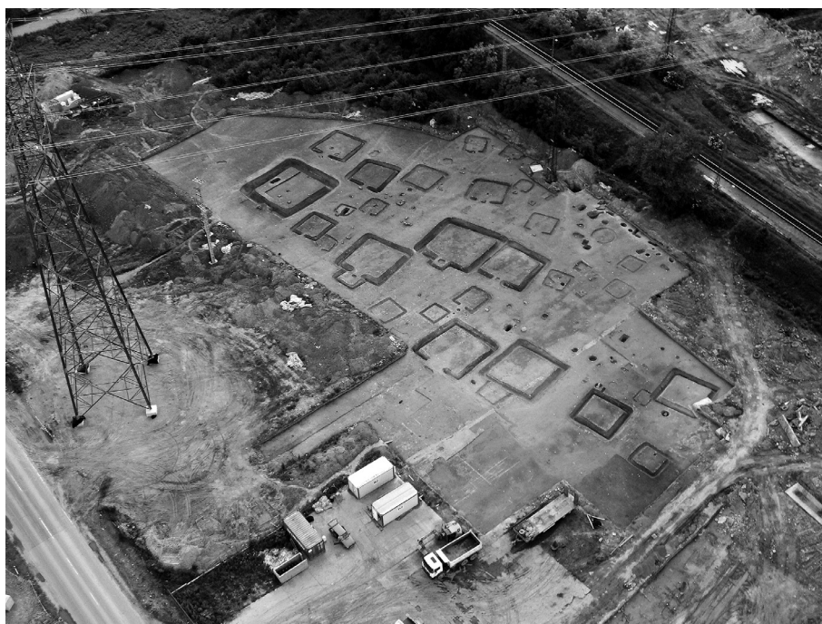
2. kép. A kora császárkori sírkertek légifotón