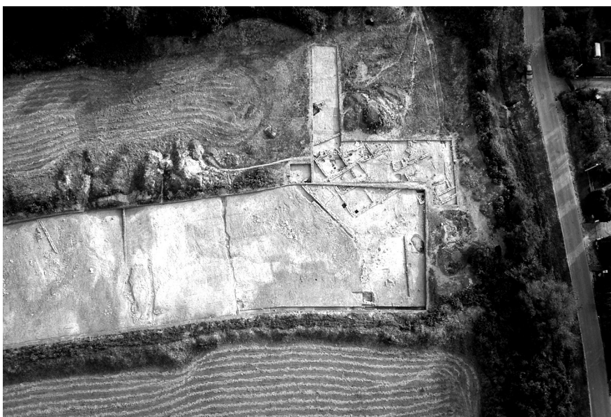
2. kép. Az ásatás területe légifotón

A 2004–2008 között a Csúcshegy oldalán folyó feltárások során több mint 30 000 m 2 -en a közeli Árpád-kori faluhoz, Óbudaörshöz tartozó házat és kemencéket, továbbá egy őskori (rézkori) gödröt tártunk fel. A hegyoldal alsó részén került elő az a több helyiséges római kori kőépületet, amelynek maradványai annak köszönhetően fennmaradásukat, hogy a területet a későbbi korokban sohasem építették be, „csak” szántották. A vékony (néhol mindössze 10 cm) földréteg alatt csodával határos módon maradtak fenn a széles, földbe rakott kőfalak, omladékok, padlók (1–2. kép). Másutt azonban a meredek hegyoldalon folyton jelen lévő erózió miatt szinte teljesen eltűntek az épületrészek.