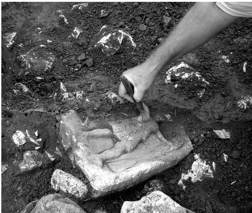
4. kép. Diana istennőt ábrázoló mészkőrelief feltárási közben

mai történetét, melyekről sok esetben meglehetősen hiányosak az ismereteink. A jelenleg több mint 40 ismert gazdaság közül ugyanis sajnos egy sincs teljesen feltárva, nagyobb részük pedig régi ásatások során került elő. Néhány feltárási adatai (pél-