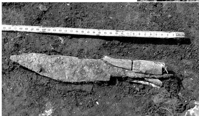
6. kép. Csontnyelű vaskés

hető, hogy a római uralom késői időszakában a szóban forgó épületbe is bevette magát egy kisebb helyőrség.