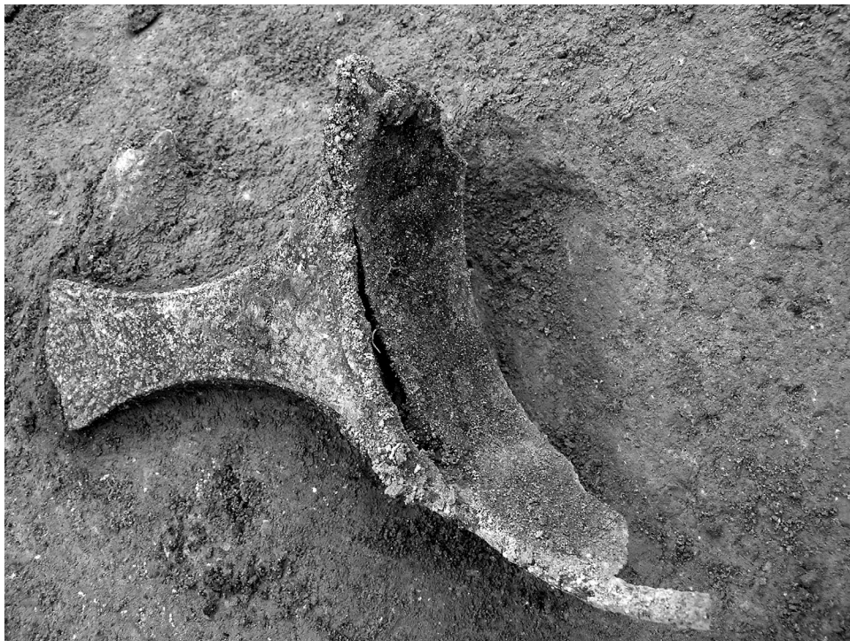
3. kép. Bronzedény töredéke kora római objektumból

Ezek értelmezéséhez érdemes röviden áttekinteni a Kr. u. 2–3. században a budai hegyek lankáin kiépült villagazdaságok késő ró-