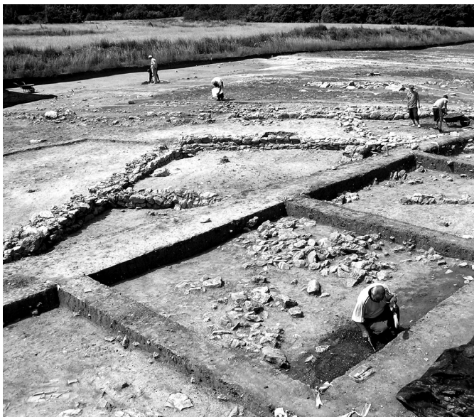
1. kép. Késő római épületegyüttes falai feltárás közben