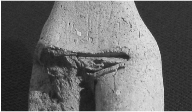
2. kép. Terrakotta töredék (részlet)

Nem ez az alkalom, hogy a terrakotta szobrocskák, vagy ahogyan nevezni szokták, eidolonok , idólok eredeti funkciója körüli vitákban a döntés igényével mondjak véleményt. Az a nagyszabású elgondolás, amelyet Marija Gimbutas fejtett ki Goddess -könyveiben, 2 Mezopotámiára nehezen volna alkalmazható. Bár magában Ubaidban ebben az időben vannak már templomok, az anthrópomorf istenképzet még legfeljebb alakulóban lehetett. A legrégebb uruki anthrópomorf agyagszobrocskák az északi, például Tell el-Szavván-i alabástrom szobrocskákhoz képest kétségtelenül kevésbé naturalisztikusak, mondhatni, erősebben geometrizáltak, már csak az anyag sajátosságai miatt is. Különböznek tőlük abban is, hogy valószínűleg nem sírokból kerültek a későbbi feltöltésekbe. De még lényegesebb különbségnek látszik, hogy az anthrópomorf és thériomorf terrakották aránya más, mint – hogy ennél maradjak – Tell el-Szavvánban: egyenletesebb. Ez mindenképpen az isten- – termékenység-istennő- – koncepció ellen szól.