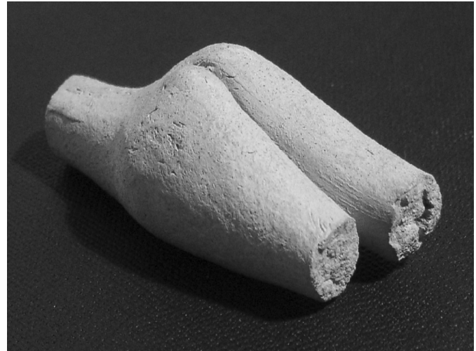
3. kép. Terrakotta töredék (részlet)

A töredékes szobrocska mostani bemutatásának közvetlen célja azonban egészen gyakorlati. Jelentős alkalomkor szerettem volna felhívni a Szépművészeti Múzeumot, hogy nem volna szabad fenntartania a jelenlegi állapotot, ti. azt, hogy kiállításain semmi sem jelzi az ókori Mezopotámiát. Az antik kiállítás, amely a gazdag múzeum talán legnyitottabb részlege,