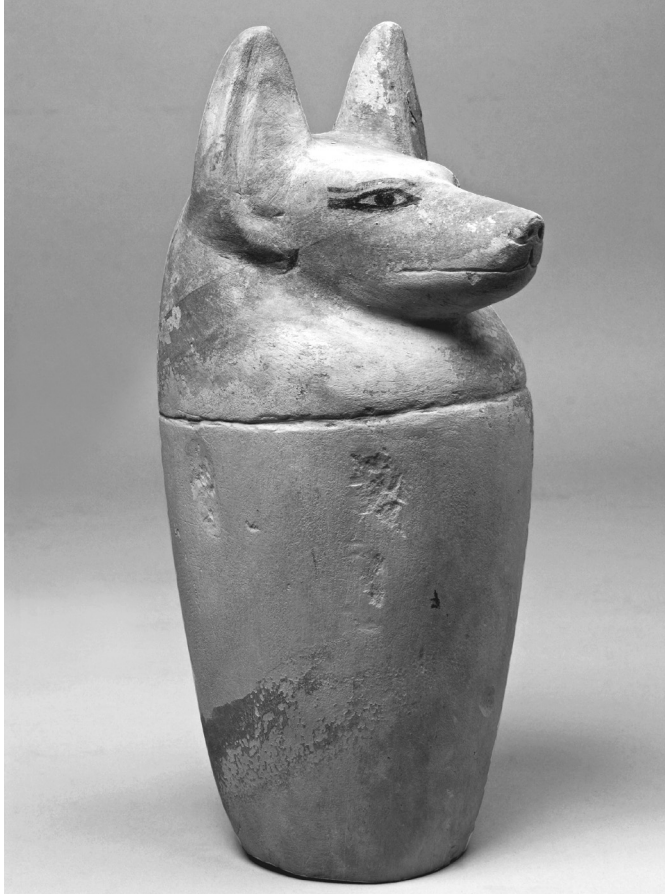
A halott belső szerveinek megőrzésére készült, mészkőből faragott kanópusz-edény a 22-26. dinasztia közötti időszakból (Kr. e. 9-7. század), a Khokha-domb 1. számú szaff-sírjának másodlagos újrafelhasználásakor készült aknasír-ból

kifeszített hosszú lepel vezette a tekintetet a közepén ülő szoborcsoporthoz, melynek elhelyezése és a bejáratról a szobor háttámlájáig vezető lepel ötletesen idézte fel az eredeti környezetet, a sír hosszanti folyosóját. Dzsehutimesz szobra nyilván azért is került a középpontba, mert épp ez a sír volt az, ahol a kiállításon bemutatott kutatási projektek jó pár évvel ezelőtt kezdetüket vették.