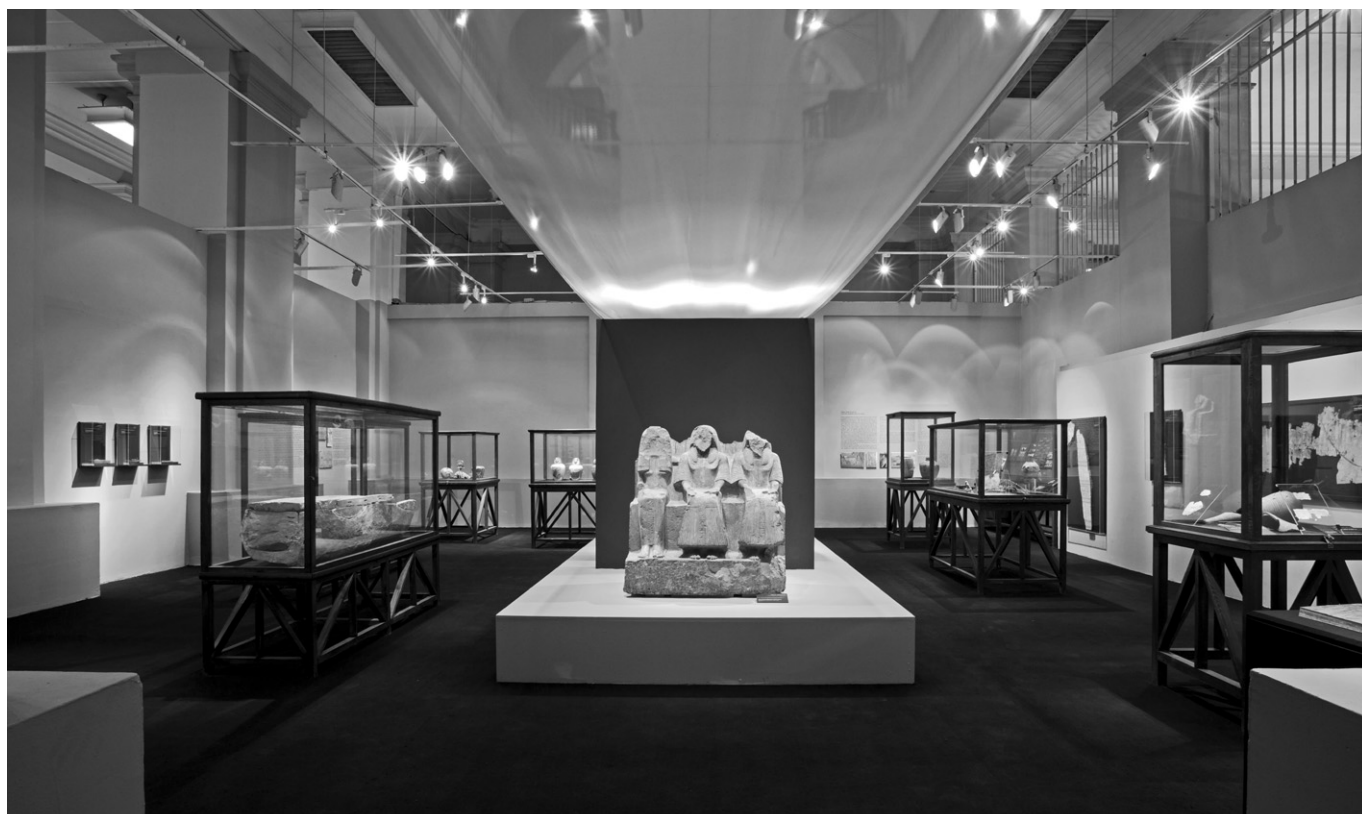
A Kairói Egyiptomi Múzeum időszaki kiállítóterme a magyar kiállítással. A terem közepén Dzsehutimesz és szüleinek szoborhármása látható

A folyosóról a kiállítóterembe belépő látogató egy a 32-es sír tulajdonosát, Dzsehutimeszt és szüleit ábrázoló szoborhármassal találta magát szembe, mely 1902 óta része az Egyiptomi Múzeum gyűjteményének. Ezen a szobron keresztül fogadta egykoron Dzsehutimesz sírjának látogatóit és az áldozatokat. A kiállítóterem bejáratától egy néhány méter magasan