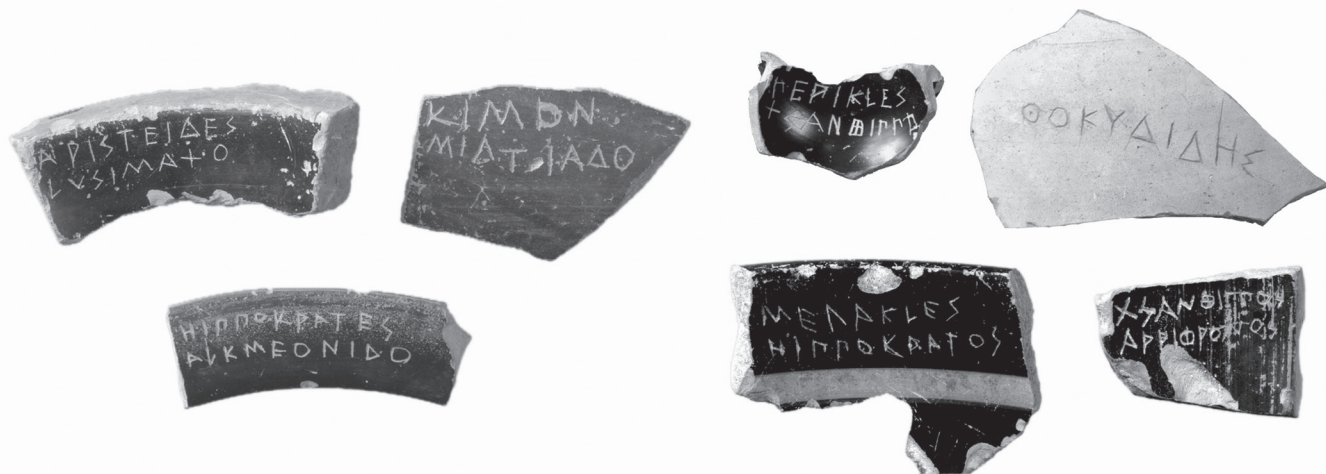
1. kép. Athéni osztrakonok a Kr. e. 5. századból

A testneveléstanárok bére a határozat értelmében havonta és személyenként harminc drachma, az írástanároké pedig havonta és személyenként negyven drachma. A szónoklataik és egyéb ügyeik költségeiről a gyermekfelügyelői törvény rendelkezik. A megszavazott testneveléstanároknak el szabad utazniuk, ha versenyzőként részt akarnak venni valamelyik koszorút adó versenyjátékon, amennyiben a gyermekfelügyelők elengedik őket, és ha olyasvalakit biztosítanak maguk helyett a gyerekek oktatására, akivel a gyermekfelügyelők is meg vannak elégedve. 20 Azért, hogy a bért mindegyikük rendszeresen megkapja, a kincstárnokok a meghatározott összeget (60) minden hónap első napján adják át a testneveléstanároknak és az írástanároknak. Ha