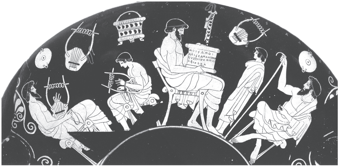
3. kép. Iskolai jelenet attikai vörösalakos csészén: grammatistés papirusztekercsel, előtte áll a tanítvány, mellette pedagógos bottal. Duris-festő, Kr. e. 480 körül (Berlin, Antikensammlung, F2285)

polistól északkeletre fekszik, jórészt feltáratlan. Maradványai alapján bizonyos, hogy a hellénisztikus korban épült. A felirat eleje, közepe és vége hiányos.