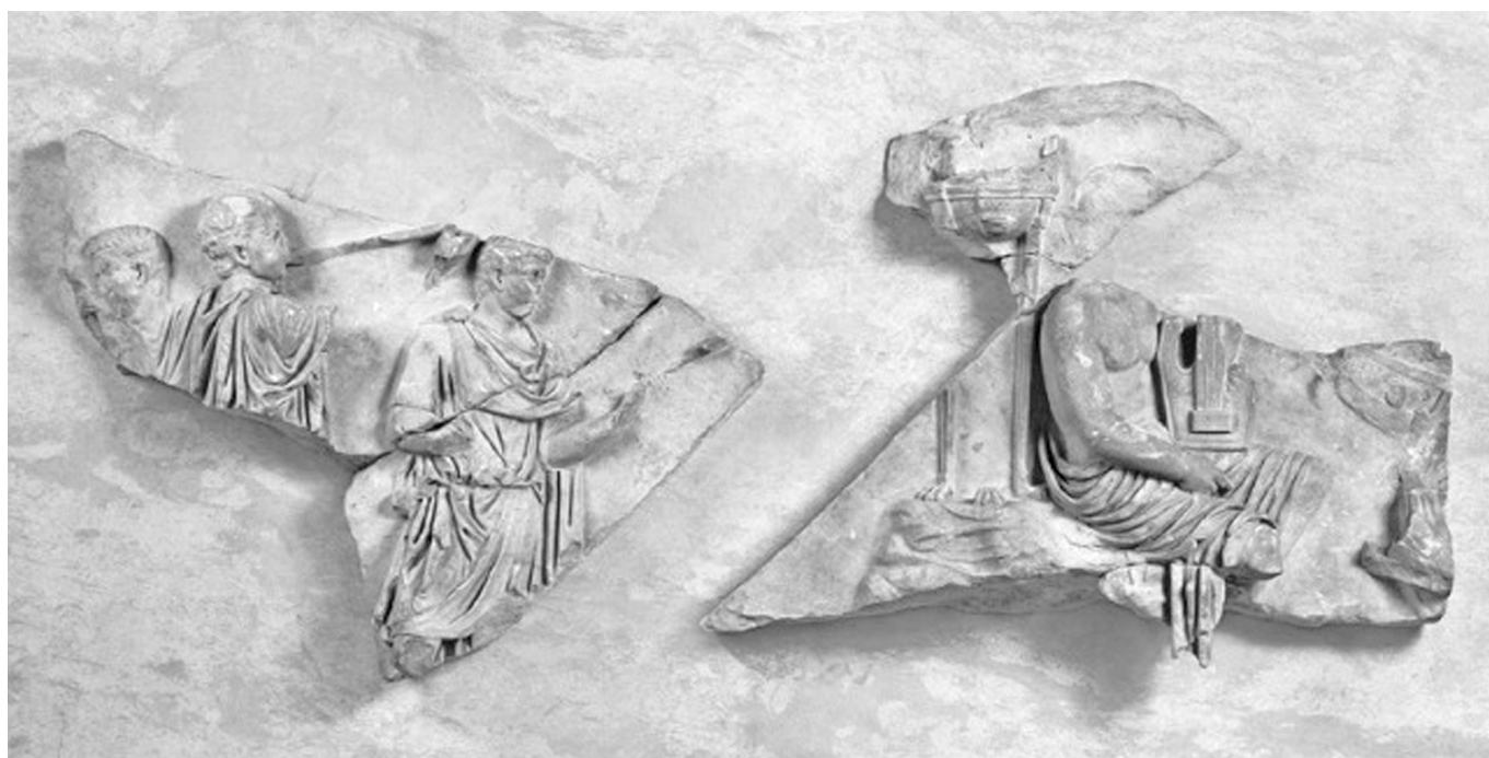
1. kép. Két domborműves lap töredéke ünnepi menet és az actiumi csata jelenetének ábrázolásával. Kr. u. 1. század második negyede

A dombormű szépen példázza az augustusi propagandagépezet egyik fő és ma sem tanulságok nélkül való jellemzőjét, a történelemmé tett fiktív őstörténet és az aktuálpolitika egybe-