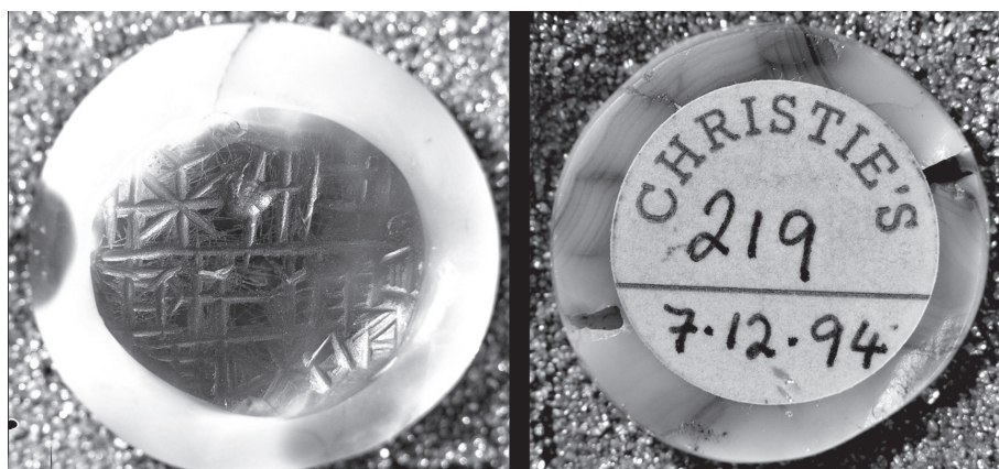
3. kép. II. Kurigalzu által felajánlott szemkő

A tárgyak eredetét elhallgató szövegkiadások és az aukciósházak anyagának összevetése más esetekben is komoly eredményt hozhat. Jól példázzák ezt a Dür-Abī-ēšuhból származó táblák, 62 melyekből 2009 óta mintegy százat közöltek. 63 A Cornell Universityn további 400, a Schøyen-gyűjteményben legalább 30 darab vár publikálásra, 64 emellett Daniel Arnaud már 2007-ben