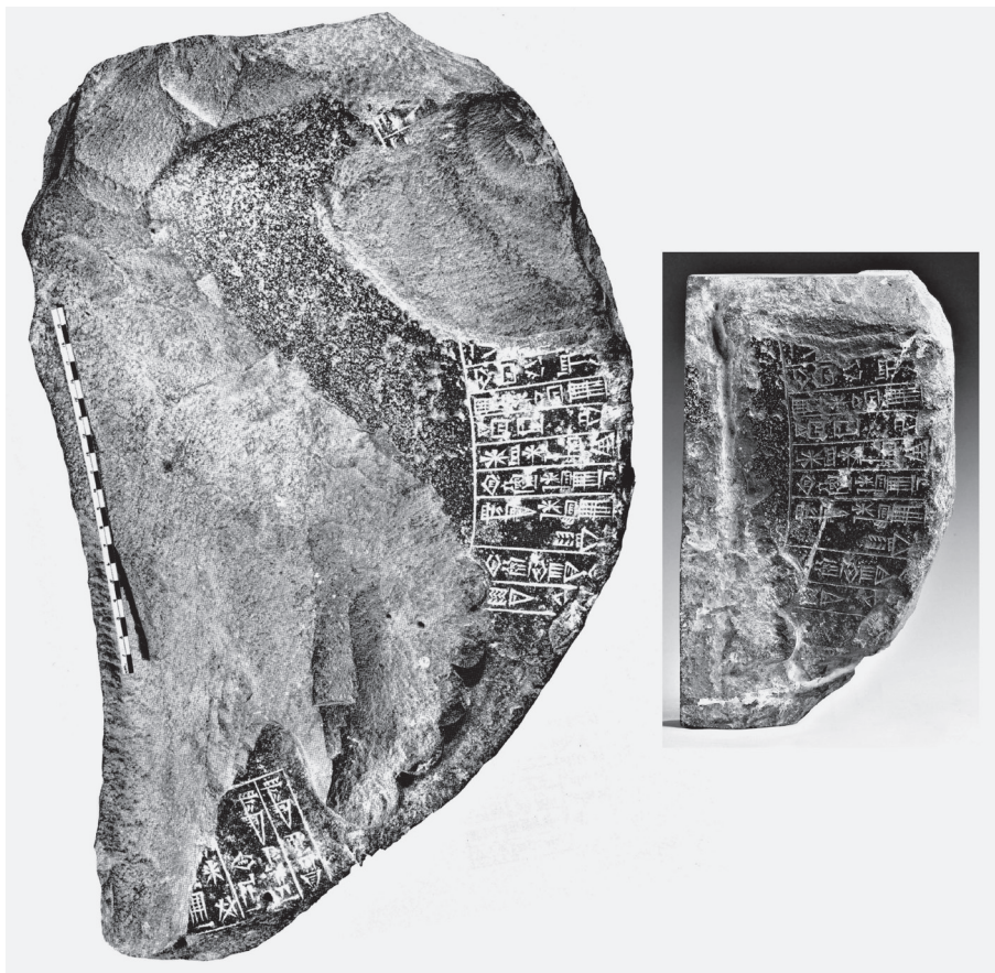
1. kép. Šū-Sîn szobortalapzatának töredéke (Civil 1989, 64) és a belőle kivágott darab (Bonhams 2002, 73)

A háborút követő kereskedelmi embargó aláásta Irak gazdasági erejét, emi-