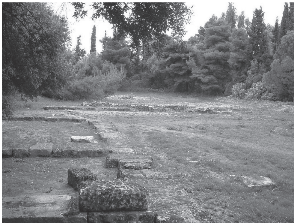
1. kép. Platón Akadémiájának feltételezett helye Athénban

További, a platóni filozófiában felfedezhető pythagoreus hatás mellett szóló érv lehet Aristotelés különvéleménye Platón filozófiai fejlődéséről. Leghíresebb tanítványa szerint Platón úgy jutott el legismertebb tanításához, a Formák tanáéhoz, hogy elfogadta mind a sókratészi nézetet, amely szerint tudásra minden esetben valamilyen univerzálé definíciójaként tehetünk szert, mind pedig a hérakleitiánus nézetet, amely szerint az érzékelhető, keletkezésnek és pusztulásnak kitett létezőkről nem lehetséges ilyen ismeretet alkotni. Aristotelés szerint Platón ezért tételezte a Formákat mint olyan létezőket, amelyek a tudás tárgyai lehetnek, s amelyekben az érzékelhető dolgok részeseznek – ez az álláspont pedig Aristotelés szemében nem különbözik a pythagoreusokétól, amelyet a Metafizikában közvetlenül ez előtt a szakasz előtt ismertet. 25