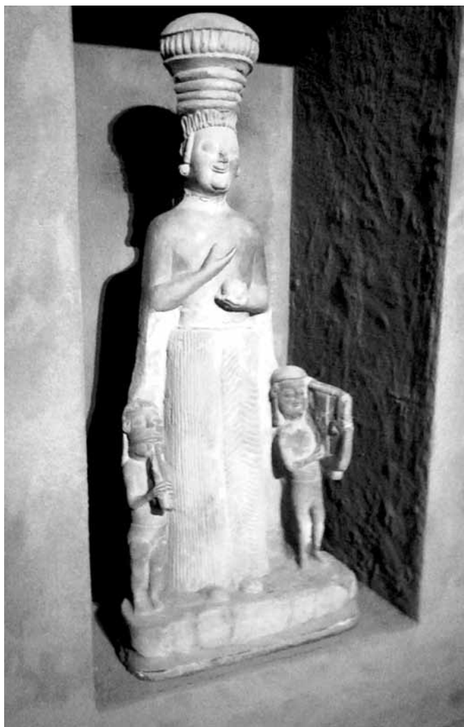
Kybelé, a phryg anyaistennő aulos - és lantjátékosal. Boğazköy, Kr. e. 6. század közepe (Ankara, Anatóliai Civilizációk Múzeuma)

Dante: Paradicsom I. 13–21 (Babits Mihály fordítása)