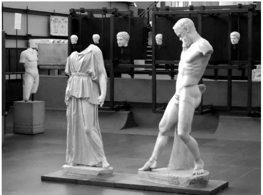
Myrón: Athéna és Marsyas. Kr. e. 450 körül, római kori márványmásolat (Róma, Musei Vaticani)

Ovidius: Átváltozások VI. 382–400 Devecseri Gábor fordítása