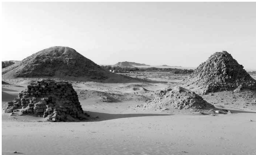
4. kép. Nuri. A kép háttérében Taharko piramisa látható, amely a legnagyobb ilyen típusú építmény volt az ókori Nubia területén

Ré fiá(nak), Taharko(nak), (aki) a Szaiszban lakozó Ozirisz kegyeltje