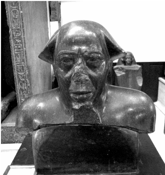
6. kép. Montuemhatnak, Théba polgármesterének és Amun Negyedik Prófétajának képmása (a szerző felvétele)

A Felső-Egyiptom és el Kurru közötti, feltételezhetően egyre szorosabb gazdasági, kulturális és politikai (a sorrend nem véletlen!) kapcsolat utolsó láncszeme – legalábbis jelenlegi ismeretünk szerint – a thébai Isteni Feleség hivatalának átvétele volt. Utóbbi funkciói és intézményi keretei (azaz a hivatal örökbefogadás útján történő öröklődése) lehetővé tették a kusita dinasztia tagjai számára, hogy a Felső-Egyiptom feletti uralomra támasztott igényüket minden kétséget kizáróan legitim módon és erőszak nélkül alapozzák meg (talán érdemes megjegyezni, hogy Felső-Egyiptom és el Kurru viszonyában Théba státusza nagyon hasonló lehetett ahhoz, amilyen szerepet Babilón töltött be Assíria és Babilónia kapcsolatában). Azzal, hogy Kasta elérte, hogy Sepenvepet örökbe fogadja lányát, Amenirdiszt, a kusita hercegnőt, egy olyan folyamat zárult le, amelyről azonban nem sok konkrétumot tudunk.