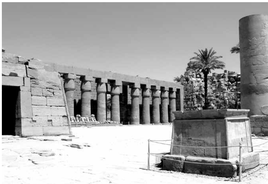
2. kép. Az ún. Bubasztiszi-udvar Karnakban, amely Taharko thébai építkezéseinek egyik fő színtere volt

Sebitkót a kettős királyság trónján unokatestvére, Taharko, Piankhi fia követte. Taharko (Kr. e. 690–664) a 25. dinasztia legjobban dokumentált fáraója – és egyben legellentmondásosabb alakja. Számos királyfelirata ismert Alsó-Egyiptomból, Memphisz térségéből, Karnakból, valamint Kútból, ahol elsősorban a kawai Amun-templomban fennmaradt sztéléi érdemelnek említést. Huszonnégy évig tartó regnálása azonban meglehetősen ambivalensnek mondható. Uralkodásának első évtizede a kusita dinasztia virágkora Egyiptomban, ami évszázadok óta nem látott, látványos építkezésekben is megnyilvánult. A Kr. e. 670-es évektől kezdődően azonban állandósult a konfliktus Asszíriával, és uralma végén Taharkónak meg kellett élnie a kusita hatalom összeomlásának kezdetét Egyiptomban.