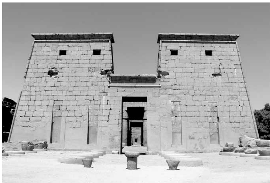
3. kép. Taharko porticus ának maradványai Karnakban a Honszu-templom előtt (a szerző felvétele)

Nem szabad azonban megfeledkezni arról sem, hogy két tényező is arra készíthette Sebitkót, hogy Taharkót jelölje ki örökösének. Egyrészt fia, Tanutamani feltehetőleg még nagyon fiatal volt, de még lényegesebb, hogy Sebitko megváltoztatott külpolitikájának következményeként érlelődött az Asszíriával szembeni fegyveres konfliktus, és ezért olyan királyi sarjra volt szükség, akire rá lehetett bízni a hadsereg vezetését, és aki, mint kijelölt trónörökös, kellő tekintéllyel rendelkezett. 28 Ugyanakkor elődje iránta tanúsított szeretetének visszatérő hangsú-