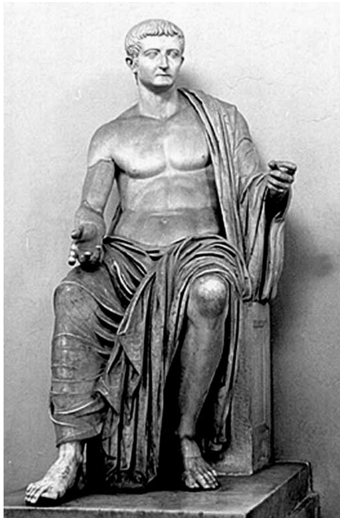
3. ábra. Tiberius császár privernumi ülőszobra (Musei Vaticani, Róma)

Tiberiusnak nem véletlenül volt szüksége erre az elsősorban politikai indíttatású perre, amely szerves részét képezte az Augustus első utódaként uralkodó, a hatalma megerősítésén fáradozó császár tevékenységének. Elődjének hatalma és kormányzati rendszere javarészt éppen annak személyére épült, s az augustusi karizmát Tiberius természetesen nem örökölhette, nem lehetett teljesen ugyanaz a császár. Minden törvényi és egyéb előíráshoz képest a legelső helyen az uralkodói auctoritas állt, melynek alapjait még Augustus teremtette meg saját felsőbbrendűségére építve. 67 Ebből adódóan érthető, ha 14 után az új princeps nek első lépésként le kellett küzdenie a karizmatikus előd halálából adódó legitimációs válságot. Ennek a legitimációs deficitnek az oka abban keresendő, hogy a rendszer több fontos pillére informális volt, így azokat meg kellett erősíteni. 68 Gyermeketi megemlékezése a feliraton Tiberius erőteljes dinasztikus törekvéseire is rávilágít. Ezekkel a politikai törekvésekkel nem ért össze az esetlegesen az uralkodó jövőjét és utódját is megkérdőjelező, sőt az azt csupán tudakoló szándék sem. Bizonyos szinten a mágia nevének tárgyat képezte, de ahogy Thrasyllus vagy később magának Nerónak a példája is mutatja, a birodalom első embere is élhetett vele, így szerepét mindig differenciáltan kell vizsgálni. Az ezt a tevékenységet űző emberek visszaszorítására pedig kiváló eszköznek kínálkoztak a Tacitus által „súlyos pusztításként” minősített,