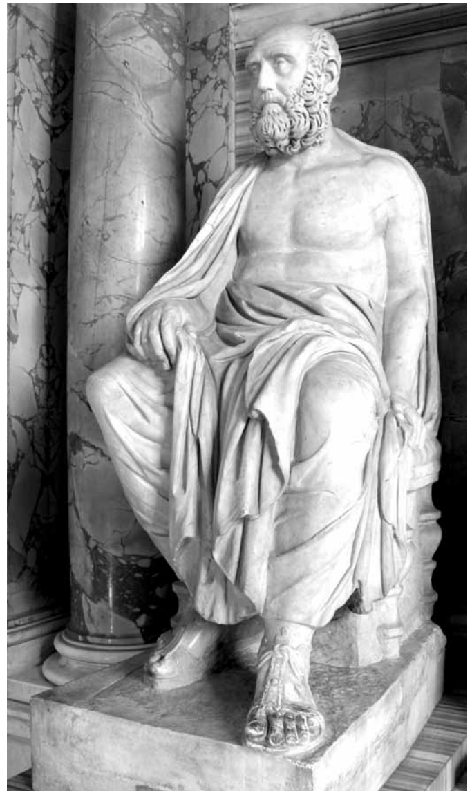
1. kép. Aelius Aristeidés márványszobra. Róma, Vatikáni Múzeum

Sok más harcot is említhetnénk, különösen azokat, amelyeket nemrégiben értetek és veletek harcoltunk meg minden lehetséges alkalommal – olyan leírás volna ez, amely sok időt venne igénybe. De miért is időznénk ezeknél az eseményeknél?