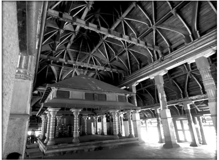
3. kép. Színpad egy keralai templomszínházban

A 12. századra már cizellálódott az indiai színház képe. Kiindulópontként még mindig a Nátjasásztra szolgált, azonban új rendszerezési elvek és kialakítási módszerek jöttek létre. A 12. századi Kasmírban élő Sáradátanaja Bhávaprakásana című művében már a kör alapterületű színházat is említi. 30 Nem meglepő, ha a korai áldozati terekre gondolunk. Fontosabb azonban az, hogy az általa felsorolt formák mind megfelelnek a királyoknak, attól függően, milyen társasággal érkeznek az előadás megtekintésére. Ezzel a Nátjasásztra szigorúan templomi környezetben értelmezendő szabályrendszere mellett a társadalom más rétegei is megjelennek. Fontos rendszerezési elv lesz a színház helye, az előadás alkalmá és a közönség ösz-