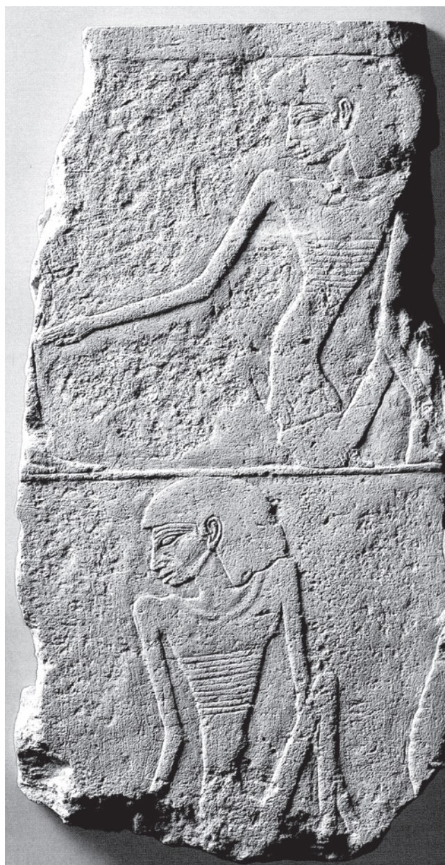
1. kép. Éhezőket ábrázoló domborműtöredék Unisz szakkarai halotti körzetéből, Óbirodalom (Louvre E 17381; Ziegler 1999, 360 nyomán)

Az éhezés ritkán volt témája az egyiptomi képi ábrázolásoknak. A kevés ismert példa közül a leghíresebb az 5. dinasztia végén, a Kr. e. 24. század utolsó harmadában uralkodó Unisz király szakkarai piramiskörzetéből származik. Az uralkodó halotti együttesének részeként a völgytemplomot a piramis melletti halotti templommal összekötő kövezett feljáró falának két fennmaradt töredékén csontsovánnyá fogyott, elcsigázott, egymást támogató vagy magukba roskadtnak ülő férfiakat és nőket