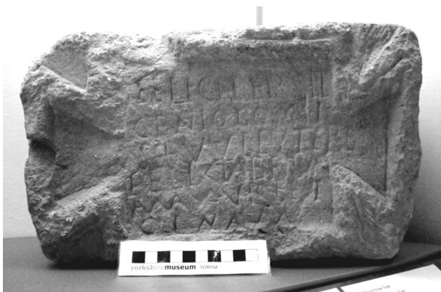
1. kép. Aranyműves műhely felirata az angliai Maltonból

A későbbi ásatások eredményei alapján ma már tudjuk, hogy a felirat a római kori Derventio vicusának területére lokalizálja a sikeres használatra ajánlott műhelyt. A katonai tábor, amelyhez a polgári település tartozott, a Kr. u 200–367 közötti időszakban állt fenn, ennek alapján, a felirat sajátosságait is figyelembe véve, a Kr. u. 3. században – esetleg a 4. század elején – dolgozhatott itt a fiatal rabszolga. E néhány sor félreérthetetlenül tanúsítja egy britanniai aranyműves műhely meglétét, miközben – egyértelmű szövege ellenére – további kérdések sorát vetheti fel a korszak aranyműveseivel kapcsolatban. A műhely használójaként megszólított kis rabszolga, akinek sajnos még a nevét sem tudhatjuk meg, bérlőként, alkalmazottként, netán tulajdonosként dolgozott-e itt? Munkáját egymaga végezte-e, vagy esetleg akadt segítőtje? Fiatal kora ellenére már mester lehetett?