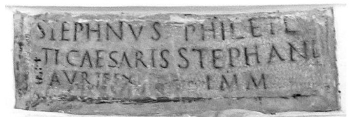
2. kép. Stephanus aurifex felirata

A feliratán magát aranyművesnek vallók jelentős hányada – 42-en! – Rómában tevékenykedett, és a feliratok keltezése alapján főként a kora császárkor folyamán dolgoztak a Városban. Ebben az időszakban tizenegyen a császári család udvartartásához tartoztak, nevük főként a 17. században felfedezett közös temetkezőhelyek, a columbaria kis fülkék fedő kölapokról ismert. A „visszafogott” életmódot dicsőítő hivatalos propaganda és a luxus ellen hozott rendelkezések ellenére már Augustus korában is fontos volt a fényűzés körébe sorolható tárgyak előállítása, így e mestereknek az ékszerekészítés mellett az asztali edények elkészítésében, javításában is szerepük lehetett. Bizonyára nem mind készült saját használatra, szükség volt a hivatalos vagy baráti ajándéokra, kitüntetésként adományozott értékes tárgyakra is, mégis meglepő, hogy Augustus aranyművese mellett Livia számára három felszabadított (Zeuxis aurifex , 10 M. Iulius Agatopodes, 11 M. Livius Menander 12 ) és két rabszolga státuszú aranyműves (Epythicanus 13 és Hedys 14 ), valamint egy aranyozó (Philomusus 15 ) dolgozott! Tiberius aranyművese volt Stephanus 16 (2. kép) és minden bizonnyal Protogenes 17 is, aki hosszú élete során három fiát temette el. 18 A császári aranyműves címmel járó kötelezettségek mellett a mesterek feltehetően saját üzlettel is rendelkeztek. Tacitus 19