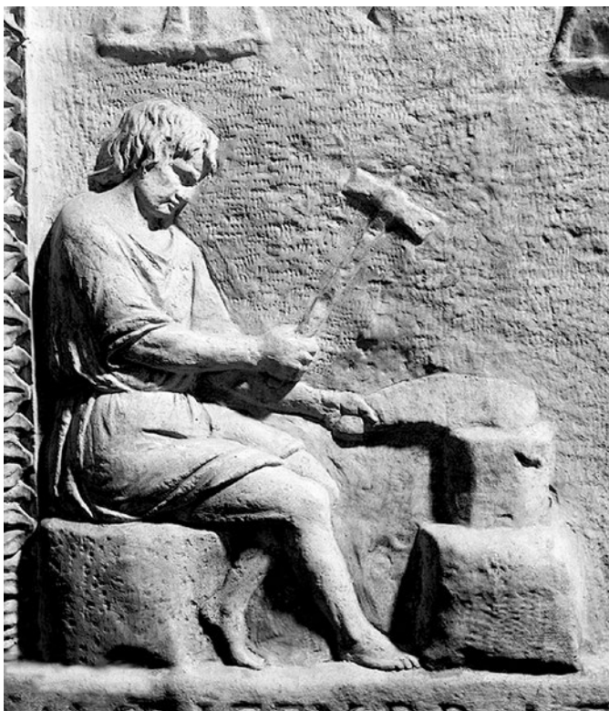
4. kép. Brattiarium munka közben

Az egyénileg dolgozó, de azonos foglalkozást űző mesterek egyesületekben segítettek egymás. Collegium ot aranyműves mesterek is létrehoztak, s talán a pompeii választási felirat is hasonló egyesületet sejtet. Aranyműves egyesületre bizonyosság A. Fourius Seleucus felirata, 61 aki Rómában a conlegium aurificum (sic!) magister quinquennalis tisztségét töltötte be a Kr. u. 1. század elején, de collegium anulariorum , 62 illetve collegium inauratorum et brattiariorum 63 létéről is tudósítanak em-