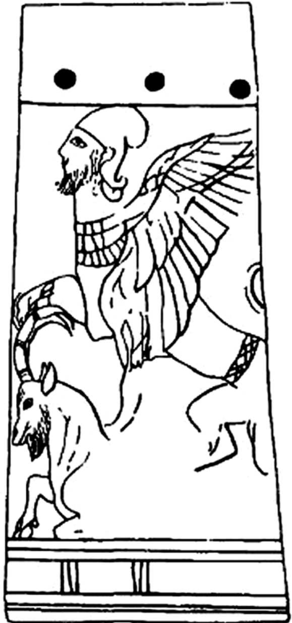
5. kép. Elefántcsont-faragvány Megiddóból. Kr. e. 13–12. század, Oriental Institute, Chicago (Keel 1997, 84, 97. kép nyomán)

Az utolsó példa amellet, hogy megmutatja, a megfelelő filológiai elemzéssel karöltve miként járulhat hozzá az ikonográfiai alapú elemzés egy ószövetségi szöveghely pontosabb megértéséhez, ismételten rávilágít arra, hogy a freiburgi iskola ál-