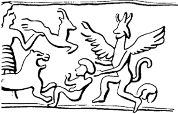
4. kép. Hematit pecséthenger lenyomata Tell el-'Ajjulból. Kr. e. 15–12. század, Palestine Museum, Jeruzsálem, 35.4011 (Keel 1997, 83, 96. kép nyomán)

neve, ahova kítűzték az áldozati bakot. A Leviticus 16 összefüggésében világos, hogy személynévként kell értelmeznünk Azázél nevét, hiszen a l'JHWH mellett hasonló konstrukcióban áll ott a la'aza'zel , az Úrnak, illetve Azázélnak szánt bakokról van szó. 24 A rítus az eliminatio kategóriájába tartozik, ami talán egy régi képzet és démonhit maradványa a Papi Irat egyik jelentős helyén, ahol teológiailag integrálva fontos szerepet tölt be. 25 Nincs megingatva a monoteizmus, hiszen a teológiai keret nem hagy kétséget afelől, hogy a bűnbocsánatot kitől kell várni: a kecskebak a pusztulásba viszi a vétket, az életet pedig JHWH adja.