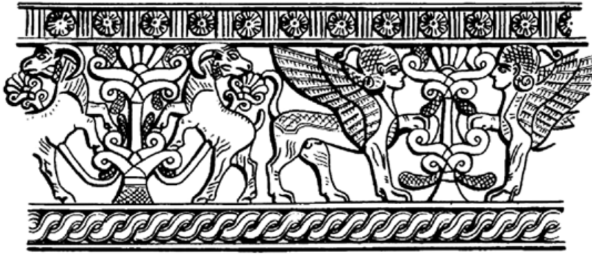
1. kép. Stilizált fák, kecskék és kerubok. Elefántesont pyxis (Kr. e. 9–7. század), lelőhely: Kalhu (Nimrud) (Keel 1997, 142, 189. kép nyomán)

fröccsent meg a lovakra, amelyekkel áthajtott velük rajta.