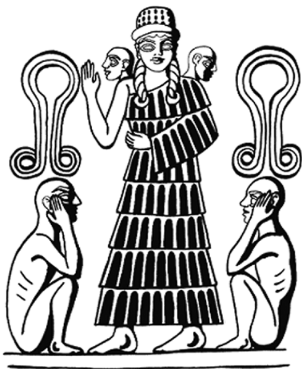
3. kép. A születés istennője magzatokkal és az anyaméh szimbólumával. A rajz a Louvre gyűjteményében található óbabilóni kori terrakottaplakett (AO. 12442) alapján készült

valójában sohasem éltek. Mary Douglas klasszikus, a tabu koncepciójával kapcsolatos megfogalmazása szerint olyan lényeknek tekinthetjük őket, akik kívül esnek a környezetet alkotó (s természetesen társadalmi konstrukciónak tekinthető) normatív kategóriákon – megfoghatatlanok, sem ide, sem oda nem tartoznak. Az ilyen entitásokat gyakorta tekintették szentnek vagy veszélyesnek, vagy esetleg mindkettőnek egyszerre. 16