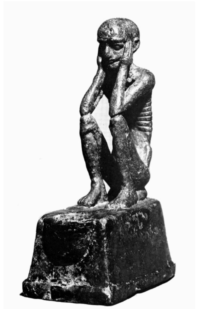
2. kép. Halva született magzatot/csecsemőt ábrázoló óbabilóni bronzszobrocska a Kr. e. 19. századból, feltehetőleg Larsa városából. A 15 cm magas műtárgy ma a Cincinnati Art Museumban található (katalógusszám: 1956.14). Porada 1964, Fig. 3. nyomán

Mindenekelőtt azonban, hogy megfelelő kontextusba helyezzük a rituálét, ismerkedjünk meg közelebbről főszereplőivel, magukkal a kūbuk kkal! Az akkád kūbu szó alapvető jelentése „halva született magzat/csecsemő”, illetve „halott kisgyermek”. 12 A 2. képen látható óbabilóni kori bronzszobrocska minden valószínűség szerint éppen egy ilyen entitást ábrázol, főleg, mivel a születés istennőjét megjelenítő, egykorú terrakottareliefeken ugyanilyen vézna, magzati pózban ábrázolt alakokat láthatunk (3. kép) 13 – az utóbbi kontextusban egyértelmű, hogy ezeket koraszülött csecsemőkként, illetve magzatokként értelmezhetjük. 14 A kūbu szó az ékírásos szövegekben olykor isten-determinatívummal 15 szerepel, mely arra utal, hogy ha nem is feltétlenül megistenült, de mindenképpen természetfölötti erővel bíró lényekről van szó. Mindez tökéletes összhangban áll sajátos, s alapvetően meghatározhatatlan, liminális létállapotukkal: hiszen olyan holtakról van szó, kik