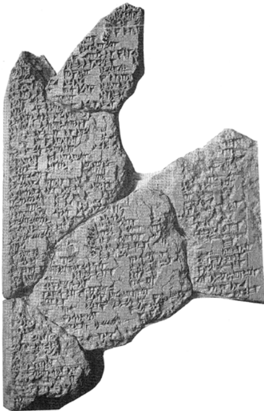
1. kép. KBo XXXVI 29: akkád nyelvű ráolvasásokat és rituálékat tartalmazó gyűjteményes tábla Hattušából („A kézirat”, az előlap felső részének töredéke) (Schwemer 1998, Tf. I. nyomán)

Noha első hallásra meglepőnek tűnhet, nagyjából ugyanezt mondhatjuk el a középső, többé-kevésbé teljes és tisztán kiolvasható sza-