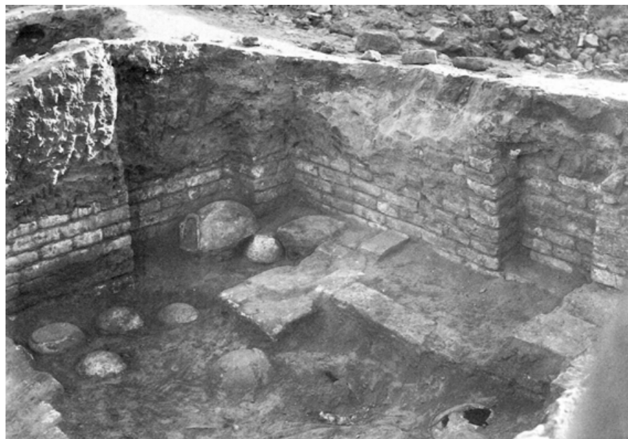
4. kép. Csecsemő- és kisgyermek-temetkezések Ku-Ningal híres, óbabilóni kori lakóházának padlója alatt Ur városában (Quiet Street 7). A kép elkészültekor a régészek már elbontották a korabeli padlót, így nem feltétlen érzékelhető, hogy eredetileg az edények felső része kiemelkedett a padlószintből – azaz láthatóak és jelenvalóak voltak az élők által használt lakótérben (Woolley–Mallowan 1976, Plate 29 nyomán)

éltek túl. 31 Az efféle (s minden bizonnyal gyakori) problémák orvoslásának módja itt egészen más hagyományban gyökerezett: ráolvasások és mágikus rituálék alkalmazásán alapult, s ismét csak a már említett ráolvasópap, az āšipu hatáskörébe tartozott. 32