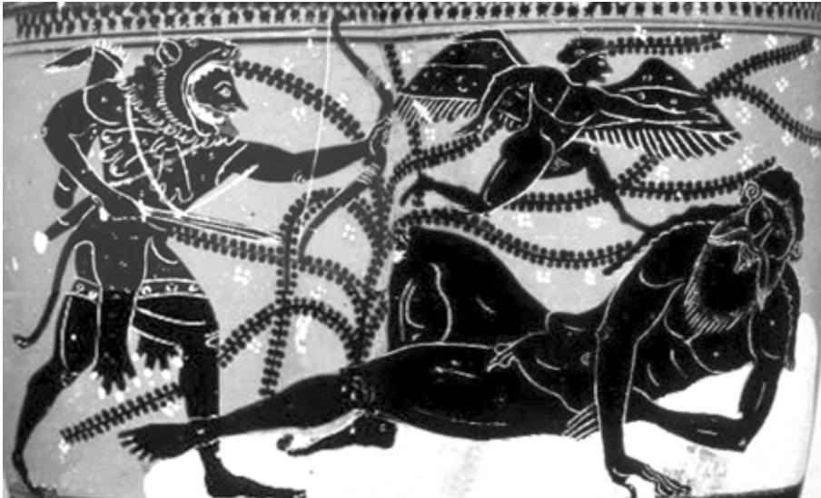
2. kép. Athéni feketealakos lékythos: Héraklés megöli az alvó Alkyoneust, Kr. e. 6. század. Toledo Museum of Art

„a fekete éj gyermekét” hívja segítségül, hogy az „istenek által gyűlölt szörnyön” bosszút állhasson (590–595). Az első irodalmi történetekben tehát az alvás alkalomként szolgál arra, hogy valaki más visszaéljen az alvó védtelenségével. Polyphemos a vázafestészetben is az első, akit alvás közben ábrázoltak. Az eleusisi múzeum protoattikai amphoráján és egy másik, protoargosi kratérján egyaránt az alvásból felébredve mutatkozik.