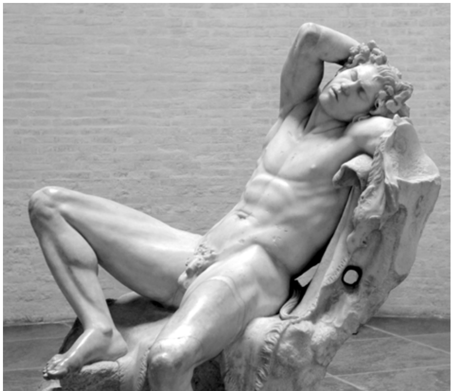
5. kép. Alvó szatír márványszobra (Barberini faun), Kr. e. 2. század (18. századi kiegészítésekkel). München, Glyptothek

A lélek ugyanis az alvás során mozog a legitenzívében. Amikor a meleg a test egyéb részeiből a bensőbe hatol, akkor sokféle erős mozgás uralkodik el, s ez nem úgy történik, ahogyan az emberek általában gondolják, ti. hogy a lélek akkor nyugalomban és magánál van, s így marad mindaddig, amíg nem lát semmilyen álomképet. Éppen hogy ennek az ellentéte történik: merthogy a lélek éppen ekkor a legerő-