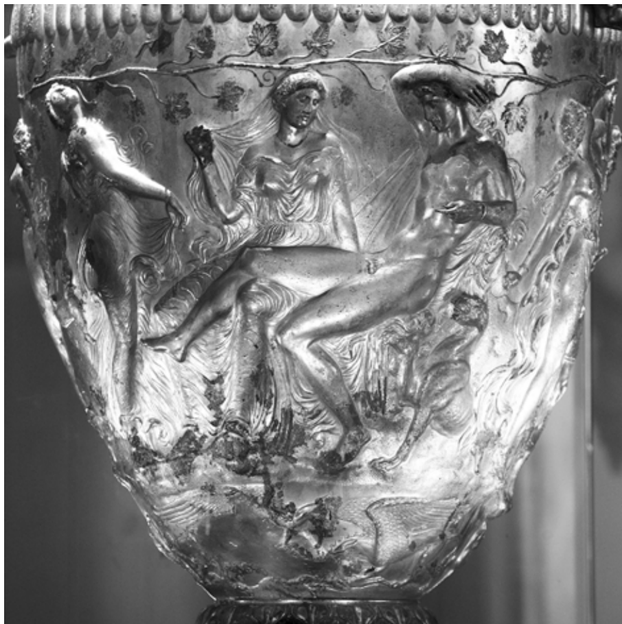
4. kép. A Derveni kratér részlete Dionysosszal és Ariadnéval, Kr. e. 330–320 k. Thesszaloniki Régészeti Múzeum

Bacchos Amphietést hívom, a chthonikus Dionysost, ki a szépfürtű szűz nimfákkal együtt ébredszik, miután pihenvén Persephoné mellett a szent lakokban három esztendőn át alszik szent bacchosi álmat. 6