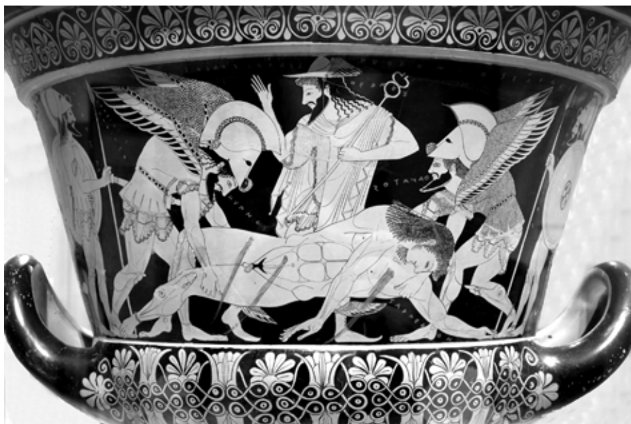
1. kép. Hypnos és Thanatos Lykiába viszi Sarpédón holttestét. Euphronios vörösalakos kalyx-kratérja, Kr. e. 515 k. Museo Archeologico, Cerveteri (2008-ig a Metropolitan Museum of Art gyűjteményében)

denciát látnak – mint például Emily Vermeule vagy Jan Bremmer –, arra hivatkoznak, hogy az Ilias a halált természetes jelenségnek fogja fel, ami ugyanolyan normális, mint az alvás (Vermeule 1979, 145; Bremmer 1994, 96). Mások – például Marbury Ogle vagy Carla Mainoldi – szerint pedig inkább egyfajta költői toposzról van itt szó, mely a hēróikus világon belül értelmezendő, s ezt vették át a vázafestők is (Ogle 1933, 84; Mainoldi 1987, 10). Következésképpen, folytathatjuk az érvelést, szó sem lehet arról, hogy a modern kori eufémizmus, azaz a halálnak alvásként való megnevezése, sőt felfogása az Ilias -ból eredne. Az eposzok világában egyébként sem igen hasonlít a halál valamiféle szép álomba merüléshez: a halál a legrettegetesebb erőszakra és szenvedésre következik, és a halott hősnak csupán egy árnyékszerű egzisztenciát biztosít a Hádésban. Ezt a túlvilágot egyik hős sem kívánja magának, legalábbis az