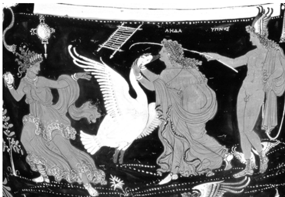
3. kép. Apuliai vörösalakos lutrophoros Lédával és Hypnoszal, Kr. e. 350–340 k. The J. Paul Getty Museum, Malibu

Lerészegedés és elalvás egy másik szörny történetében is sorsdöntő mozzanat: a gigász Alkyoneust, Gaia fiát álmában öli meg Héraklés (Kalpaxis 1986, 679; Hazzikostas 1990, 41). Ezt a gyilkosságot huszonöt vázafestményen ábrázolták, miközben a mítosz irodalmi forrásai közül egyik sem tud arról, hogy Héraklés álmában ölte volna meg a gigászt (Pindaros I. 6, 31; N. 4, 25; Apollodóros I. 6, 1). A vázafestők ellenben ragasz-