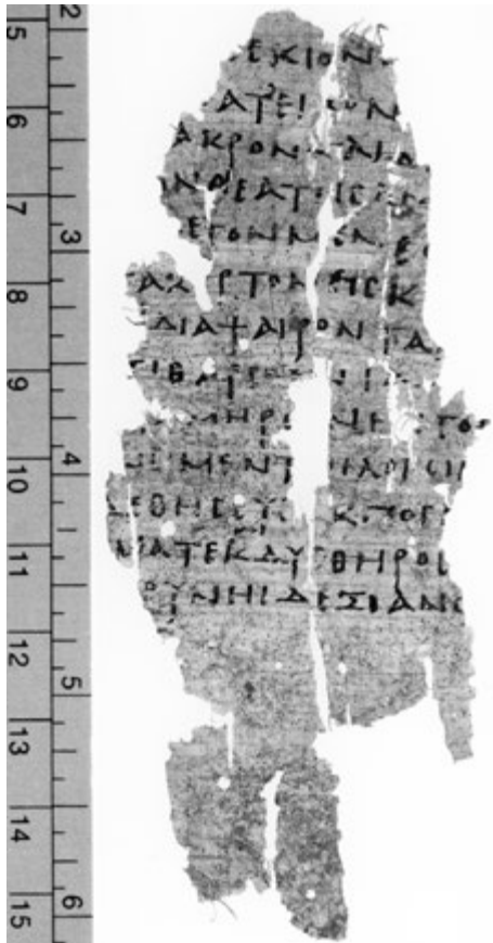
3. kép. Császárkori papirusztöredék Euripidés Théseus című tragédiája 13 sorával (P. Oxy. 50 3530, 386b töredék)

HÍRNÖK Hát kérem, tetszik tudni, úgy van az, hogy ott az oszlopok mögül előrontott a rém! Nem bírtam nézni sem, behunytam fél szemem, csak félig lássam, hogy milyen gigantikus. De bezzeg Théseus! A biztonságra ő füttyült, a félig embert és félig bikát görbe szarvának fittyet hányva nagy dühvel fellökte, hogy a föld porát söpörve csak gurult, nagy bátran ezt mívelte Théseus! A szörnynek minden tagja, belső részei kocódtak össze, bim-bam, s ő, kit Aigeus fiának mondanak, holott Poseidóné, ruháit mind ledobva a vadállatot úgy vágta fejbe bunkósbotja végivel, a jobb kezét lendítve, hogy menten kinyúlt.