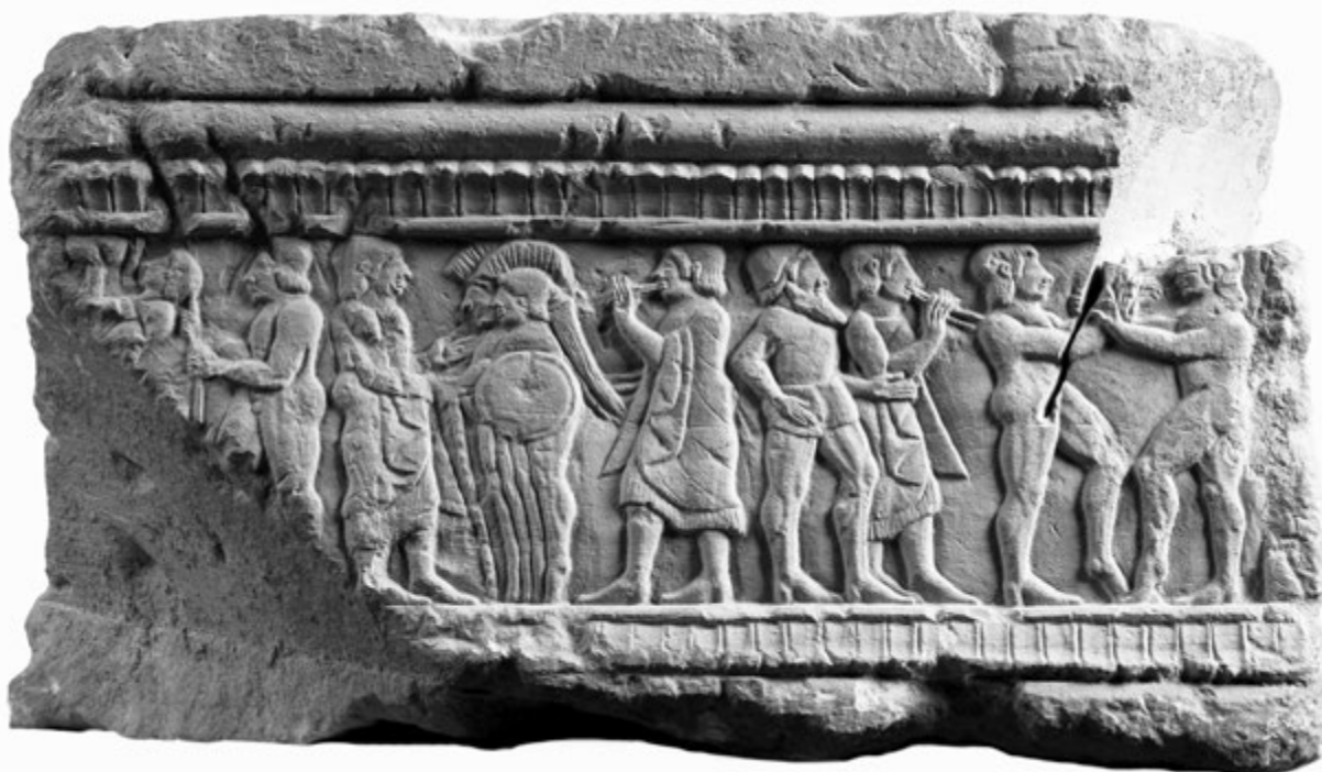
2. kép. Akrobaták, sportolók, zenészek, Phersu. Etruszk síremléktalapzat, Clusium, Kr. e. 480 körül (a talapzatot saroknézetből lásd a 75. oldalon)

Nem cáfolatául semminek, de azért nem is csak egyszerű illusztrációként.