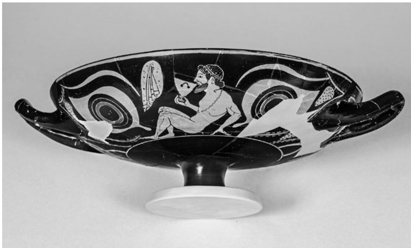
9. kép. Athéni vörösalakos kylix. Andokidés-festő, Kr. e. 520 körül

Ugyanez igaz a szintén a Hellas művészetét bemutató teremrészben elhelyezett csodálatos tárgyra, az Andokidés-festő szemes kylixére (9. kép), mely Athénban készült, de a kultúrák találkozásának egy igen egyszerű gyakorlata, a tengeri kereskedelem folytán, amennyire ez tudható, Itáliából került elő. 25 A szemes kylix ajkunkhoz emeléskor az a két szem, amely visszanez ránk, egy dionyszosi megkettőződés jegyében („két Thébát látok”) a tulajdon két szemünk: az antik ember a symposion rítusában saját magával szembesült. Az Andokidés-festő kylixén egy skyphosból ivó férfialak éppúgy a symposion keretében lép át Dionysos világába, ahogy mi magunk is, pontosabban az az énünk, amely a váza „tükreben” viszsza-köszön. Ez számunkra elsősorban esztétikai tapasztalat, ám alapszerkezete az antik vallás ismerete nélkül aligha belátható. Tárgyról tárgyra járva tárul fel tehát Hellas művészetének né-