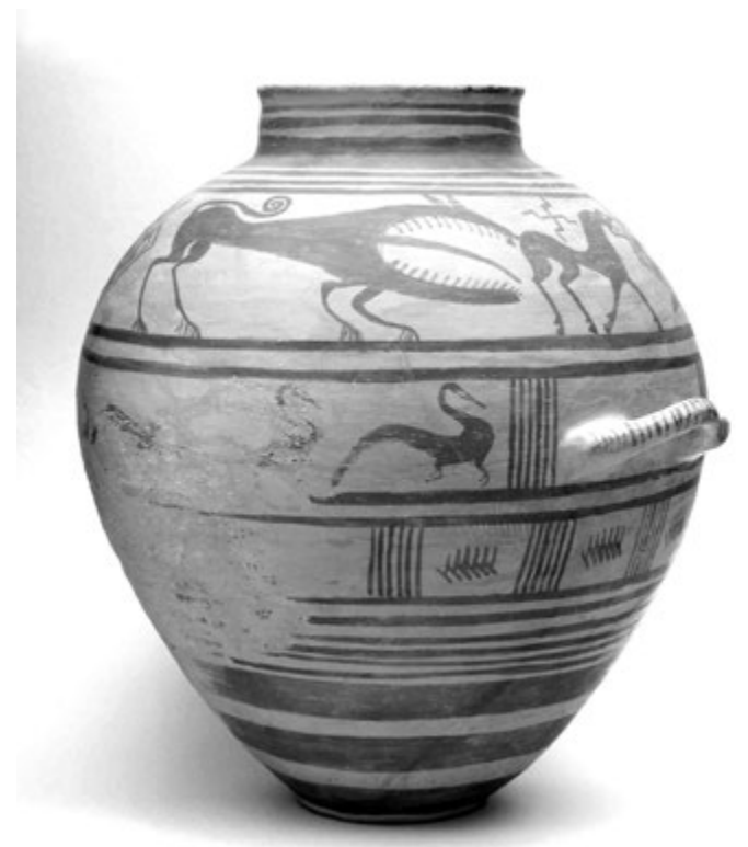
6. kép. Etruszk olla. Narce-festő, Kr. e. 700–690

Ám a magam részéről mégis egy olyan tárgyat emelnék ki, amely már nem itt, hanem éppen a Hellas művészetét bemutató teremrészben kapott elhelyezést, a határok átjárhatóságára is rávilágítva: egy apuliai vörösalakos oszlopkratérról van szó (8. kép), mely a kiállítás egészének összetett szempontrendszerét – és egyszersmind a szempontok szétválaszthatatlanságát is – gyönyörűen példázza. Mint a felirat is utal rá, jelen van itt a kultúrák ösz-