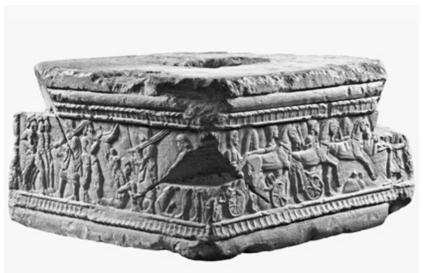
7. kép. Etruszk síremléktalapzat. Clusium, Kr. e. 480 körül

szefonódásának szempontja (a dél-itáliai görög polisban, Tarasban készült vegyítőedényen a nőalak kezében tartott edény – trozzella – helyi, messapus eredetű; a két ifjú is helyi viseletben jelenik meg), adott a vallási kontextus, amely sajátos, dél-itáliai színezettel bír: itt a Dionysos világába való belépés – a szőlőt tartó ifjú talán a halottal azonos – egyúttal a holtak világába való átlépést is jelenti, továbbá az esztétikai szempont is különös hangsúlyt nyerhet, nemcsak a tárgy és az ábrázolás megkapó szépsége miatt, hanem azért is, mert a „kép a képben” játék (az egyik ifjú egy olyan kratérből merít bort, amilyen éppen ez az edény is) számunkra elsősorban esztétikai