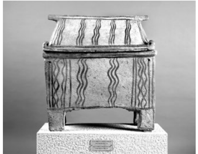
10. kép. Mykénéi sírláda (larnax). Kréta, Kr. e. 1250–1200

Ahogy ígértem, itt megtorpanok, s csak kérdéseket, illetve állításokat fogalmazok meg a további két teremmel kapcsolatban. Az első kérdés: merre tovább? Az elsősorban esztétikai élmény után inkább tanulni vágyunk, vagy éppen kontemplálni? Tegyük fel (és megkockáztatom, hogy ez a jobb választás), hogy balra indultunk el, és a Csonka négyzettel folytatjuk a sétát: itt mivel kezdjük? A terem közepével (római portrészobrok galériája; a görög figurális vázafestészet fejlődése) vagy a fal menti, enciklopédiához méltóan kimerítő tárlóssorral? Vagy esetleg az ókori Mediterráneumnak azzal a nagyszabású térképével, amelynek művészeti terve Gerhes Gábortól származik, s amely jelentős segítséget nyújt az e teremben bemutatott kulturális interakciók vizualizációjához? Vagy éppen a Museionnal , amely Az évszak műtárgya című sorozat utódjá, és ezúttal éppen medmai terrakottaszobrocskákat mutat be