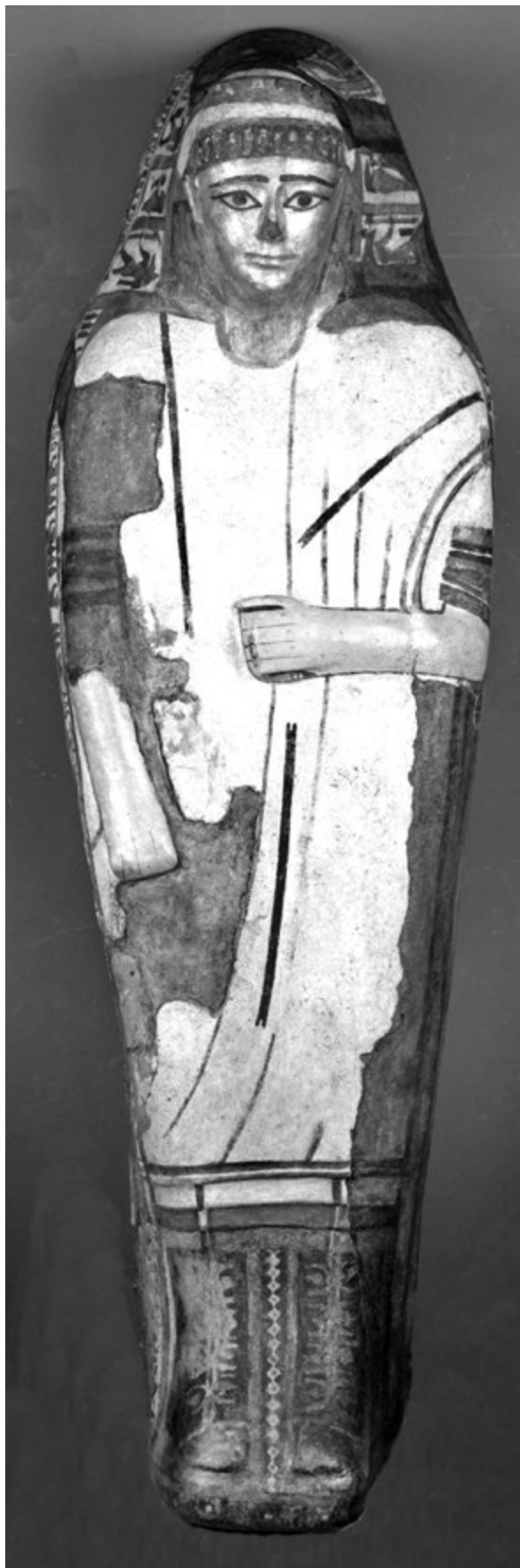
12. kép. Egyiptomi kartonázs koporsófédél. Kr. e. 1. – Kr. u. 1. század (Egyiptomi Gyűjtemény)