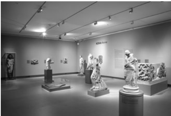
2. kép. „Téglalap” = Hellas, Itália, Róma (2a: Itália, 2b: Hellas, 2c: Róma)

neyei között mit és hogyan mutasson be egy antik művészeti kiállítás.