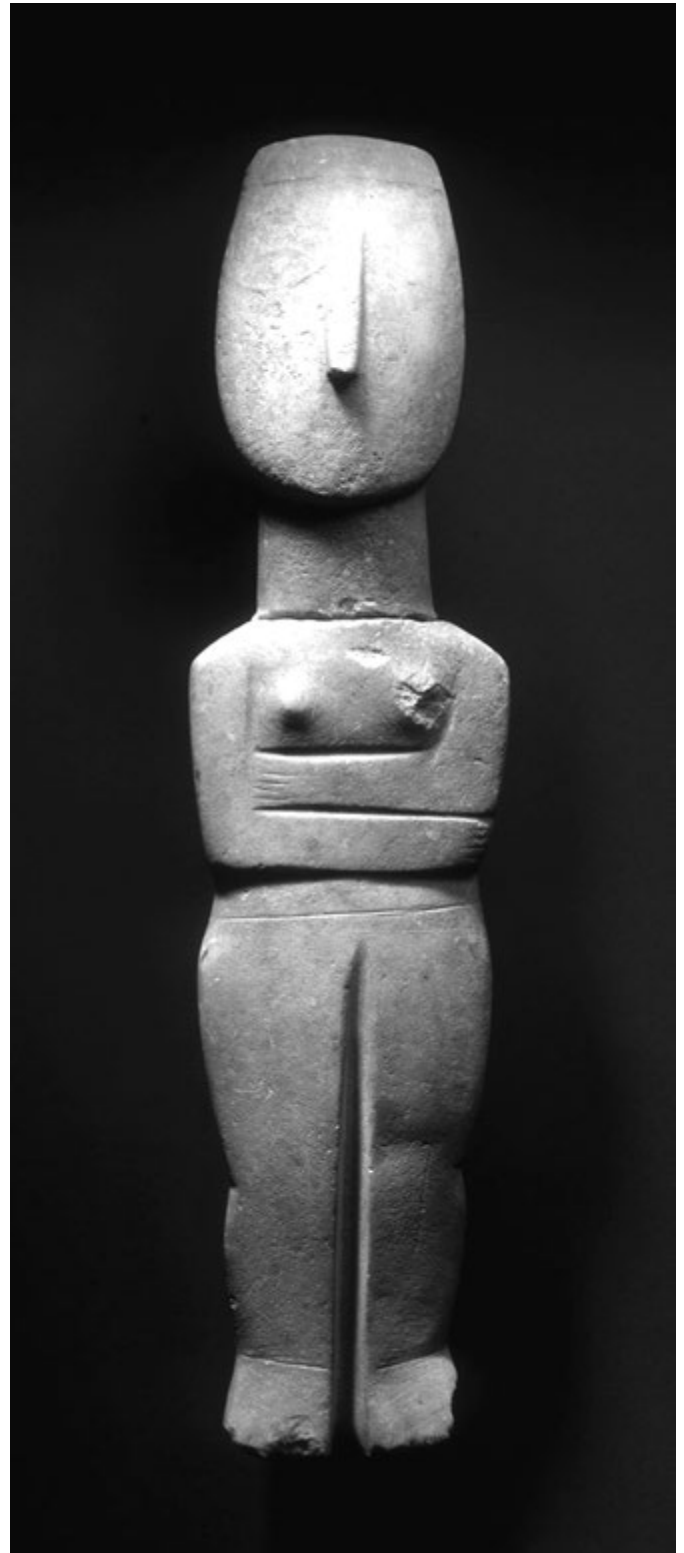
5. kép. Márvány nőalak a Kykládokról, Kr. e. 2700–2400

A kiindulópont természetesen adott, ám rögtön a feloldás irányában hat. A nagyméretű kykladikus idol, a gyűjtemény egyik kiemelkedő darabja, a bejáratnál, a kiállítás címét két nyelven közlő felirat alatt, környezetéből egyes-egyedül kiragyogva úgy várja a látogatót, mint egy hajdani kultúra néma őrzője, a történelem anyala (5. kép).