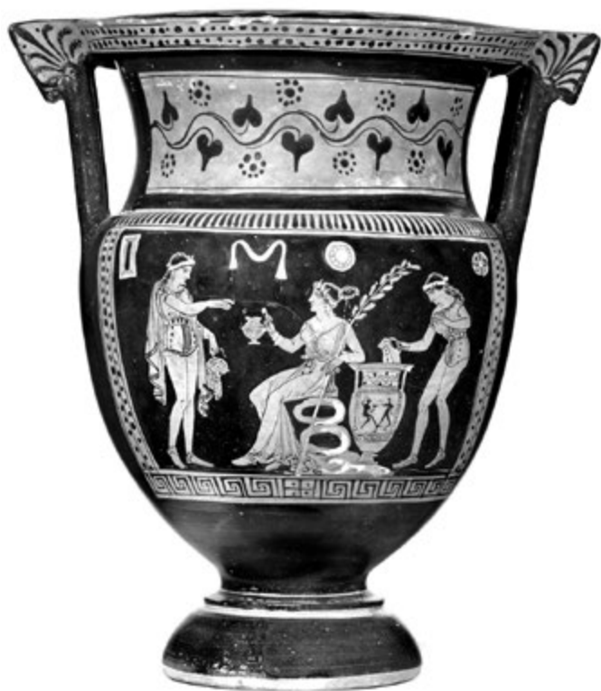
8. kép. Apuliai vörösalakos oszlopkratér. Letét-csoport, Kr. e. 360–350

dimenziókat mozgat meg. Míg ez a „kicsinyítő tükör” a korban talán használati utasításként rögzítette az éppen használt tárgyat a rajta ábrázolt dionyszosi (és itt egyszersmind: hadési) világban, addig mi mindezen túl azon is eltöprenghetünk, hogy az a stilizált tánc, amelyet a képen szereplő kép ábrázolni látszik, miképpen azonos és mégsem azonos az általunk elsődlegesen szemlélt jelenettel: lehet, hogy egy létszférával már arébb vagyunk? A váza tehát bármely teremben helyet kaphatott volna. Ez egyáltalán nem hiba, hanem a kiállítás sajátosságából fakad: egyedi döntésekkel kellett itt vagy ott elhelyezni a tárgyakat, miközben maguk a feliratok jelzik azokat a további összefüggéseket, amelyek nyomán a látogatók képzeletben akár újra is rendezhetik a kiállítást. (Itt jegyzem meg, hogy mennyire lényegre törőek és tanulságosak a kiállítás magyarul és angolul is olvasható felirataival. 24 )