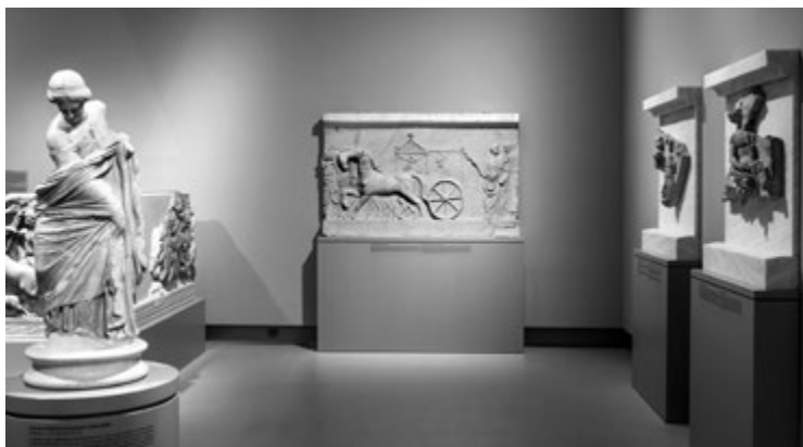
15. kép. Három relief az actiumi domborműsorozatból (Kr. u. 1. század közepe), előttük balra: Kislány szobra („a Budapesti táncosnő”) (Róma, Kr. e. 240–220 vagy 150–100 körül)