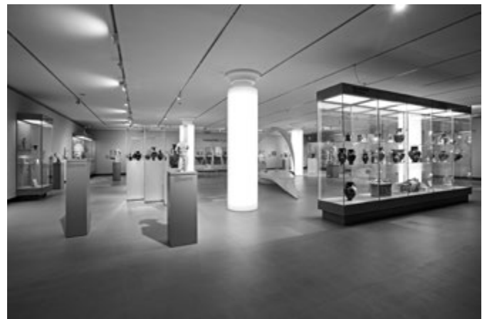
4. kép. „Négyzet” = „Lépjetek be, itt is istenek vannak”: Erós, Dionysos, Thanatos