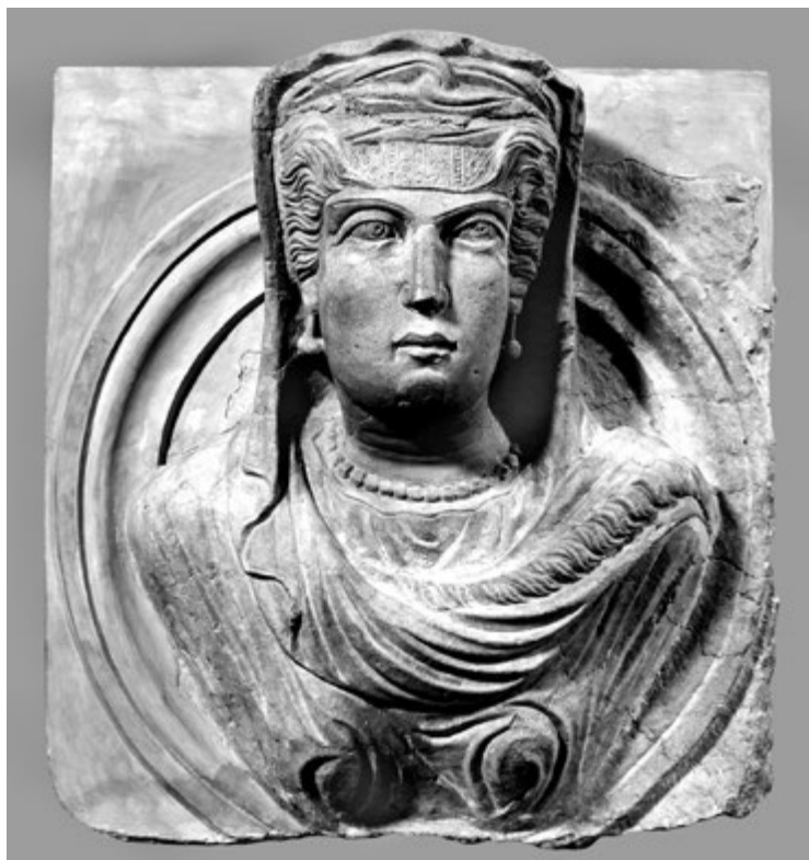
14. kép. Nő sírköve. Palmyra, Kr. u. 2–3. század fordulója