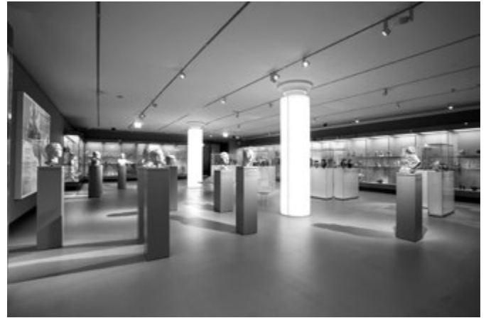
3. kép. „Csonka négyzet” = Kultúrák uniója: az ókori Mediterráneum