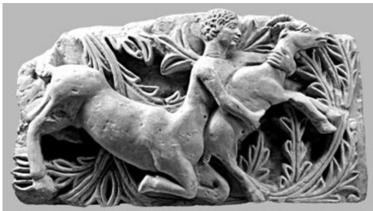
13. kép. A vadászó kentaur: dombormű. Egyiptom, Kr. u. 330–360