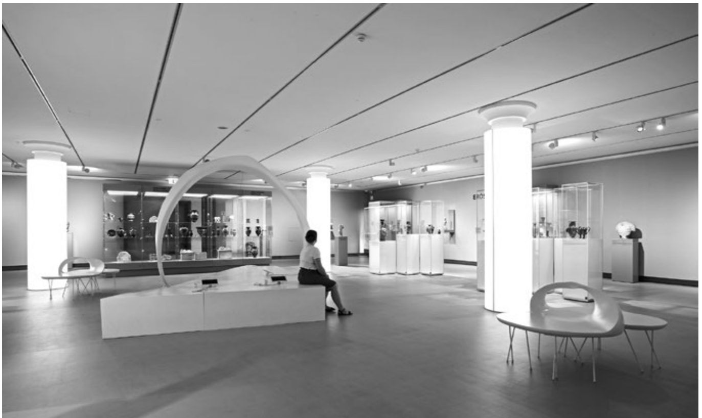
16. kép. Kelemen Zénó műalkotásán üldögélő látogató a Négyzetben

Három kritikai megjegyzést szeretnék megfogalmazni. Az első kifogásom: a metakiállítás hiánya. Tekintettel Szilágyi és Nagy gyűjteménytörténeti munkásságára, 30 a gyűjtemény ösz-