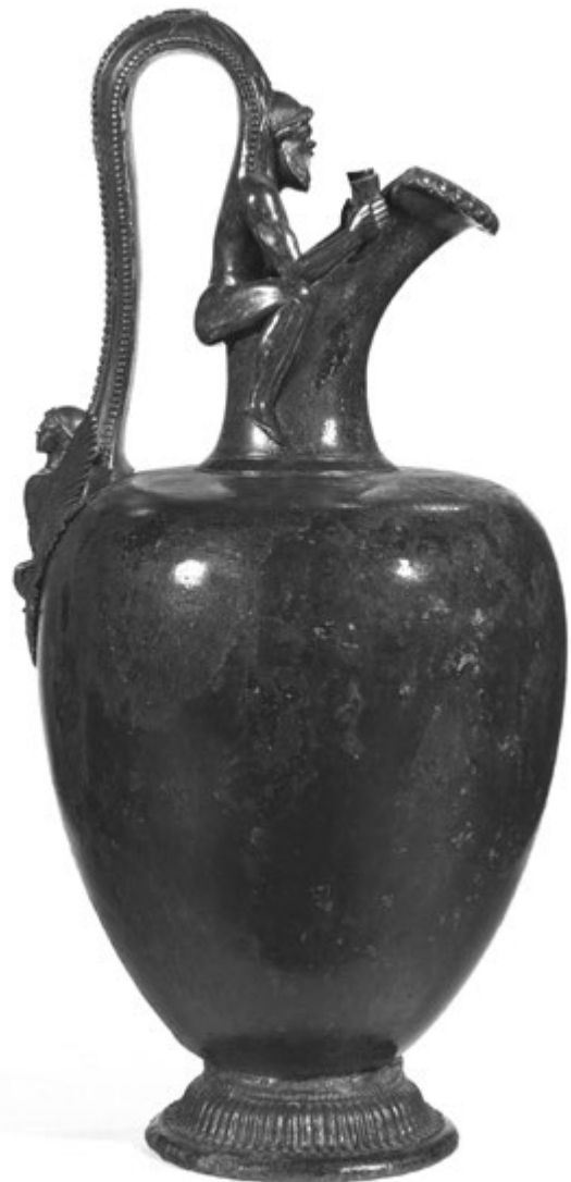
11. kép. A Grimani-kancsó (bronz). Kr. e. 450 körül