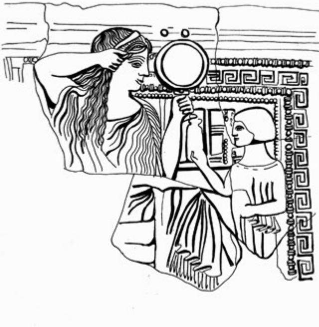
10. kép. Lokroii pinaxtípus: a menyasszony szépítkezik (Szabó Krisztina rajza régészeti leletek alapján)

Medma és Hippónion szentélyeiről és kultuszairól ma még kevesebbet tudunk. A rítusok legfontosabb tanúi, a fogadalmi terrakották azonban megengednek egy óvatos feltételezést, éppen annak alapján, amit a három repertoár kapcsolatáról mondtunk. A lokroii pinaxok példányai kisebb számban, de a két másik város szentélyeiből is előkerültek. Maguk a szobrocskák a Kr. e. 5. század első felében minden részletükben a pinaxok on ábrázolt nőalakokhoz hasonlítanak: öltözetük, hajviseletük, trónusuk részletei mind megfelelnek a trónoló Persephoné képein láthatónak, az ölükben tartott tárgyak – a kakas, a galamb, az áldozati csésze, a ládika és egyebek – szintén visszatérő elemei a pinaxok jeleneteinek, mindig ugyanúgy ábrázolva. Mindezekén túl pedig az a közös formanyelv, amely a három város szobrai jellemzi, egyszersmind a pinaxok formanyelve is. Vajon a formai egység azonos hiedelmeket és szokásokat, a három város polgárai által közösen gyakorolt rítusokat tükröz? Vagy fontosabbak a Lokroi-kör egyes városain belül a fogadalmi ajándékok repertoárjában érzékelhető helyi változatok? Ezekre a kérdésekre a medmai és hippónioni szentélyek emlékanyagának részletes kutatása fog majd a mainál pontosabb válaszokat adni.