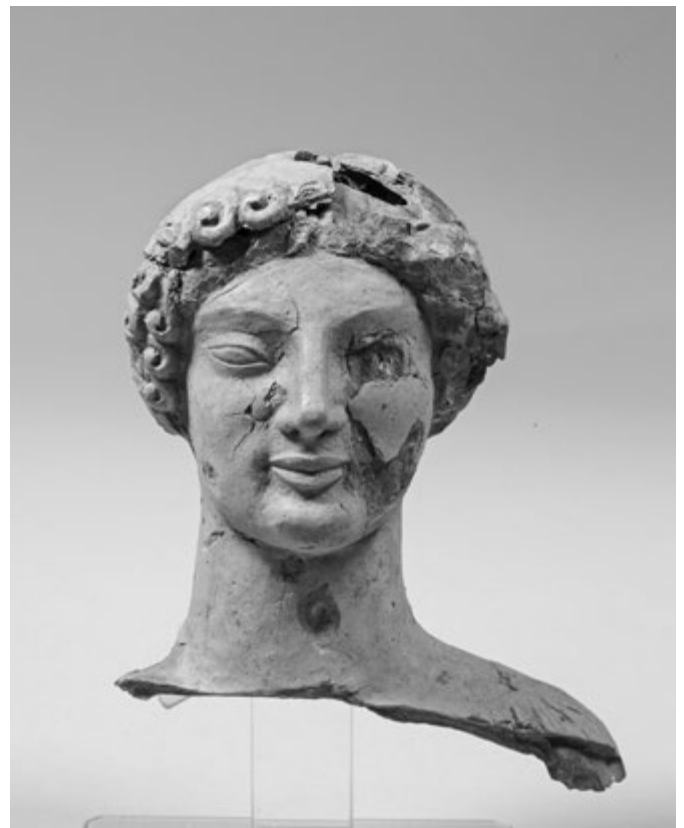
4. kép. Trónuson ülő nőalak töredéke a Calderazzo-szentélyből, Rosarno, Museo Archeologico, inv. 11444