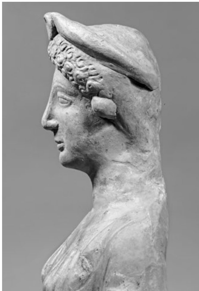
5. kép. Álló nőalak a Calderazzo-szentélyből, Rosarno, Museo Archeologico, inv. 11439