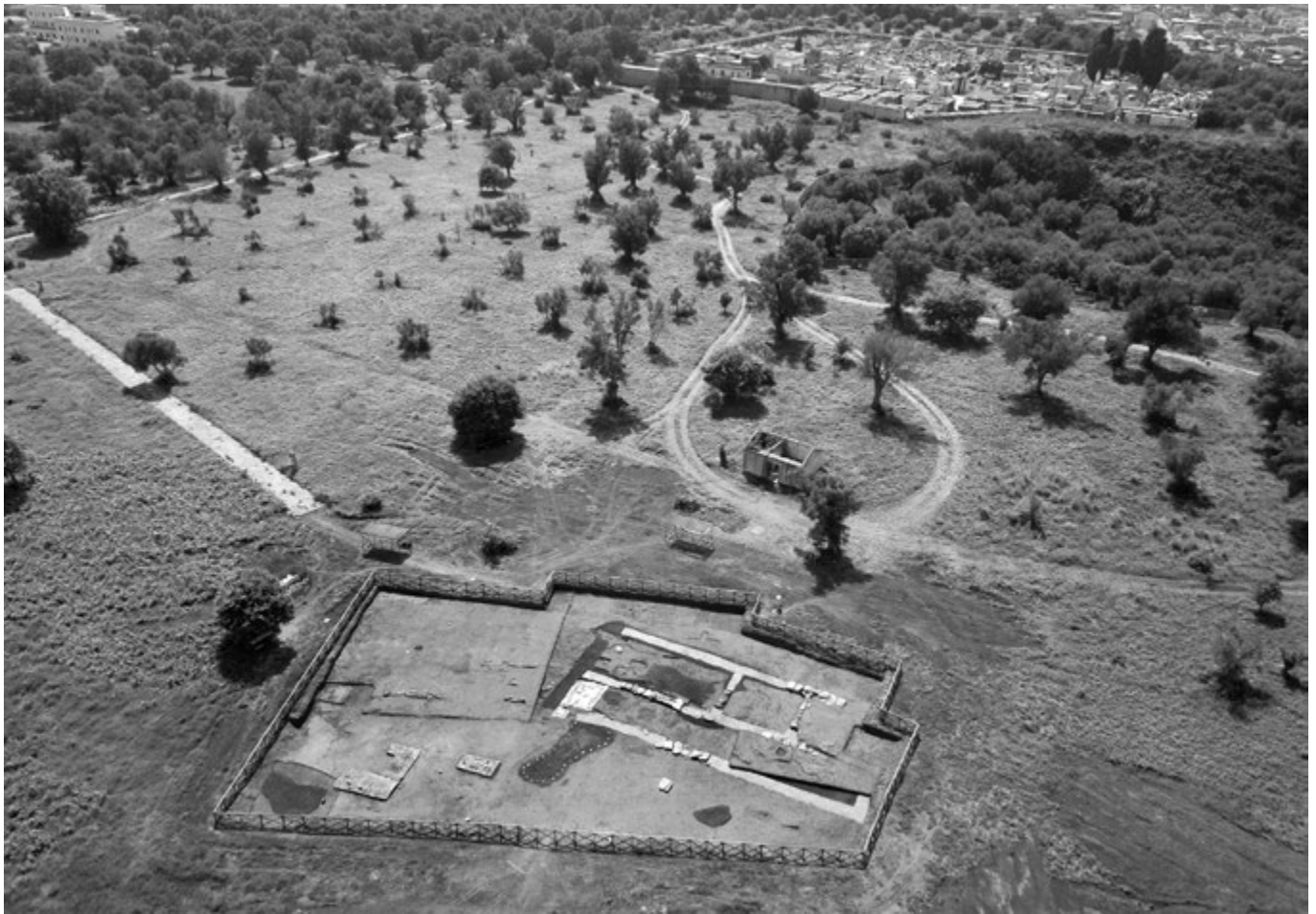
1. kép. A Calderazzo lelőhely szentélykörzete, légifotó, 2018

3,5 méter széles, akkor még körülbelül 30 m hosszúnak tűnő árok volt, amelybe még a szentély ókori használói temették el rituálisan a fogadalmi ajándékokat. A később, főleg 2014-ben és 2018-ban folytatott ásatások azt mutatják, hogy a hatalmas fogadalmi lerakat még ennél is hosszabb volt. Ezen kívül a környéken, vagyis minden bizonnyal ugyanennek a szentélynek a területén számos kisebb, votív tárgyakkal teli gödröt is találtak. 2018-ban végül sikerült nagy valószínűséggel azonosítani egy kisebb templomépületet is (1. kép).