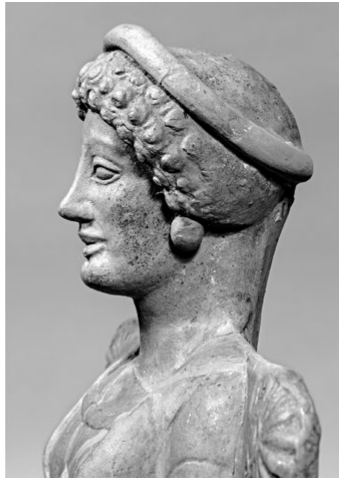
2. kép. Trónuson ülő nőalak a Calderazzo-szentélyből, Rosarno, Museo Archeologico, inv. 1126