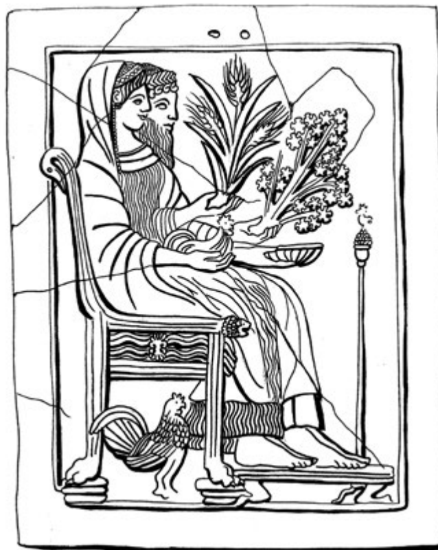
8. kép. Lokroii pinaxtípus: Persephoné és Hadés az Alvilágban (Szabó Krisztina rajza régészeti leletek alapján)

A lokroii pinaxok végtelen gazdagságú repertoárjának rendszerezése hosszú évtizedek munkája után csak a közelmúltban zárult le, de értelmezésükre, a lokroii Persephoné-kultusz lényegének megfejtésére ezalatt is számos kísérlet történt. A kérdés nem tekinthető lezártnak, azért sem, mert az istennő az emberi élet két meghatározó fordulópontjának is pártfogója és megtestesítője volt: a házasság, a nőiség kiteljesedése az egyik, a halál, a földi életből egy másikba való távozás a másik. Lokroi polgárai, elsősorban lányai és asszonyai, talán a lét mindkét