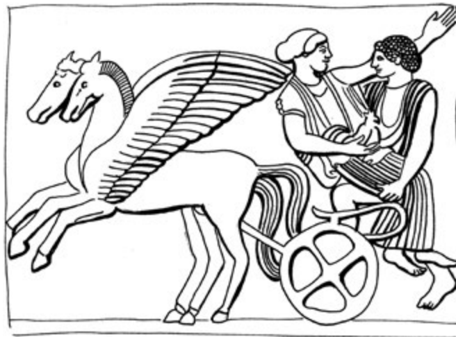
7. kép. Lokroii pinaxtípus: Persephoné elrablása (Szabó Krisztina rajza régészeti leletek alapján)

Egy másik sorozatuk ezzel szemben mintha halandó lányokat ábrázolna, hétköznapi és ünnepi tevékenységek, leginkább talán a menyegzőt előkészítő rítusok közben (10–12. kép).