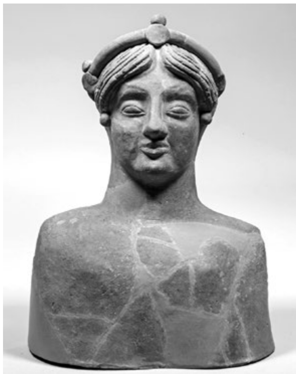
6. kép. Női büszt a Calderazzo-szentélyből, Rosarno, Museo Archeologico, inv. 10733