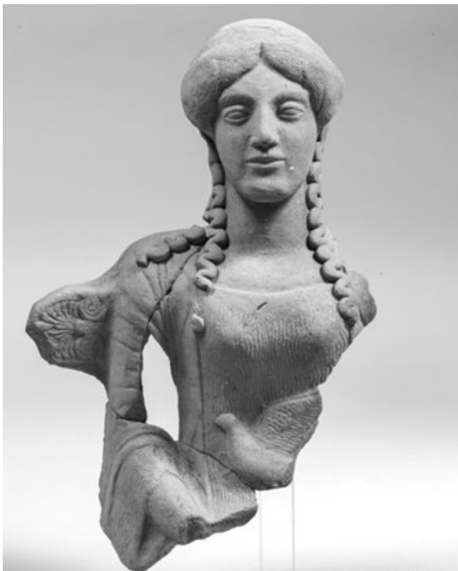
3. kép. Trónuson ülő nőalak töredéke a Calderazzo-szentélyből, Rosarno, Museo Archeologico, inv. 40407