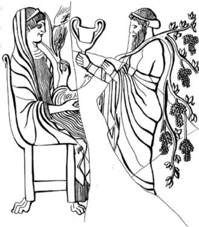
9. kép. Lokroii pinaxtípus: Persephoné Dionysos hódolatát fogadja (Szabó Krisztina rajza régészeti leletek alapján)

nagy kérdésére tőle vártak választ, amikor tiszteletére rítusokat mutattak be a Mannella-dombi szentélyben.