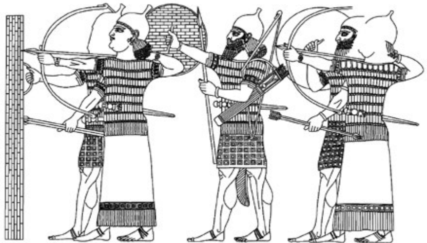
3. kép. Asszír eunuch és szakállas katonák (Dezső 2012a, 314, 94. kép nyomán)

Ha a királyoknak nem is kellett félniük a főembereiktől mint szervezett csoporttól, egyes méltóságviselők elég veszélyesek lehettek, kiváltképpen a jelentős létszámú hadsereggel rendelkező tartományi helytartók. A problémát az uralkodók úgy kezelték, hogy a Kr. e. 9. század óta – ennek az újításnak a kezdetét nem lehet pontosan meghatározni – számos fontos csúcspozíciót kizárólag eunuchokkal töltettek be. 28 Emögött az a belátás húzódott meg, hogy a bizonyos méltóságviselők kezében létrejövő hatalomkoncentrációt nem minden esetben lehetett megakadályozni, sőt, az ilyesfajta hatalomkoncentráció bizonyos feladatok esetében olykor szükségessé is vált. Az eunuchok alkalmazása azonban megakadályozta, hogy az efféle hatalmat a következő generáció számára átörökítsék, vagy hogy egy rivális uralkodódinasztia jöhessen létre. 29