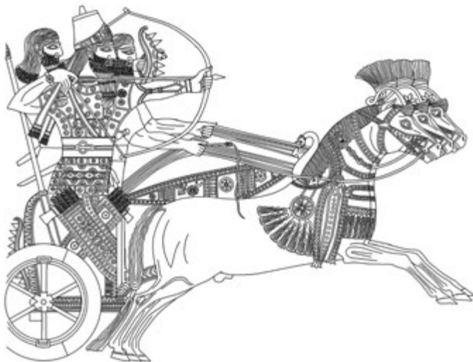
1. kép. Asszír király harci kocsiján (Dezső 2012b, 266, 23. kép nyomán)

történelméről és hadseregéről. Ezt követően ki kell térnünk az asszír gazdaság alapjaira, valamint a hadsereg és a társadalom többi részének viszonyára.