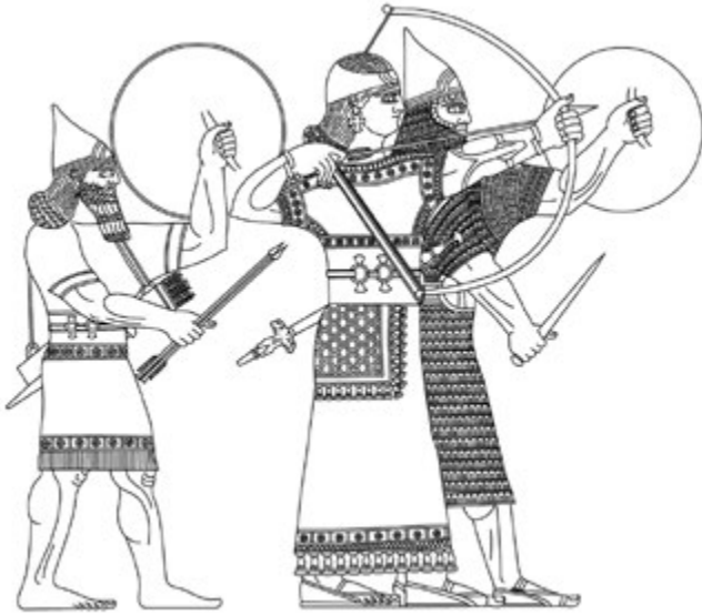
4. kép. Asszír eunuch előkelő (Dezső 2012a, 324, 125. kép nyomán)

Az eunuchok különben nem voltak túlságosan sokan, nem alkottak önálló katonai egységeket, csupán a vezető udvari és katonai beosztásokban találhatjuk meg őket.