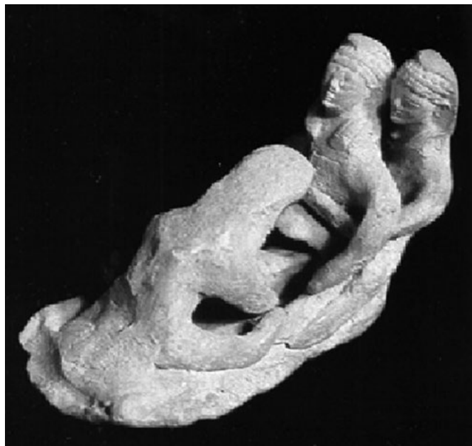
4. kép. Szülő asszony két segítőjével. Terrakotta csoport, Kr. e. 6/5. század, a születés istennőjének szentélyéből, Lapithosról, Ciprusról

Elsőként Andrea Bieler 66 öszövevényes és gyakorlati teológus mutatott rá, hogy a panaszzsoltárok struktúrája sok közös vonást mutat a modern kognitív irányultságú traumaterápiákból származó ismereteinkkel. 67 A zsoltárokból lévő panaszok egy észlelő és „halló” szemközti valósághoz intéznek kiáltásukat, ily módon egy kapcsolatot újbolí felvételeként és intenzitásának növeléseként is jellemezhetőek (Zsolt 22,2; 88,3). Egyfelől „önvizsgálatra” vezetnek, másfelől pedig az ellenállás, változtatás, igazság iránti vágy kifejeződései. Ennek során Isten „halló, észlelő szemközti valóságként” szólíttatik meg, s e beszédaktus fontos lépés a trauma által okozott izolációból és kapcsolati törésből való kilépés útján. 68