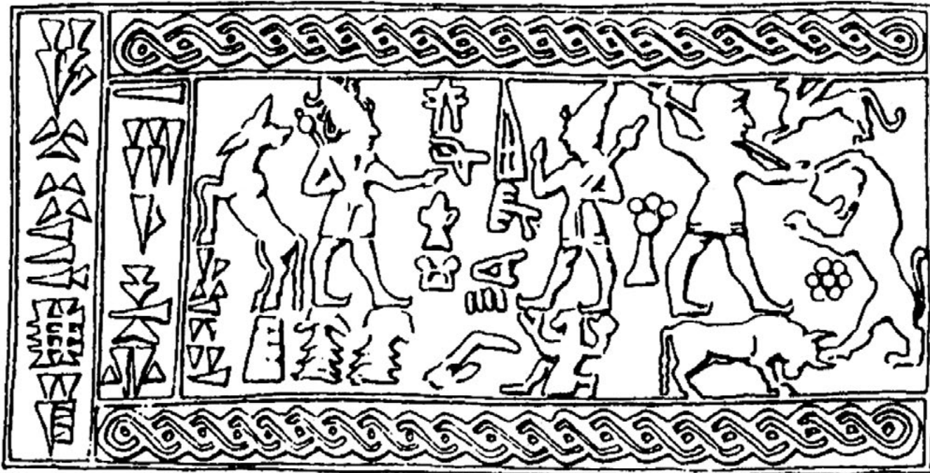
2. kép. Bikán álló viharisten harcban egy oroszlánnal. Pecsétnyomó agyagtáblán, Karkemis, Közép-Bronzkor II/B), Ugarit. Damascus National Museum