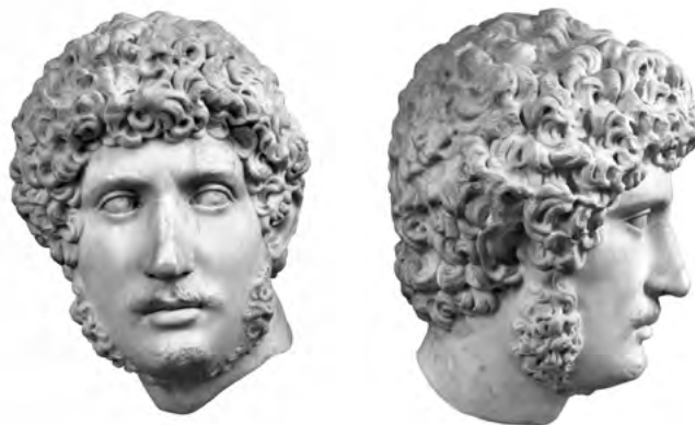
18. a–b. Hadrianus-portré. Madrid, Museo Nacional del Prado, ltsz. 176-E

selet jellemezte: ezzel a technikával a szobrászok úgy tudták érzékeltetni a természetes haj textúráját, hogy a világos és sötét felületek egymás mellé helyezésével dús tömeget képeztek. Korábban a haj anyagszerűségét a felületbe vésett rendkívül vékony vonalak adták, amelyek az egyes hajszálak esését követve sokkal szorosabban simulnak a fejre (4. a–b kép). Az új divat tehát, amelyben a frizurát mélyen fűrt vájatokkal elválasztott fűrtök alkották, új kifejezőmódot adott a haj természetes anyagának ábrázolásához.