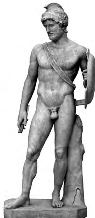
8. kép. Hadrianus mint Mars. Róma, Musei Capitolini, Itsz. 34