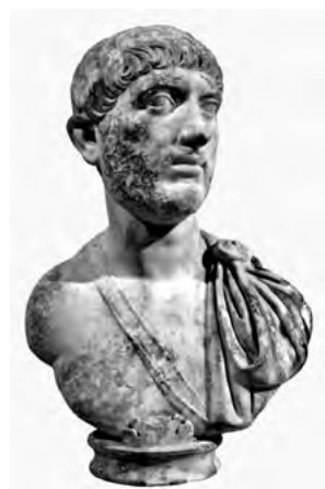
12. kép. Férfi mellszobra. New York, The Metropolitan Museum of Art, ltsz. 1913.231.1