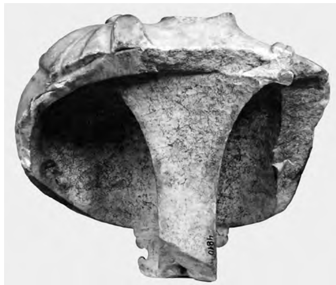
9. a–b. Hadrianus mellszobra. Budapest, Szépművészeti Múzeum, Antik Gyűjtemény, Itsz. 4810 (fotó: Mátyus László)

Az aphrodisiaszi szobrászok, akik gyakran Rómában is a házájukból importált márvánnyal dolgoztak, és olykor szignálták is műveiket, a legmódosabb és legelőkelőbb római polgárok, s főleg a császári udvar számára készítettek szobrokat és portrékat; erről tanúskodnak a Kr. u. 2. századi, göktepei márványból készült darabok. A portrék többsége római ásatásokon került elő, és olyan Róma környéki villákból, amelyek a császárok, illetve a római elit leggazdagabb tagjainak tulajdonában álltak.