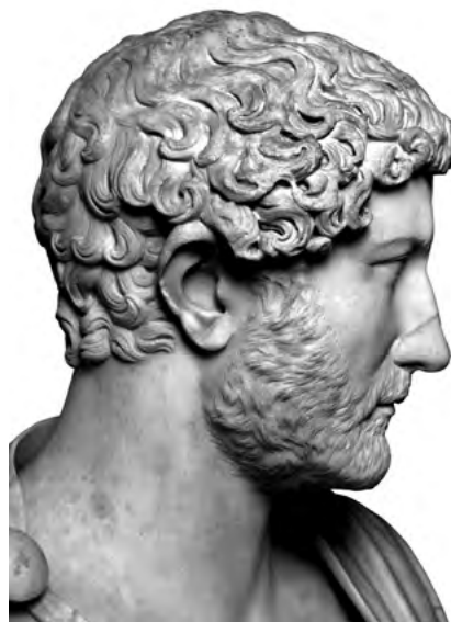
4. a–b. Hadrianus portréja. Nápoly, Museo Nazionale Archeologico, ltsz. 6069