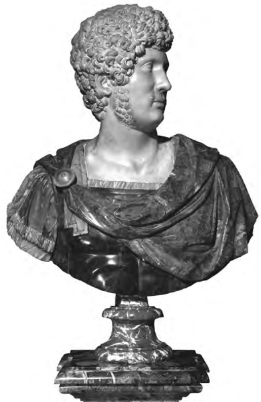
21. kép. Posztantik Hadrianus-büszt. Magángyűjtemény