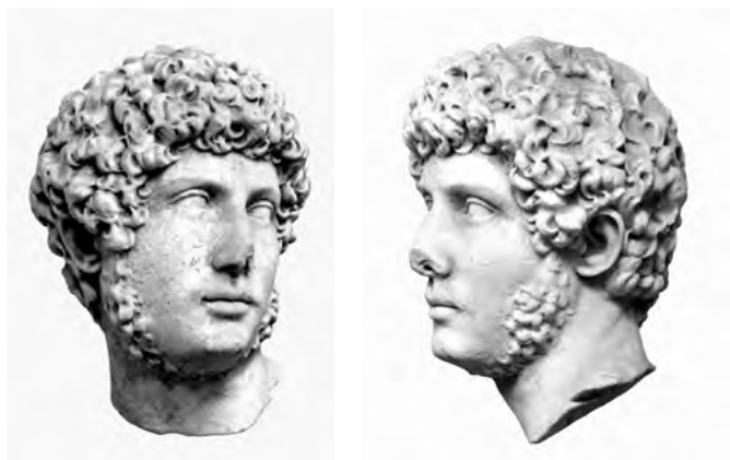
17. a–b. Hadrianus-portré. Hadrianus tiburi villájából, Tivoli, ltsz. 2260