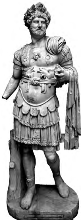
6. kép. Hadrianus mellvértben. Antalya Múzeum, Itsz. 3730+3875