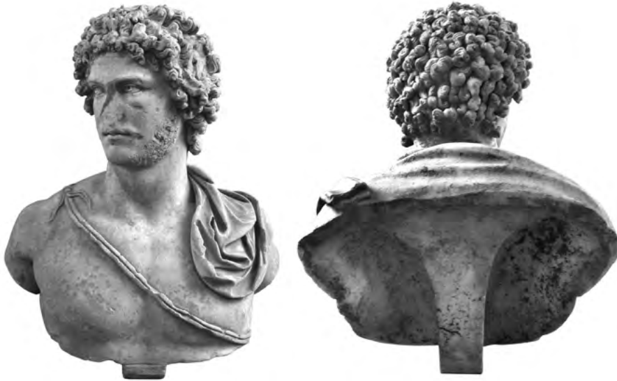
10. a–b. Ifjú mellszobra. New York, The Metropolitan Museum of Art, kölcsön Magángyűjteményből

A portrének ez a típusa legalább négy ókori példányról ismert (17–18. kép), amelyek egyikét 1954-ben találták meg Hadrianus császár villájában, Tiburban (ma Tivoli, Rómától keletre; 17. kép). Minthogy ugyanezt a portrétípust – ugyanezzel a frizurával, barkóval és arcszörzettel – a császár utolsó uralkodási évéből (Kr. u. 137–138) származó aranyérméken Hadrianus neve kíséri (19. kép), a márványszobrokat is Hadrianus-ábrázolásokként azonosíthatjuk. A típus első ízben a már említett, Alexandriában vert pénzekben jelent meg Kr. u. 117–118-ban (lásd fent), miután az ifjú Hadrianus Traianus örökébe lépett (1. kép).