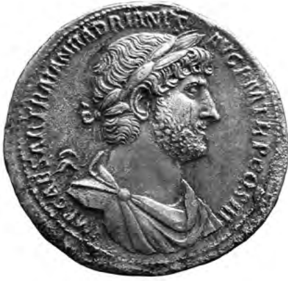
2. kép. Bronzérme Hadrianus portréjával. London, British Museum