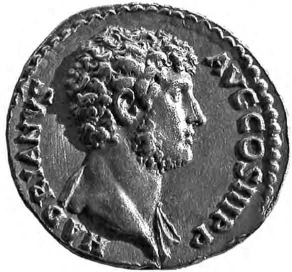
19. kép. Aureus Hadrianus portréjával, Kr. u. 137–138. London, British Museum, ltsz. THO 1433