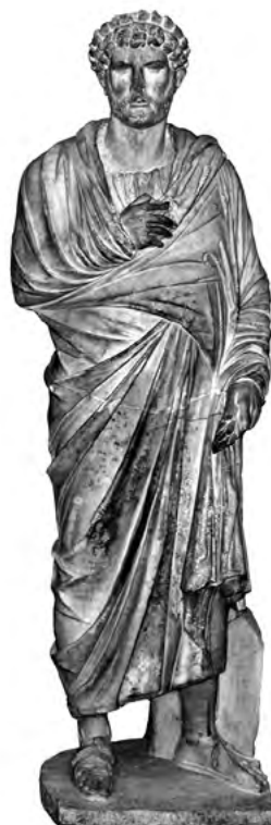
7. kép. Hadrianus himationban. London, British Museum, Itsz. 1861,1127.23