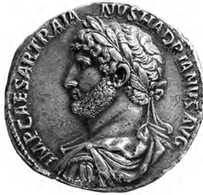
3. kép. Ezüstérme Hadrianus portréjával. Berlin, Münzkabinett

A portrékhoz teljes alakos szobrok tartoztak, amelyek különböző öltözetben jelenítették meg az uralkodót: togában , azaz a római polgárok viseletében (5. kép); mellvértben és a vállon átvetett hadvezéri palástban ( paludamentum , 6. kép), görög köpenyben ( himation , 7. kép) – vagy éppen ruhátlanul, a császárt hősök és istenek, például Mars alakjához hasonlítva (8. kép).