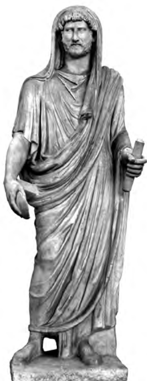
5. kép. Hadrianus togában. Róma, Musei Capitolini, Itsz. 54