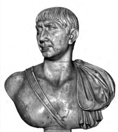
14. kép. Traianus mellszobra. Musei Vaticani, Braccio Nuovo, ltsz. 2269