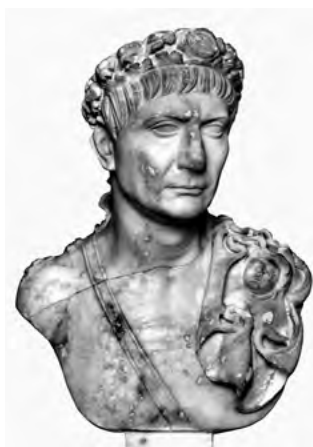
13. kép. Traianus mellszobra. München, Glyptothek, ltsz. 335