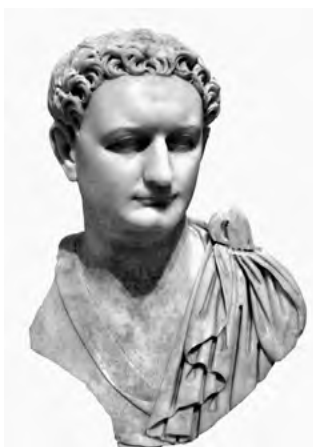
11. kép. Domitianus mellszobra. Toledo (Ohio), The Toledo Museum of Art, ltsz. 1990.30 (fotó: Hans R. Goette szíves közreműködésével)

A típus nagyban különbözik Hadrianus szokásos ábrázolásaitól (4–8. kép). A hosszú, hullámos, a homlok fölött csigákban végződő hajfürtök helyett itt a frizurát meglehetősen dús, rövid fürtök alkotják, amelyeket keskeny, mélyen fürt vajatok választanak el egymástól. Ez a hajviselet az Antoninus-dinasztia korában jött divatba, néhány évvel Hadrianus uralkodása után. Hadrianus utolsó portrétípusa tehát, amelyet az ifjú császár számára kidolgozott provinciális portrék egyike ihletett, olyan divatot teremtett, amely azután évtizedeken át fennmaradt (20. a–b kép). Mély furatokkal kialakított, göndör hajvi-