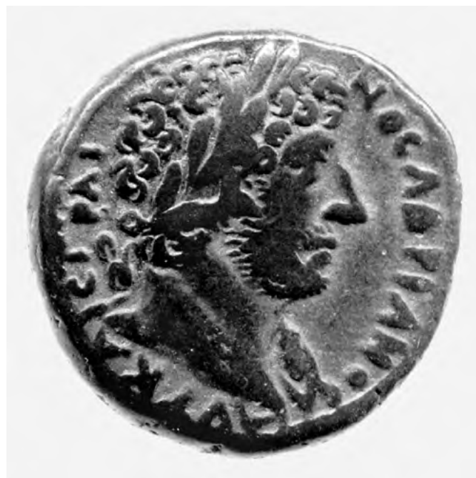
1. kép. Ezüst tetradrachma Hadrianus portréjával. Alexandria, Kr. u. 117–118. Oxford, Ashmolean Museum, RIC III 5006

A birodalom egyéb területein Hadrianust másképp ábrázolták: hosszabb, hullámos haja előre van fésülve és a homlok körül kis csigákba rendeződik, állát és orcáját pedig gondosan ápolt, rövid szakáll fedi (2–3. kép). Ez a komolyságot sugalló külső a márványból faragott portrékra is jellemző (4. a–b kép), valamint a ritkábban fennmaradt bronzszobrokra (a fém-et ugyanis gyakran beolvasztották és újrahasznosították).