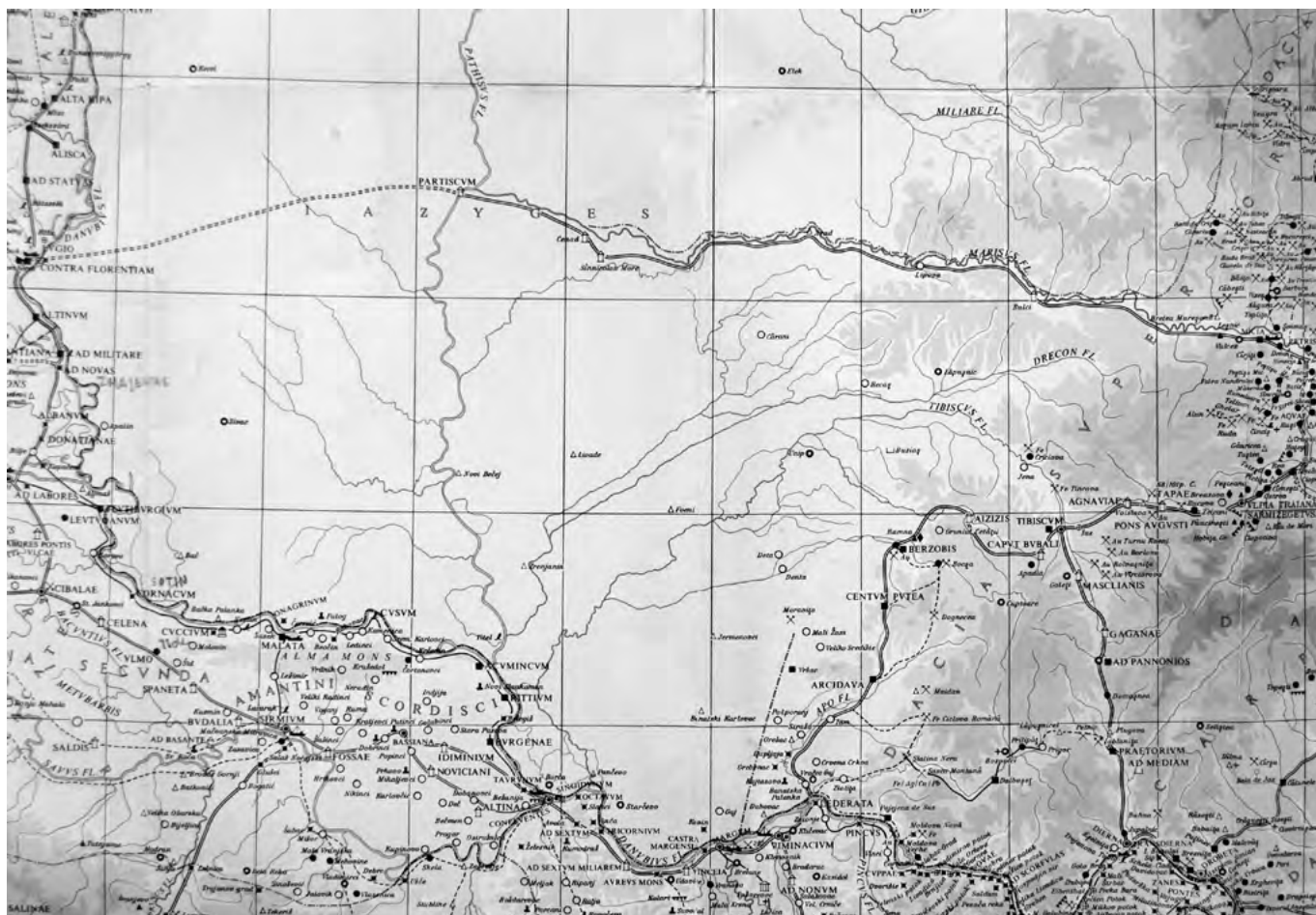
2. ábra. A tabula imperii Romani L 34 lapjának részlete Dacia nyugat felé nyitott határával

A sáncvonal limes ként való értelmezése tehát elképzelhetetlen, de a kérdés továbbra is fennáll, milyen célból hozta létre Róma ezt a rendszert, és hogyan tudta azt biztosítani és fenntartani a szarmata roxolán települési területen. A második kérdésre könnyebb válaszolni, mint az elsőre. A markomann–szarmata háborúk lezárását követő, Commodus (Kr. u. 180–193) által kötött békeszerződések a Duna-vidéken római hegemoniát biztosítottak az itt élő germán és szarmata népek fölött. Ennek eredményeként római épületek is létesültek bárbar földön, és római tisztek gyakoroltak bizonyos értelemben felügyeletet az egyes törzsek fölött, amint arra vonatkozó adatokkal rendelkezünk a Pannoniától északra élő kvádok esetében. Ugyanitt fordult elő, hogy a békét megtörni készülő kvád királyt, Gaiobomarust Caracalla (Kr. u. 211–217) egyszerűen magához rendelte és kivégeztette. Noha nem rendelkezünk hasonló adatokkal a Dacia inferior előterében élő roxolánokkal kapcsolatban, de feltehető, hogy ezen a határvonalon is hasonló rendszer működött, elősegítve a római hegemonia és a béke fenntartását.