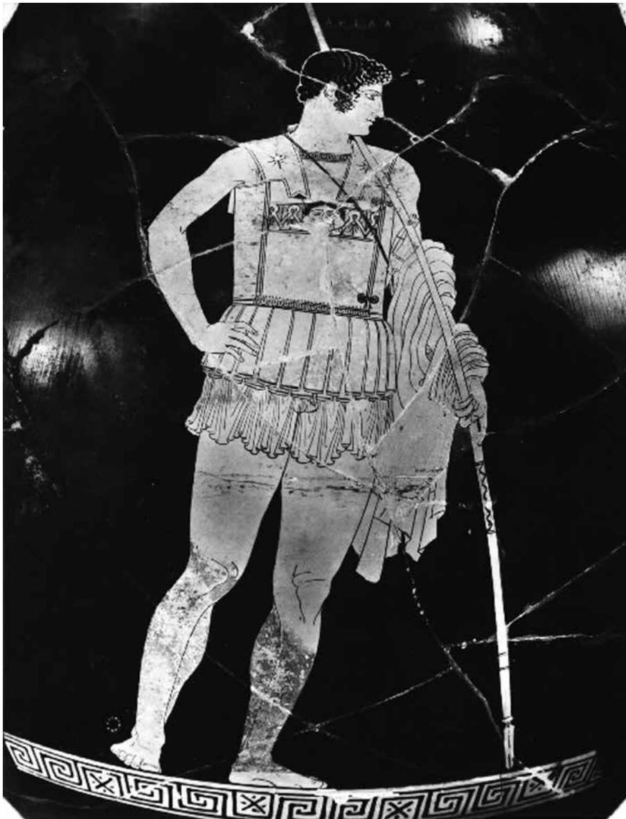
2. kép. Achilleus, az Ilias főhőse Vulciban talált attikai vörösalakos amphorán. Kr. e. 440 körül. Vatikáni Múzeum, Róma

Azonban valamifajta cím nélküli esszégyűjtemény, mely valószínűleg az előkészületben lévő kötetre utal, már 1945. december 9-én készen állt, 20 alig néhány hónappal azt követően, hogy Brelich 1945. augusztus 27-én hazatért Rómába a hadifogságból. 21 Furcsamód azonban bármennyire is a szíven viselte ennek az igencsak kihívást jelentő esszének a sorsát, még csak említést sem tesz róla Storia delle religioni: perché? (Miért a vallástörténet?) című híres önéletrajzi írásában. 22