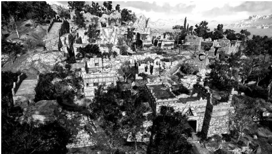
6. kép. Odysseus palotájának virtuális romjai

Vagyis Ithaka szigete Kephallónia mellett található, de hogy mégis hol, és hogy ez a sziget megegyezik-e a mai Ithaka/Ithaki szigetével, annak részleges megválaszolására a következőkben alaposabban kitérünk. Odysseus palotájára az Odysseia első énekétől a huszonharmadikig bezárólag számtalan alkalommal utal a költő, 35 részletes leírások és lazán felskiccelt képek váltják egymást, melyek kiváló lehetőséget teremtettek a rekonstrukcióra.