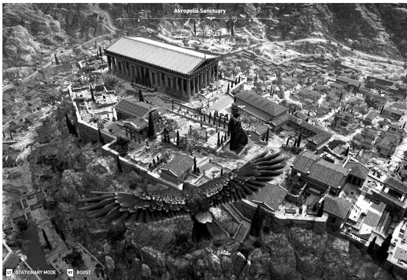
3. kép. Athén városa a magasból