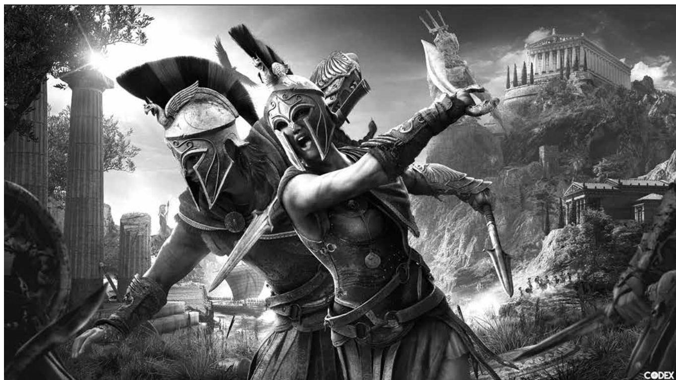
5. kép. Cassandra és Alexios: az ókori világ megismerhető, de a harc a főszerep