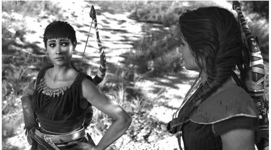
7. kép. Odessa és Cassandra

Odysseus palotájának rekonstrukciós kísérletei a 19–20. század fordulóján foglalkoztatták élénken a kutatókat, melyeket – az izlandi párhuzamokat leszámítva – a mykénéi paloták, leginkább a tiryinsi palota mintája befolyásolt. Az Odyssey készítői is ezt a hagyományt „keltették életre” játékaikban, és ezt a fikatív/tudományos rekonstrukciós kísérletet a mai Ithaka szigetére helyezték.