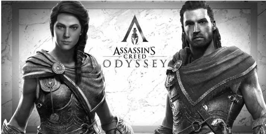
4. kép. Hőseink sisak nélkül

Atörténetírás atyjának játékba hozásával és játékba emelésével ráadásul egy további szinten is játszanak a játékosokkal a fejlesztők. Mivel a múlt megismerésének kérdése a játék epizemológiai és ontológiai tétje, az már csak hab a tortán, hogy egy fiktív történeti szálát is megismerhetünk, nevezetesen a Kozmosz szekta tevékenységét a peloponnésosi háború idején, melyet egy történetíró ismertet a játékon belül a főhősnek Delphoiban : így a történeti igazság és megismerés alapjául szolgáló karakter és történetileg igazolt alak egy olyan helyen, Apollón jósdájának szentélykörzetében mondja el mindezt, ahol a kettős beszéd, a kétértelmű jóslatok mindennaposak, melyek akár birodalmak sorsát is eldönthették (nem véletlen, hogy a Kozmosz szekta éppen a Pythián keresztül akar aztán zavart és káosz okozni a görög polissok között). A delphoi kettős beszéd mintha magába sűrítene a történeti megismerés kettősségét, a féligazságok világát, a háttérben meghúzódó, de mások számára – kivéve a játékosok és a főhős a diegetikus szinten – megismerhetetlen háttértörténetet, a kimondatlan, leíratlan titkos történetet, melyet mégis megírt Hérodotos, de az elveszett. A konteók zavarba ejtő háttérvilágát a pseudo-antikvításban a történeti megismerhetőséget affirmáló karakter hozza mozgásba, tárja fel az elhallgatott részét a múltnak.