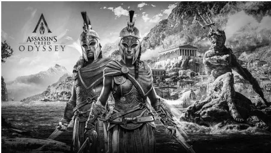
2. kép. Cassandra és Alexios