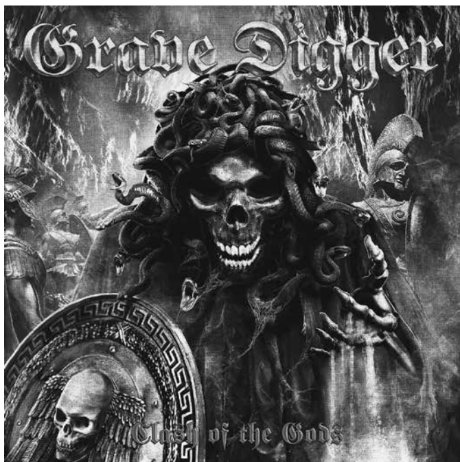
3. kép. A német Grave Digger zenekar Clash of the Gods című tematikus albumának borítója gorgó-parafrázissal

vett téma köré sikerült csoportosítani a szövegeket: kozmológia, teremtés, Alvilág, újjáéledés ( revival ), titkos tudás, az Ilias , az Odysseia , az olymposi tizenkettő, mitológiai helyek, egyéb mitológiai alakok. A homérosi eposzok a világirodalomban elfoglalt helyük miatt kiemelten kezeltetnek, az olymposi istenek is szintén kiemelt jelentőséggel bírnak, míg az „egyéb mitológiai alakok” típusba került az összes többi, a kisebb istenekkel, hősökkel, különös lényekkel, titánokkal foglalkozó dal. A címkézés során ráadásul az adott dalszöveg kiemelt alakja alapján került kategorizálásra egy-egy tétel, így például ha egy dal világosan Medusa alakjára összpontosít, akkor hiába jelenik meg benne Perseus figurája is, a „Medusa” címkét kapta meg (és fordítva). Továbbá minden olyan alak, lény, hely, amely valamilyen módon a halál utáni élettel kapcsolatos, az „Alvilág” címke alá került, legyen az Hadés, a Kerberos, Kharón vagy bármely alvilági folyó. Ennek oka elsősorban a metálzene fentebb hivatkozott gótikus-árnyas-kaotikus érdeklődésében keresendő, hiszen egy alvilági alak nem „pusztán” mitológiai figura, hanem a létezés végső kérdéseivel kapcsolatban álló hatalom.