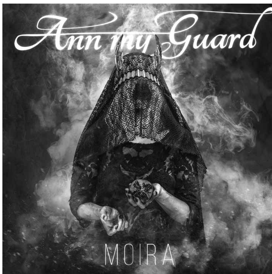
1. kép. A magyar Ann My Guard zenekar Moira című albumának borítója, amelyen Persephoné, az Alvilág királynője kortárs formájában látható

A szóban forgó zenei zsáner első megjelenését az 1960-as évek végére és az 1970-es évek elejére tehetjük, amely szellemi és kulturális értelemben is a nyugati civilizáció számára a nagy átrendeződések időszaka. Az amerikai hippimozgalom, a párizsi diáklázadások, a prágai tavasz, a hidegháború két pólusa, az ellenkultúra létrejötte, 1 valamint az USA határainak megnyitása a távol-keleti bevándorlók előtt 2