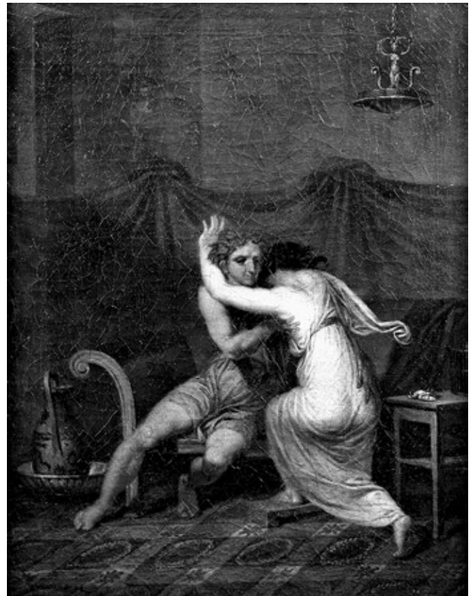
2. kép. Nicolai Abildgaard: Catullus és Lesbia, ahogy karjaiban vigaszt keres a veréb halála miatt (1809). Nivaagaard Museum, Niva

Mindazonáltal a lemmatizálás veszteséggel is jár: a művelet kiemeli a szöveg egy részét a kontextusából, és anélkül veszi szemügyre azt, amelynek eredményeképp a költemény többi része könnyen homályban maradhat. Egyrésztől úgy tűnik, hogy ez történik itt, hiszen ha jobban szemügyre vesszük a Gellius-szöveget, abban is hangsúlyosabb szerep jut magának a deprecor igeének, mint annak, hogy mit is jelenthet valójában ez az ige az adott kontextusban. Persze ezáltal hangsúlyosabb szerep jut magának a gelliusi beszélőnek és az autoritást építő (ugyanakkor egyszersmind önparodisztikus, szatirikus műfaji kódokat is mozgásba hozó) narratívának is. Ebben az értelemben a Catullus- carmen köré épülő metanarratíva „átveszi a hatalmat” a primer szöveg felett, és egy olyan kommentárrá válik, amely, miközben a Catullus-költeményre nézve jelentésredukáló tevékenységet végez, másfelől a párhuzamos szöveghelyek citálásával meg is nyit egyfajta többszólamúságot a saját terében, 36 és nemcsak felszámolni igyekszik a carmen be kódolt inherens homályosságot, de egyben magát a primer szöveget is elhomályosítja, és pusztán az esszé tömör konklúziójában tér vissza hozzá. Tovább erősíti a parodisztikus olvasat lehetőségét, hogy a Gellius-esszé egy, a szöveg megértése